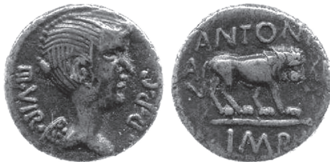
Avers i revers kovanice s prikazom Fulvije (?) kao božice Viktorije

Na pronađenim kovanicama potpisani su službenici zaduženi za kovanje novca C. Numonije Vaala i L. Musidije Long, što dovodi u pitanje identitet žene na prikazu. Naime, za Musidija Longa navodi se da je na položaju službenika djelovao 39. pr. Kr., a malo je vjerojatno da bi se Fulvijin lik nastavio kovati i nakon Antonijeve ženidbe s Oktavijom. Drugi je mogući period Longove službe 42. pr. Kr., a u tom bi slučaju njegove kovanice mogle predstavljati Fulviju; međutim, u tom slučaju Numonije Vaala morao je djelovati 43. pr. Kr., a u tom je razdoblju Antonije bio u sukobu s Rimom te se novac ne bi kovao u čast njega i njegove žene (Wood, 2001: 41-43).