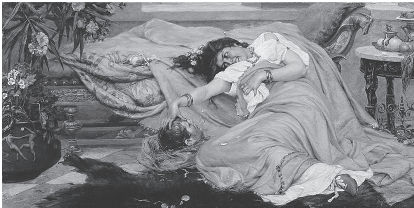
Pavel Svedomsky (1849.-1904.). – Fulvija s Ciceronovom glavom

Sljedeće godine, 41. pr. Kr., Fulvija se u još većoj mjeri isprofilirala kao sudionica javnog života. Te su godine konzulima postali Publije Servilije i Lucije Antonije. Kasije Dion navodi da su u stvarnosti konzulsku moć imali Fulvija i Marko Antonije. Po Dionu, Fulvija nije poštovala Lucija i sve je poslove preuzela na sebe, u tolikoj mjeri da ni senat ni narod nije smio raditi nešto suprotno Fulvijinoj volji (CD 48.4.1). Lucije, brat Marka Antonija, bio je toliko podčinjen da je od Fulvije morao tražiti dopuštenje da održi trijumf nakon pobjede protiv alpskih plemena, čemu se ona protivila. Naposljetku ga je podržala, na što je dobio podršku i senata. Potom je Lucije održao trijumf, a Dion komentira da je, iako je Lucije obavljao rituale, trijumf zapravo bio Fulvijin (CD 48.4.2-6).