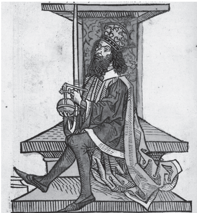
Andrija II. Arpadović

Cjelokupni pregled križarskog pohoda opisuje Toma Arhiđakon u djelu Historia Salonitana . Navodi se da je Andrija okupio brodove iz Zadra, Ancone, Venecije i ostalih gradova jadranske obale te se sa svima našao u Splitu. Opisuje se da je Split bio prepun hodočasnika, križara te da u gradu gotovo nigdje nije bilo mjesta, a kralja je u gradu dočekala gomila ljudi, koja mu je klicala i sl. 9 Gradske su se vlasti pobrinule i da kralj ima dostojan prijam, a kralj je pokazao i blagonaklonost prema Splitu pokušavajući ga „pomiriti“ s utvrdom Klis. Navodi se da je Split poslao dvije galijske galije kako bi pratile kralja do Drača, ali i da se dio križara morao vratiti kući zbog premalo brodova. Toma Arhiđakon opisuje da je kralj u Siriji, na početku svog pohoda imao velike uspjehe, no zbog pokušaja trovanja kralja, morao se vratiti preko kopna, odnosno Antiohije, Grčke i Bugarske. U Bugarskoj ga je kralj Oksan 10 zadržao sve dok nije osigurao da će se vjenčati za njegovu kćer, nakon čega se Andrija II. vratio u Ugarsko-Hrvatsko Kraljevstvo (Toma Arhiđakon, 2003: 92-96).