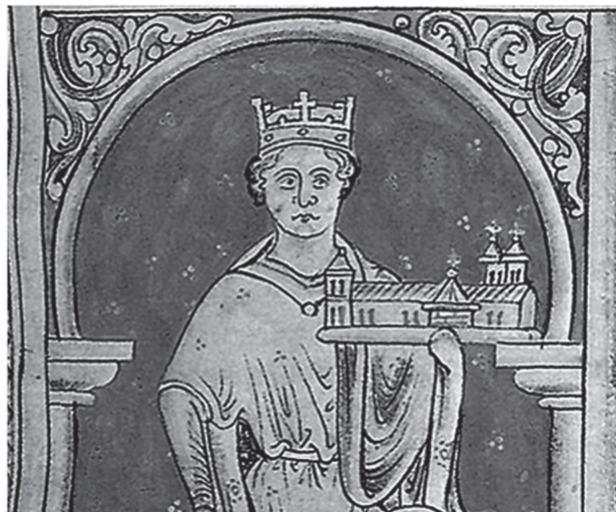
Ivan Bez Zemlje

pojavila su se dva pretendenta na ovu crkvenu poziciju (Maršalevski, 2006: 110). Jedan pretendent za biskupa bio je odabir kralja, a drugi klera. Čitav spor je iznesen papi Inocentu III., koji je odbio oba prijedloga te za biskupa postavio Engleza Stephena Langtona, pariškog profesora teologije. Ivan se kao i neki njegovi prethodnici našao u okrilju sukoba oko investiture. Međutim, za razliku od svojih prethodnika, ustrajao je u potpunoj vlastitoj kontroli izbora, što je rezultiralo time da je papa Inocent III. prokleo čitavo Englesko Kraljevstvo, a 1209. i ekskomunicirao Ivana iz Crkve. Papa je ovlastio francuskog kralja da kazni Ivana te u zamjenu za to ponudio englesku krunu. Zbog neprijateljstva s Filipom II. i Inocentom III., ali i ravnodušnošću vlastitih podanika, Ivan se 1213. godine pomirio s papom, priznao Langtona za primasa Engleske te postao papin vazal, predavši mu Englesku kao leno (Goldstein, Grgin, 2008: 286). Zbog svih ovih okolnosti u kojima se našao, Ivan Bez Zemlje značajno je više vremena provodio u svome kraljevstvu, u odnosu na svoje prethodnike (Hudson, 2018: 194).