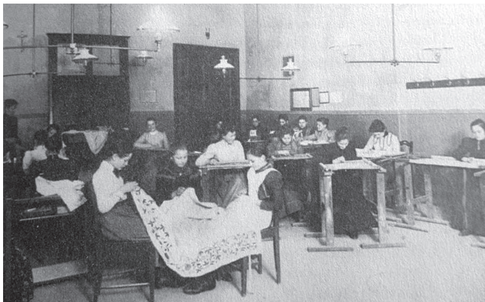
Tečaj vezenja u Ženskoj stručnoj školi u Zagrebu krajem 19. stoljeća

Žene građanske elite uspjele su zbog materijalnih i intelektualnih razloga dobiti određenu autonomiju unutar svoga doma, kao što je biranje posluge, briga o posluzi i