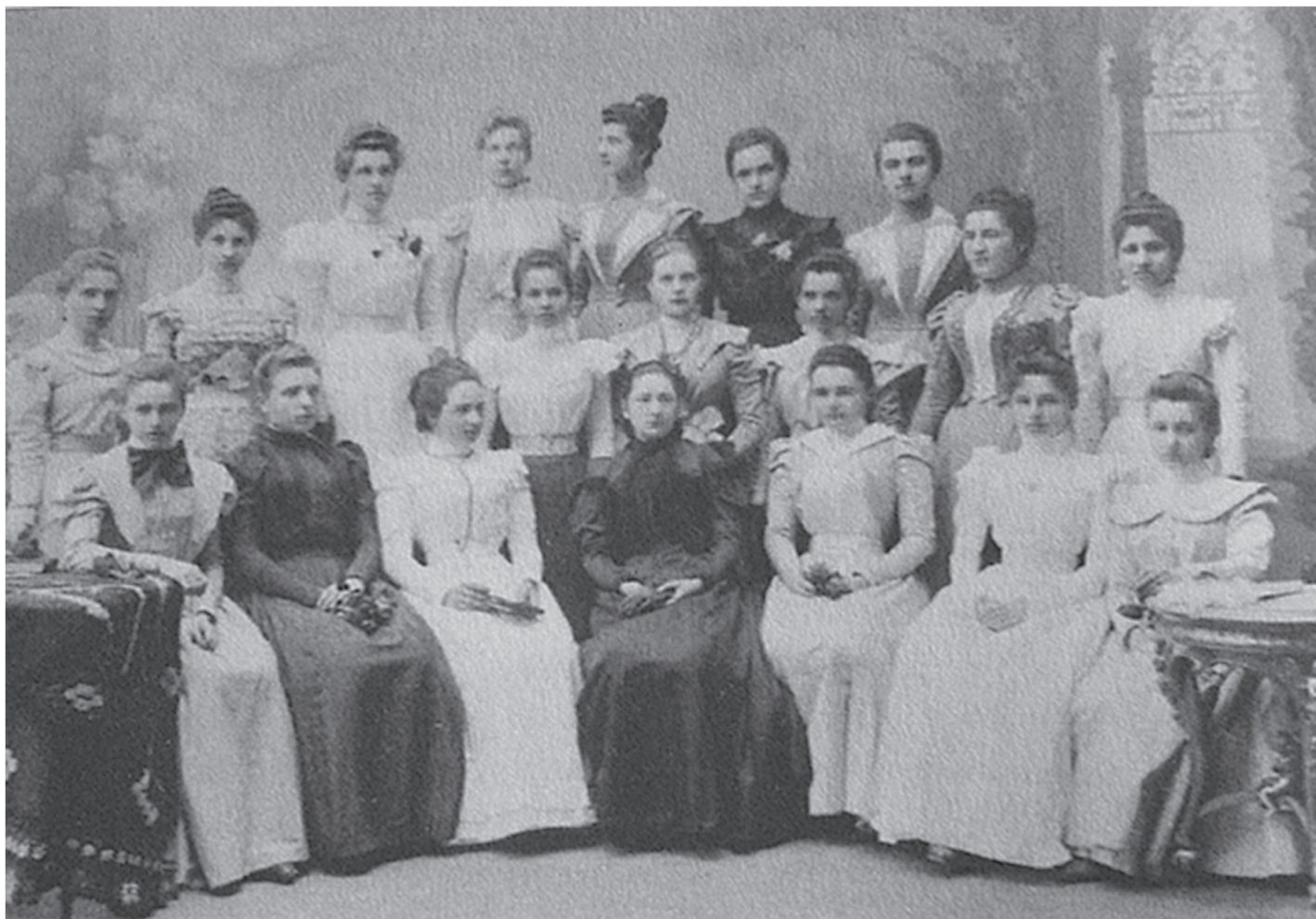
Maturantice Ženskog liceja krajem 19. stoljeća