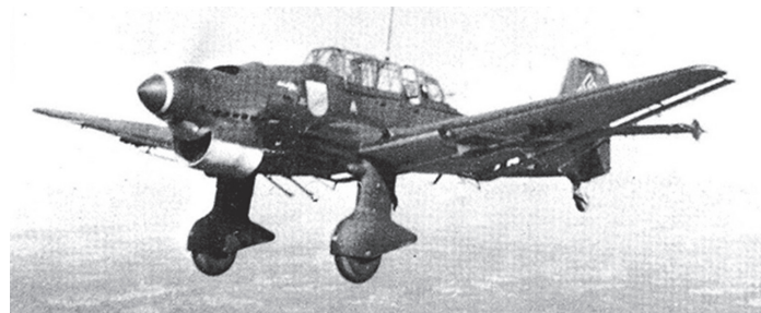
Njemački jurišni avion za obrušavanje Ju. 87 Stuka koji je utjerivao strah u kosti svima koji su čuli njegovu zloglasnu sirenu.