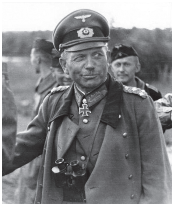
Heinz Guderian – otac munjevitog ratovanja

svjetskom ratu. Schlieffen i Moltke zastupali su potpuno uništenje neprijatelja tako da se on više ne može oporaviti, no svatko je od njih imao vlastiti pristup tomu. Schlieffen je želio uništiti neprijatelja pod svaku cijenu, nije mu bilo bitno koliko će za to resursa i ljudstva iskoristiti, dok je Moltke zagovarao okruživanje neprijatelja, dakle fokusirao se na njegove kretnje i poteze kako bi ih mogao iskoristiti u svoju korist. Okruživanjem neprijatelja prekida se njegova opskrba, a samim time smanjena je potrošnja resursa i ljudstva. Tako da možemo reći da je Blitzkrieg iz Drugoga svjetskog rata spoj ideja pruskih generala i lošeg iskustva rovovskog ratovanja iz Prvog svjetskog rata (Pickar, 1992: 3-6).