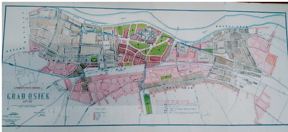
Slika 1. Karta i urbanistički plan (regulatorna osnova) Osijeka iz 1912. godine 15

Kada govorimo o prometnoj infrastrukturi grada, važna je 1869. godina kada je Osijek spojen na tada već razgranatu mrežu željeznica Monarhije. Željeznica je povezivala Osijek s Vilanyjem u mađarskoj Baranji, te Segedinom, a pruga je išla preko Dalja i Subotice. Nadalje, 1893. godine u promet je puštena druga dionica Osijek – Našice, 1905. godine Osijek spojen je s Bosnom preko Đakova i Vrpolja, a posljednja predratna veza ostvarena je 1910. godine s Vinkovcima. 16 Gradski javni prijevoz činio je do 1884. godine tzv. omnibus, koji je imao oblik komode, a vukao ga je konj. 17 Godine 1884. izgrađen je konjski tramvaj, prvi u jugoistočnoj Europi (prije Sarajeva 1885. i Zagreba 1891.). Idućih godina dolazi do širenja tramvajske mreže po gradu. Konjski tramvaji vozili su sve do 1926. godine kada ih mijenja električni tramvaj. Godine 1911. uvedeni su i gradski autobusi, kao konkurencija dioničkom društvu za konjsku željeznicu. 18