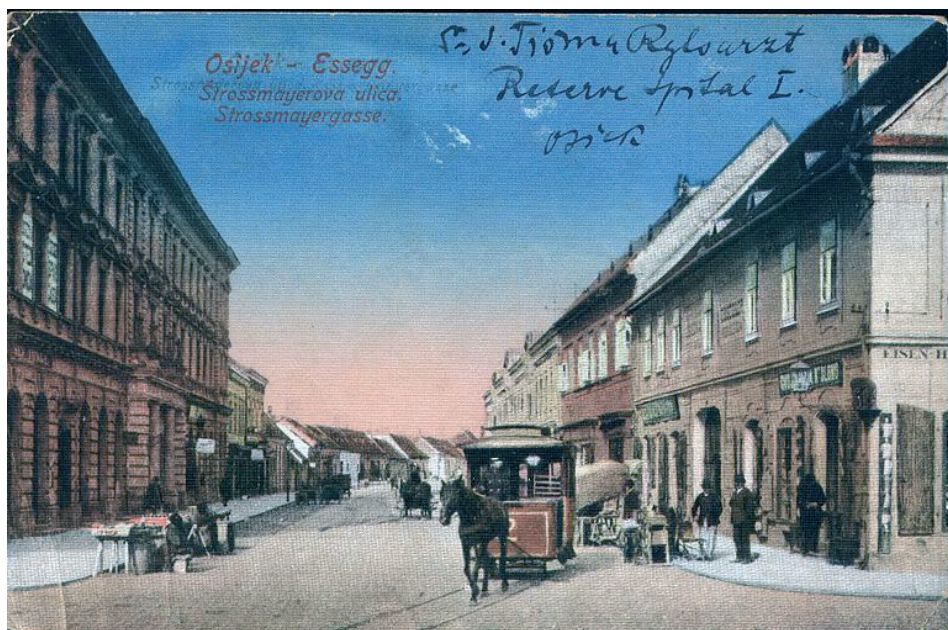
Slika 2. Strossmayerova ulica 38

mitriju Markoviću možemo navesti rođenoga Osječanina Adolfa Waldingera, pejzažista koji je veći dio života proveo u lošim materijalnim prilikama. Štoviše, 1901. godine obratio se Gradskom poglavarstvu s molbom za bilo kakvu novčanu potporu. 36 Srednjem sloju društva pripadala bi i baba Klara, vlasnica najvećega štanda na glavnom tvrđavskom trgu, koja je prodavala sve od kruha, peciva i suhih šljiva do nožića i češljeva. 37