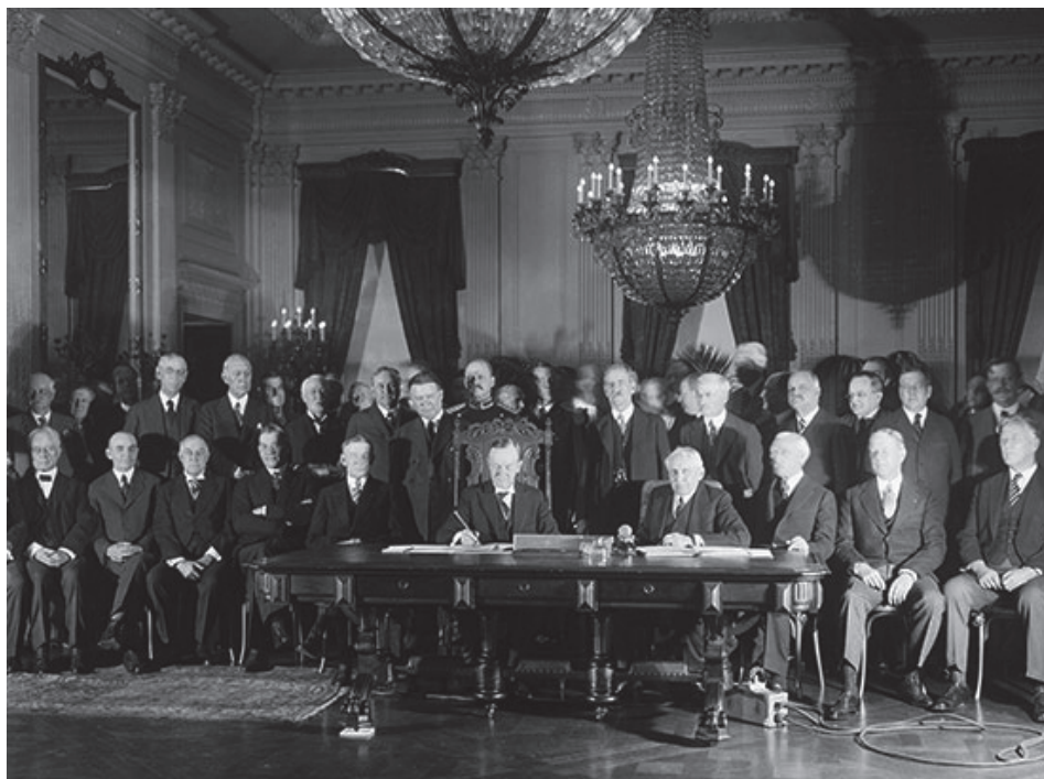
Slika 2. Potpisivanje Briand-Kelloggova pakta, točnije slika prikazuje tadašnjega američkog predsjednika Calvina Coolidgea kako potpisuje pakt u Washingtonu kojim je rat zabranjen kao opcija rješavanja međunarodnih sukoba

tralna država“ kako bi opisala svoju vanjsku i sigurnosnu politiku. Takve su se države poput Švedske u Ligi naroda nazivale „bivšim neutralcima“. Još jedan čimbenik koji je teoretski pokazao da je termin „neutralnost“ zastario bila je legalna zabrana agresivnoga rata, koja je uvedena potpisivanjem Briand-Kelloggovog pakta 7 1928. godine.