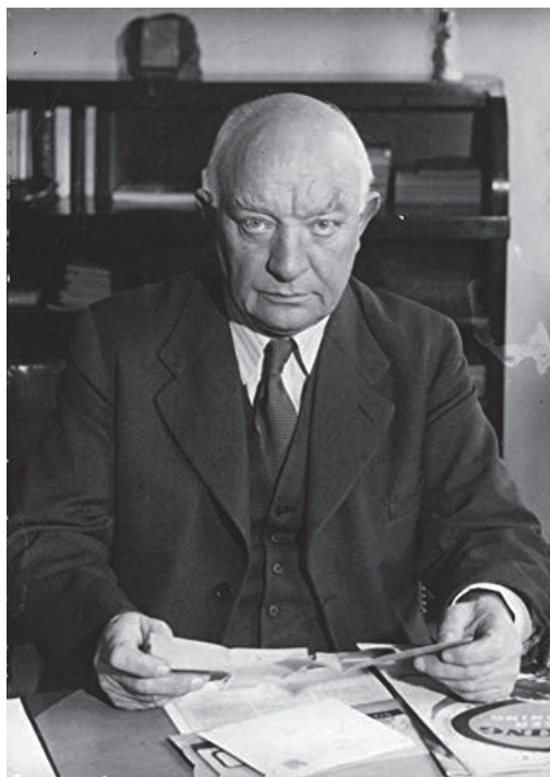
Slika 3. Švedski premijer Pero Albino Hansson koji je proglasio švedsku neutralnost

Drugi svjetski rat započeo je napadom njemačke vojske na Poljsku rano ujutro 1. rujna 1939. godine. U samo nekoliko tjedana Poljska je bačena na koljena te je njemačka vojska došla nadomak Varšave započevši opsadu. Naposljetku, uspjela ju je osvojiti krajem rujna, točnije 28. rujna 1939. godine. Poljska je kapitulirala, a vlada prebjegla u progonstvo. Što se tiče švedske vlade, ona je odmah na dan napada proglasila neutralnost. Druga je skandinavski deklaracija neutralnosti upućena 3. rujna kada su zajedno svoju neutralnost proglasile danska, norveška i švedska vlada. 12