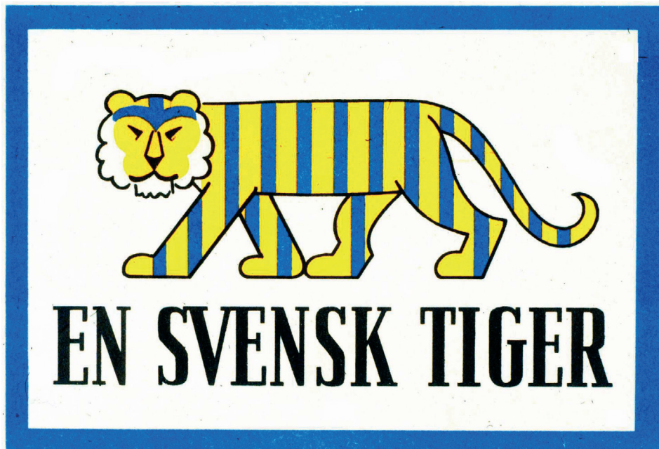
Slika 4. Slogan En svensk tiger, odnosno na hrvatskom „Švedski tigar“. Slogan je bio dio švedske propagande za vrijeme Drugoga svjetskog rata namijenjen sprečavanju špijunaže ostalih zemalja. Međutim, slogan može imati još jedno značenje. Svensk može označavati i Šveđanina, a tigar može predstavljati izreku „držati jezik za zubima“. Tako da može označavati i upozorenje za Šveđane da ne izdaju svoje tajne mogućim stranim špijunima.

Tijekom posljednjih etapa Drugoga svjetskog rata, pred švedsku su vladu ponovno postavljeni teški zahtjevi, ovoga puta od strane Saveznika. Velika Britanija i SAD od švedske su vlade zahtijevale prekid transporta njemačkih vojnika kroz Švedsku te drastično smanjenje trgovine s Njemačkom. Ranije spomenuti nametnuti dogovor između Švedske i Njemačke u srpnju 1940. godine, prekinut je 29. srpnja 1943. godine. Što se tiče trgovine, Njemačka je smanjenjem trgovine sa Švedskom uvelike zakinjuta jer je od Švedske uvozila velike količine željezne rude i kugličnih ležajeva o čemu je ovisila proizvodnja njemačkih tenkova, artiljerije i zrakoplova. U travnju 1944. godine britanska i američka vlada zahtijevale su smanjenje isporuke željezne rude i kugličnih ležajeva Njemačkoj. Švedska je odbila te zahtjeve, no dva dana nakon savezničkog iskrcavanja na normandijske plaže, 8. lipnja 1944. godine, i mnogih privatnih dogovora američke vlade sa švedskom vodećom tvrtkom u proizvodnji kugličnih ležajeva, ipak je odlučila smanjiti njihov izvoz