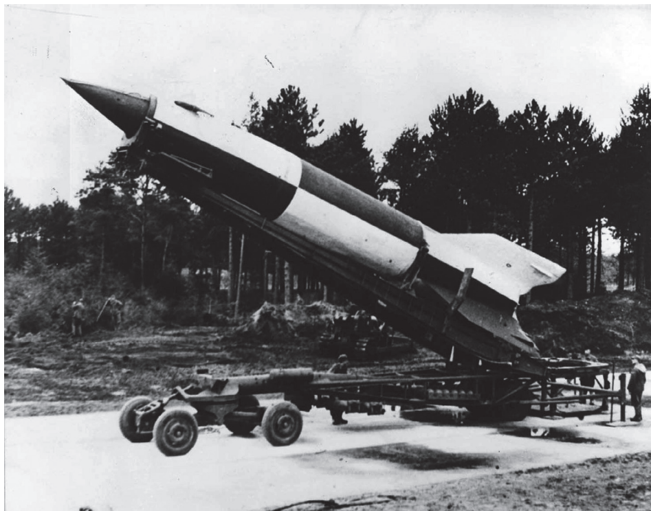
Slika 5. Njemačka V2 raketa, odnosno oružje odmazde koje je tajno istraživala i izrađivala njemačka vlada na sjeveru Njemačke u Peenemündeu

Treba istaknuti da glavni razlog izbjivanja Švedske iz Drugoga svjetskog rata nije bila službena objava neutralnosti, već razloge treba tražiti u njezinom važnom, ali izoliranom geopolitičkom strateškom položaju iza njemačkih granica te njemačkom potrebom za željeznom rudom i švedskim rudnicima. Veliko je nepovjerenje vladalo s njemačke strane, čak su postojali i određeni planovi za invaziju na Švedsku. Od 1943. godine švedska je vlada sve više ulagala u vlastitu obranu što je tvorilo čimbenik koji je zadržavao njemački napad. Neki su povjesničari uspoređivali švedsku neutralnu politiku u Prvome svjetskom ratu sa švedskom neutralnom politikom u Drugome svjetskom ratu. Ti povjesničari smatraju da je neutralnost Hjalmara Hammarskjölda bila tvrdoglavo pravnička, dok je švedska vlada u Drugome svjetskom ratu razvila složeniji diplomatski pristup i metode u postupanju s velikim svjetskim silama kao što su Njemačka i Velika Britanija. Te su metode uključivale korištenje profinjanih nejasnoća, odnosno nejasnih kodova ponašanja što im je u konačnici omogućilo manevriranje vlastitom