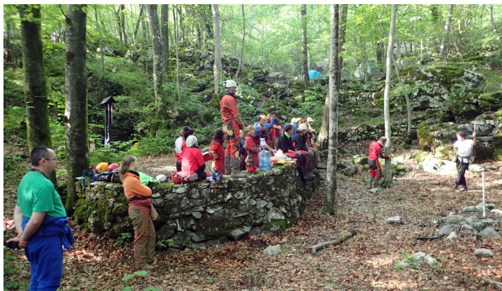
Kalibracija DistoX-a ispred ulaza u Šparožnu pećinu.