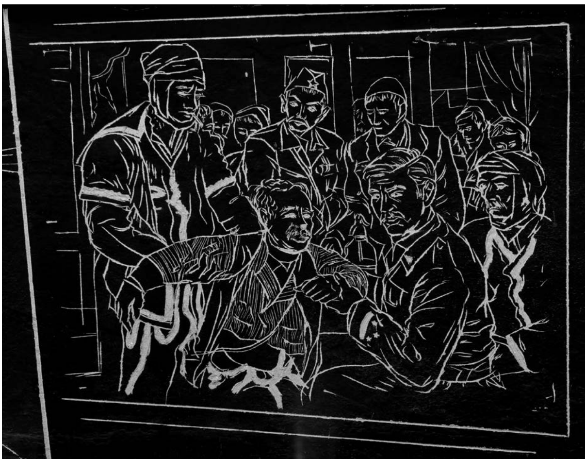
Grafit s prizorom iz filma "Kapetan Leši".