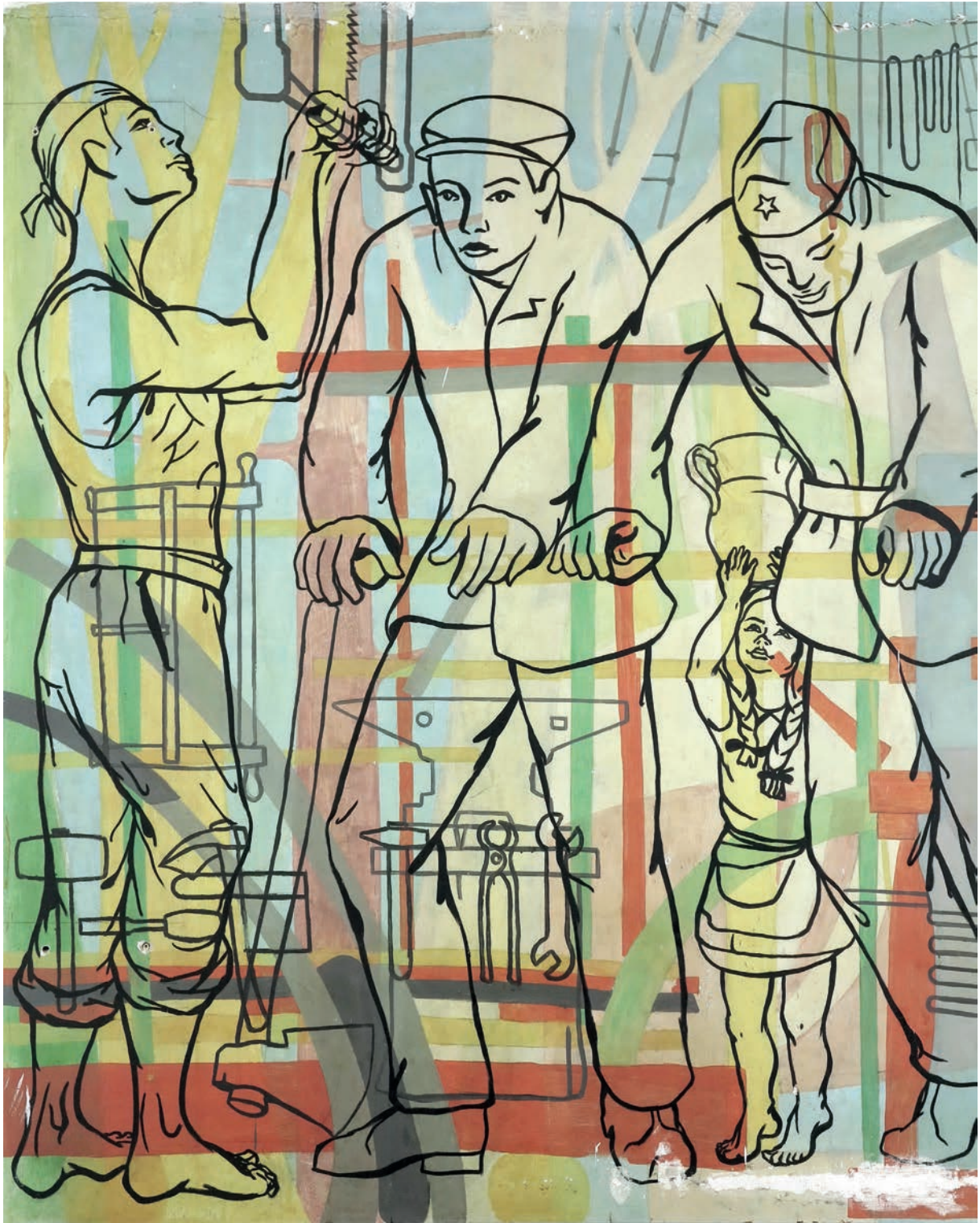
Dio zidne slike u Grebenu