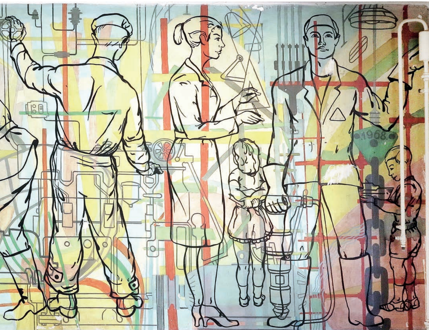
Zidna slika u Grebenu

Bosnić je dobar u osmišljavanju prizora izborom i oblikovanjem elemenata, u senzibilnom slikanju s dobro odmjerenim slaganjem boja te u dobrom crtežu koji je blizak jasnoći onovremenih knjiških ilustracija.