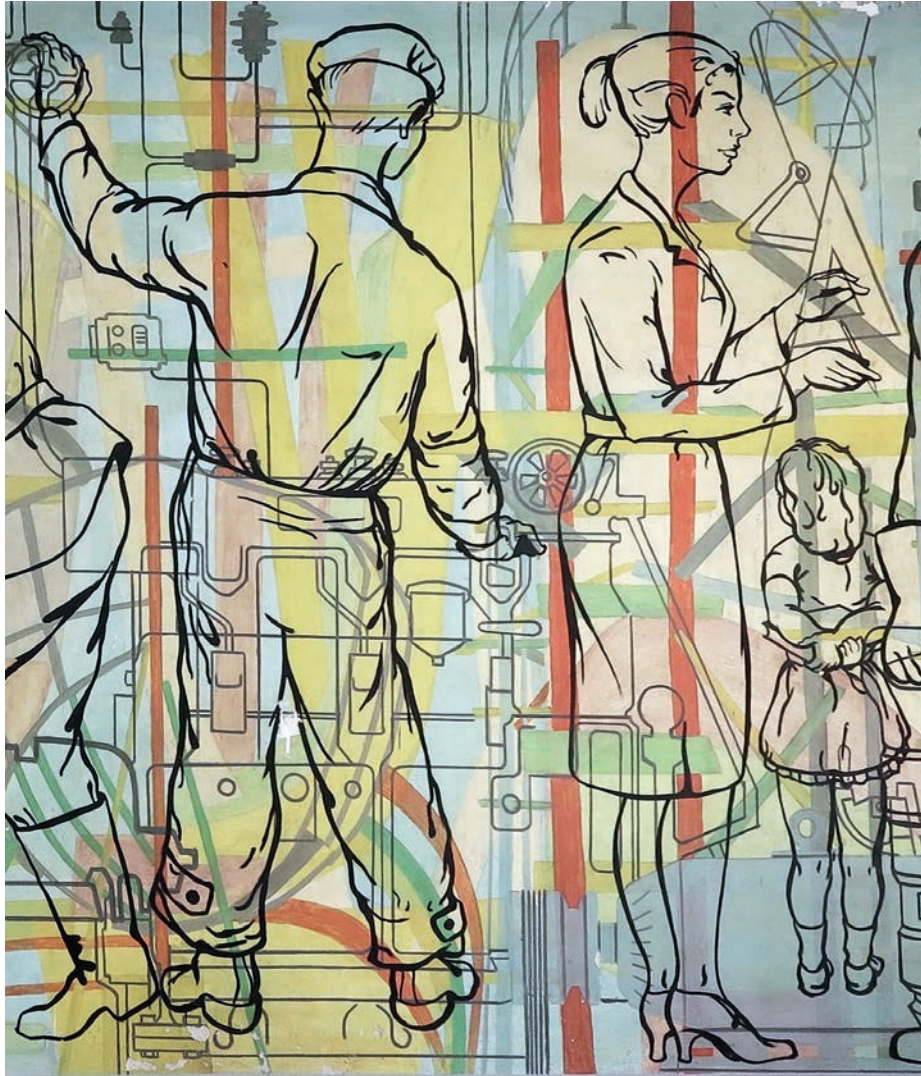
Dio zidne slike Uroša Bosnića u Grebenu. Foto: Maro Grbić