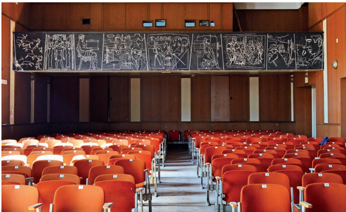
Kino sala Zadrūžnog doma s pogledom na balkon s grafitima. (2019.)