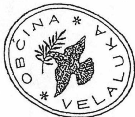
Od maslinove grančice s 18 listova (koji simboliziraju pripadajuće otoke Vele Luke kroz 19. st.), „operušana golubica“ od 1900. nosi grančicu sa samo 5 listova – otoka.

Godine 1828. započinju pripreme za buduću izmjeru „katastra“ na ovim prostorima te iz Dubrovnika dolazi okružni katastarski inženjer Vitichelli koji ucrtava naselja na otoku Korčuli te izrađuje službenu kartu s jasno naznačenim naseljem Vela Luka. Međutim, kao i nekoliko puta kasnije tijekom povijesti, službeno Blato ih je uspijelo izigrati te se u postupku izrade katastra ne ucrtava zakonom određena granica između dva naselja Blata i Vele Luke.