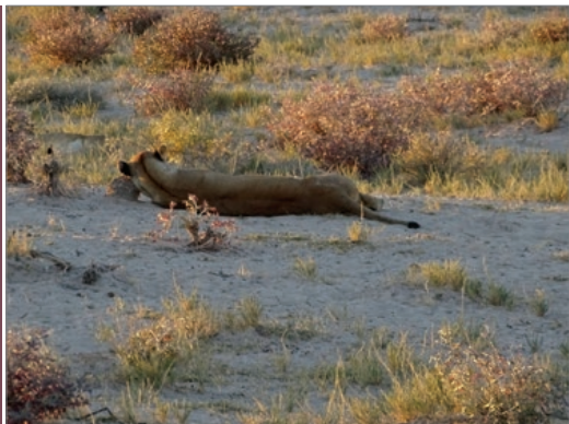
Sl. 6. Odmor poslije obroka – NP Etosha

U kampu je bilo puno njemačkih turista – ipak postoji povijesna veza između Njemačke i Namibije. Autobus s prikolicom za spavanje bio je parkiran kraj velikog termitnjaka koji je fascinirao brojne posjetitelje – premda izgleda mekan poput krličnjaka, tvrd je kao kamen te ga se ne može oštetiti ni rukom, ni nogom, a podzemni dio višestruko je veći! Uvečer se posjetitelji skupljaju na pojilištu čekajući životinje. Vidjeli smo skupinu slonova, gnuva, ali i jednu pticu koja je stala kraj žarulje i ondje čekala kukce te ih vrlo spretno hvatala u letu.