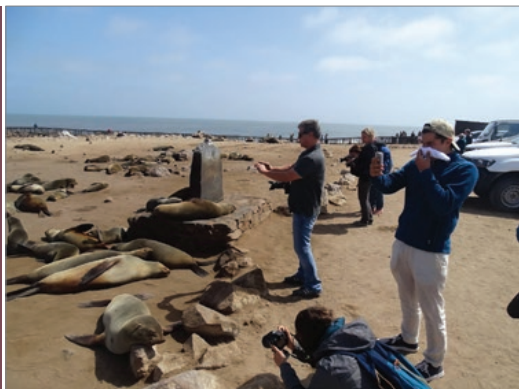
Sl. 4. Kolonija morskih lavova na Rtu križa u Namibiji