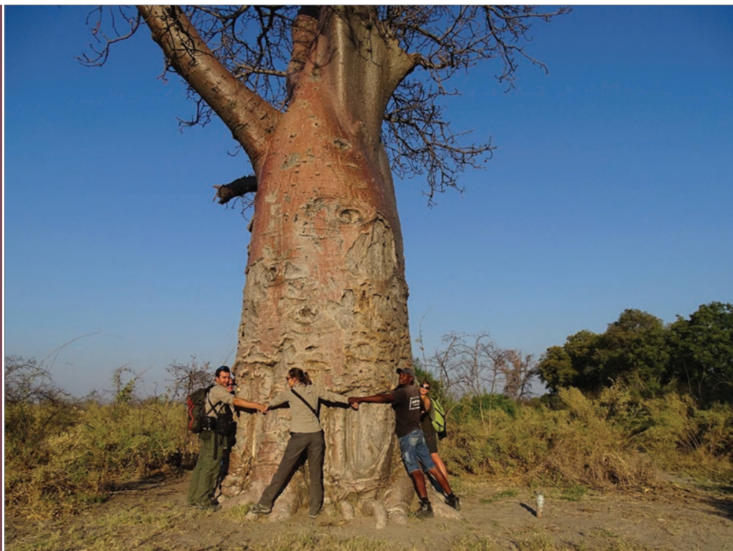
Sl. 12. Baobab u području delte Okavanga