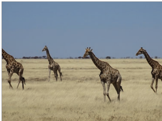
Sl. 8. Žirafe u NP Etosha

Slijedećeg jutra krećemo dalje. Zaustavljamo se u jednom gradiću radi opskrbe. Supermarket je djelomično, dok je WC u potpunom mraku, osvjetljen samo jednom svijećom! Na parkiralištu pred supermarketom na rubniku sjedi petnaestak ljudi. Na cesti se često nađe stoka: krave ili magarci, a ima i puno pješaka. Prolazimo kraj naselja s kućama od pruća. Mi smo se u šatorima smrzavali, jer je noću bilo desetak stupnjeva... U redu za bankomat u obližnjem gradiću pitam djevojku kako ona i njezini susjedi trpe hladnoću, a ona kaže da im to nije problem te da je takva tamošnja tradicionalna arhitektura.