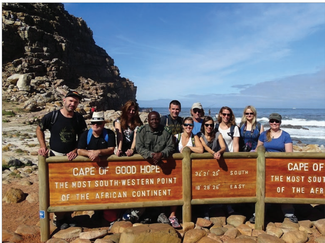
Sl. 1. Početak ture na „kraju svijeta“ – sudionici avanture

Putopis će biti osoban – s konkretnim imenima i licima, njihovim pričama, kao i njihovom doživljavanju ovog putovanja. Autor se nada da neće iznijeti nijednu stručnu geografsku, povijesnu, zoološku ili bilo koju drugu grešku. Naglasak je na osobnom doživljaju!