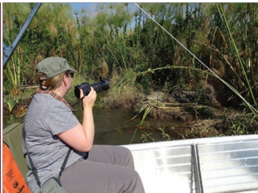
Sl. 10. Bliski susret u delti Okavanga

Spavamo u kampu „Caprivi“, gdje je većina građevina od pruća i blizu smo pojilištu, jezeru. Ondje nije bilo gotovo nikakvih životinja pa od njega nismo imali nikakve koristi osim što je noću bilo vrlo hladno spavati u šatoru – temperatura je bila 10 °C, a osjet hladnoće pojačavala je vlaga.