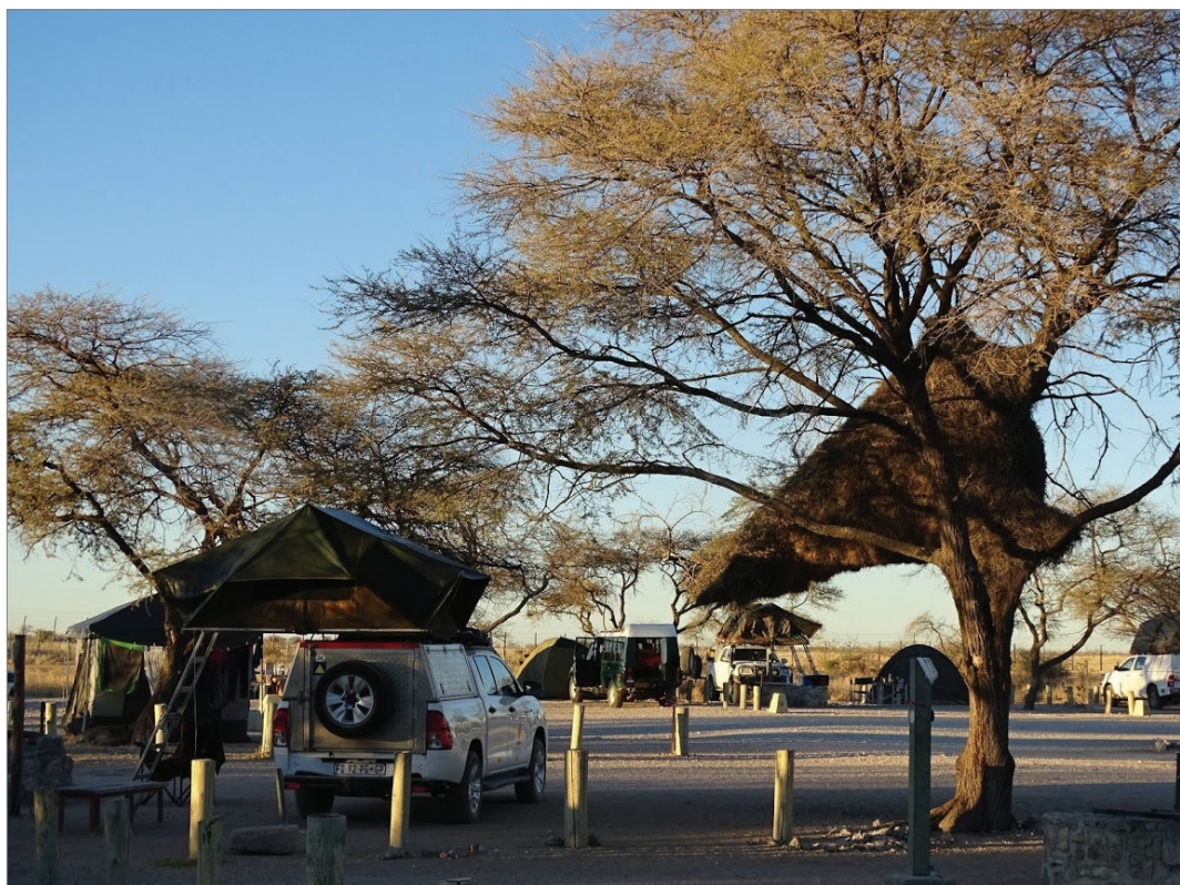
Sl. 5. Sličnost nastambi u NP Etosha

i uskoro primjećujemo skupinu od desetak lavova na obroku. Neki su već jeli, a neki upravo jedu. Zaustavljamo se i imamo dosta vremena s dvadesetak metara promatrati dalekozorom taj prizor i fotografirati. Bilo je teško vidjeti što jedu. No, jednom se prilikom pokazao metarski ravni rog - „To je oriks!“ viknem ja. Vodič objašnjava da većinom love lavice, ali mužjak prvi jede sve dok se ne zasiti. Onda jedu ostali. U skupini koja se najela, vidimo mužjaka i nekoliko ženki oko njega, skupinu koju zovu „pride“. Jedna se ženka upravo karikirano izležavala zato što se prejela: svakih je desetak sekundi mijenjala pozu, jednom čak i koristeći kamen kao jastuk.