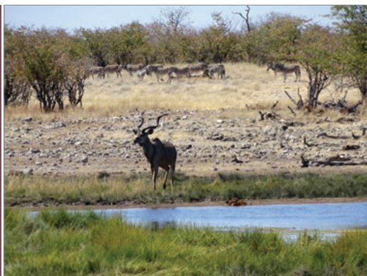
Sl. 7. Kudu u NP Etosha