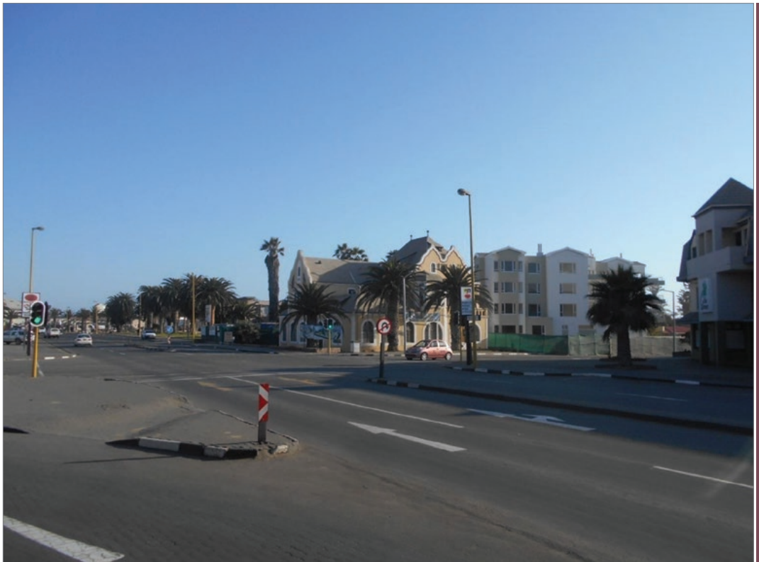
Sl. 3. Široke ulice gradića Swakopmunda u Namibiji

Nakon blagodatni civilizacije u Swakopmundu krećemo dalje – u dine pustinje Namib. To je mjesto vrlo posjećeno. Iako je hladni dio godine i temperatura je oko 20°C, pije-