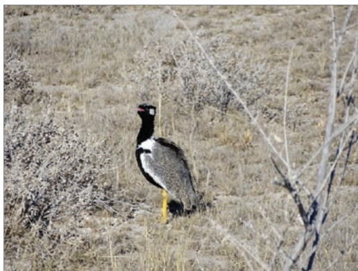
Sl. 9. Ptica engleskog naziva Northern black korhaan ( Afrotis fraoides ) u NP Etosha