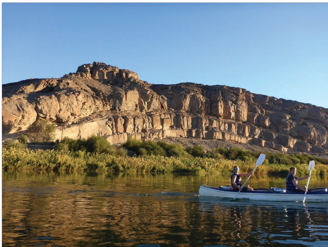
Sl. 2. Kajak na rijeci Oranje

Kakvo je noćno nebo u pustinji - ne treba ni reći! Nijednog oblaka, nimalo smoga, nimalo svjetla! Nebo je nad južnom polutkom drugačije je od onoga na sjevernoj. Tu je tzv. Južni križ i druge zvijezde. Ali nešto ipak može pokvariti pogled na tisuće zvijezda - Mjesec! Imali smo oko sat vremena svake večeri od pada mraka do pojave vrlo sjajnog Mjeseca od kojega se više nije vidjela većina zvijezda. Dorota, liječnica iz Krakova, laserom je pokazivala zvijezde i zvijezda.