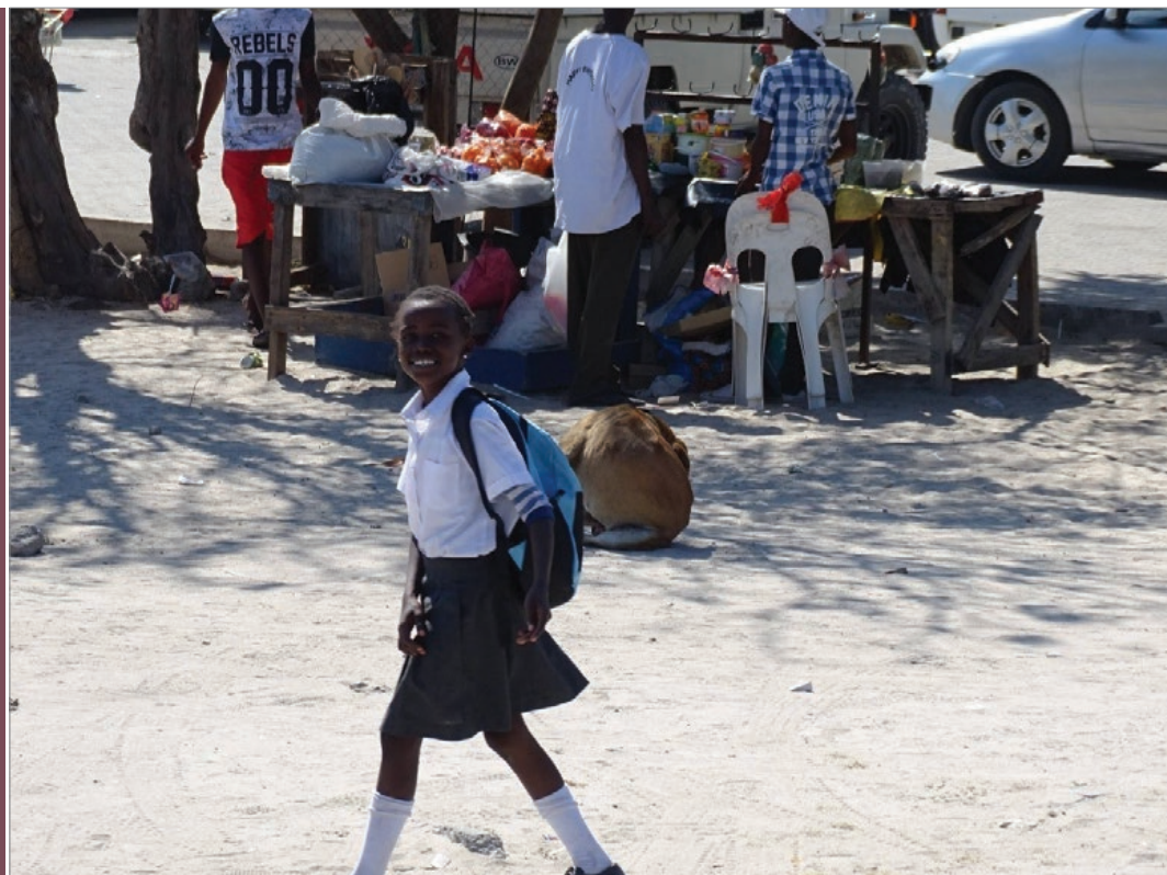
Sl. 13. Školski život u gradiću Maun u Bocvani

predsjednik još iz vremena Josipa Broza Tita ipak smijenjen. U zračnoj luci njegove su goleme slike na zidu. Naplaćuje se i nekakva dodatna taksa koja nigdje nije najavljena. Zrakoplovi kasne, a i nestabilni su tijekom leta. Ipak, nenajavljeno preko Bulawayu, slijedećemo u Johannesburg i tako završava ovo afričko putovanje.