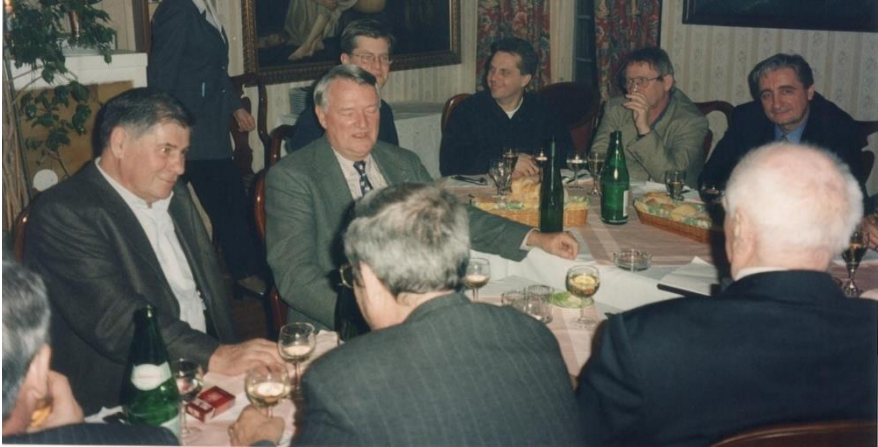
Prvi sastanak uredništva, Dubrovnik 26. i 27. veljače 1999.