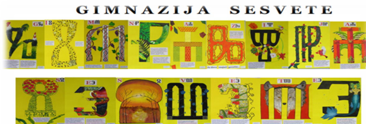
Izložba GLAGOLJICA – PISMO, ZNAK, SLIKA Radovi učenika likovne grupe Gimnazije Sesvete