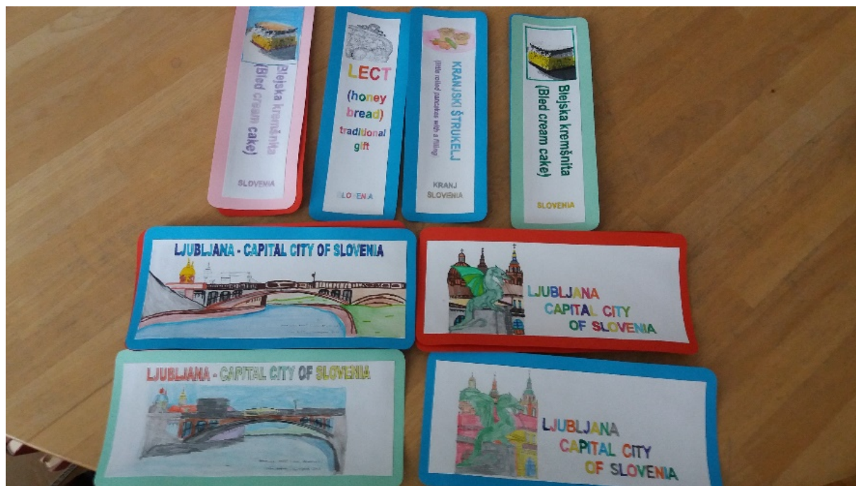
Označivači za međunarodnu razmjenu Kazalke za mednarodno izmenjavo

ljani. Interesne dejavnosti so dodana vrednost aktivnostim v knjižnici, saj jo obiskujejo učenci, ki so radi del knjižnice in s svojim delom bogatijo njeno podobo in vsebino. Pomagajo pri ureditvi knjižnice, pripravljajo natečaje in skrbijo za njeno splošno podobo v šoli in izven nje. Že tretje leto sodelujejo tudi pri slovenski in mednarodni izmenjavi knjižnih kazalk.