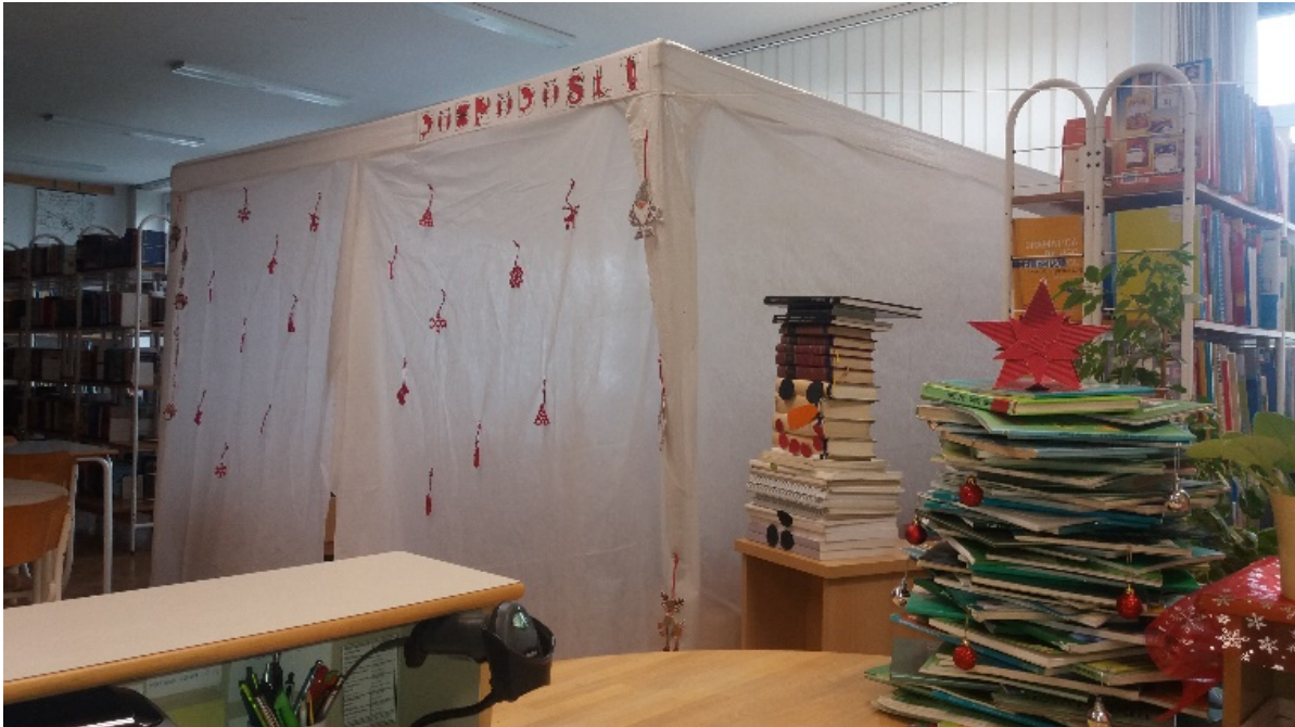
Kućica iz bajke u školskoj knjižnici / Pravljična hišica v šolski knjižnici