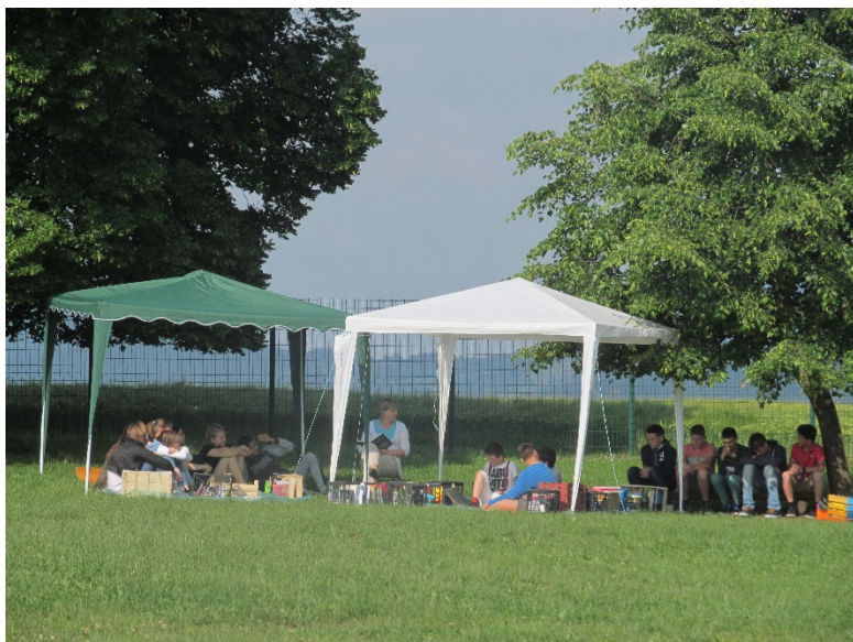
Čitanje pod školskom lipom