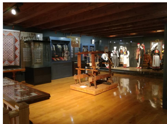
Zavičajni muzej Konavala