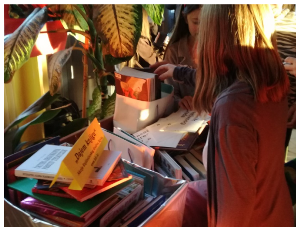
“Dajem knjigu”, akcija KDR-a za zajedničko čitanje