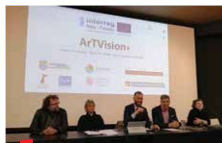
Prvi sastanak partnera na ArTVision+ projektu u Bariju u travnju 2018.

Ovaj hvalevrijedni projekt predstavlja svojevrsni nastavak Županijske kulturne mreže Primorsko-goranske županije ( kultura.pgz.hr ), i to na prekograničnoj razini, s tendencijom daljnjeg širenja, a sve u svrhu bolje ponude, suradnje i promocije kulturnih sadržaja. ■