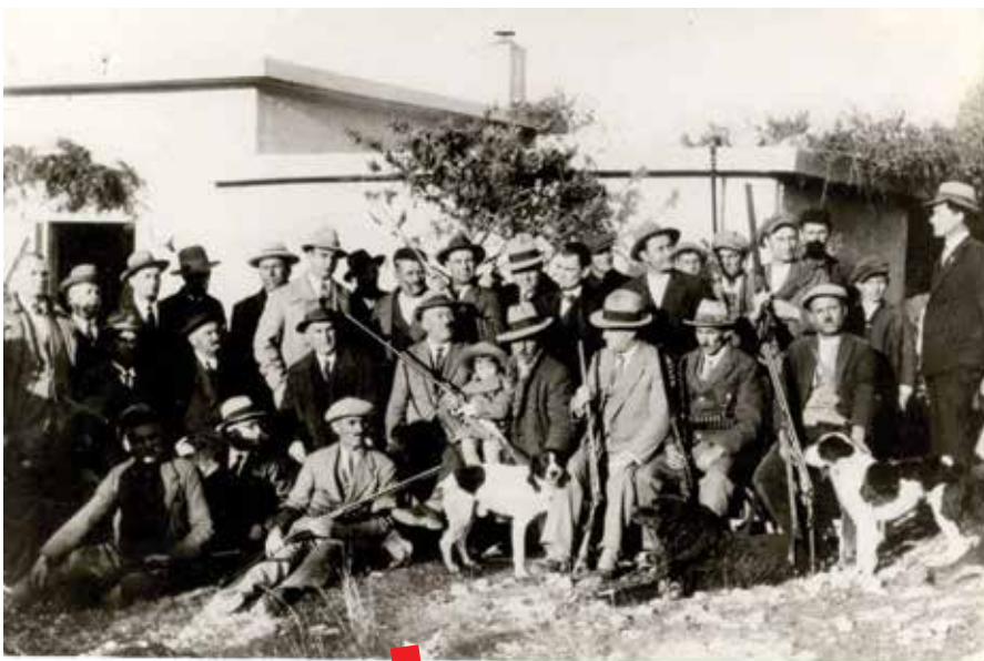
Metkovski lovci ispred Lovačke kućice na Predolcu, 1932.

Topoteka Dolina Neretve pokazala se uspješnom u ispunjavanju svog osnovnog cilja – prezentaciji gradiva privatnih imatelja. Naime, s obzirom da digitalizacijom gradivo ostaje u njihovom posjedu, vrlo rado su se odazivali i donosili materijale te na taj način