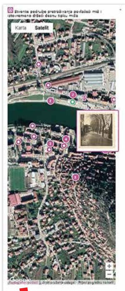
Topoteka Dolina Neretve