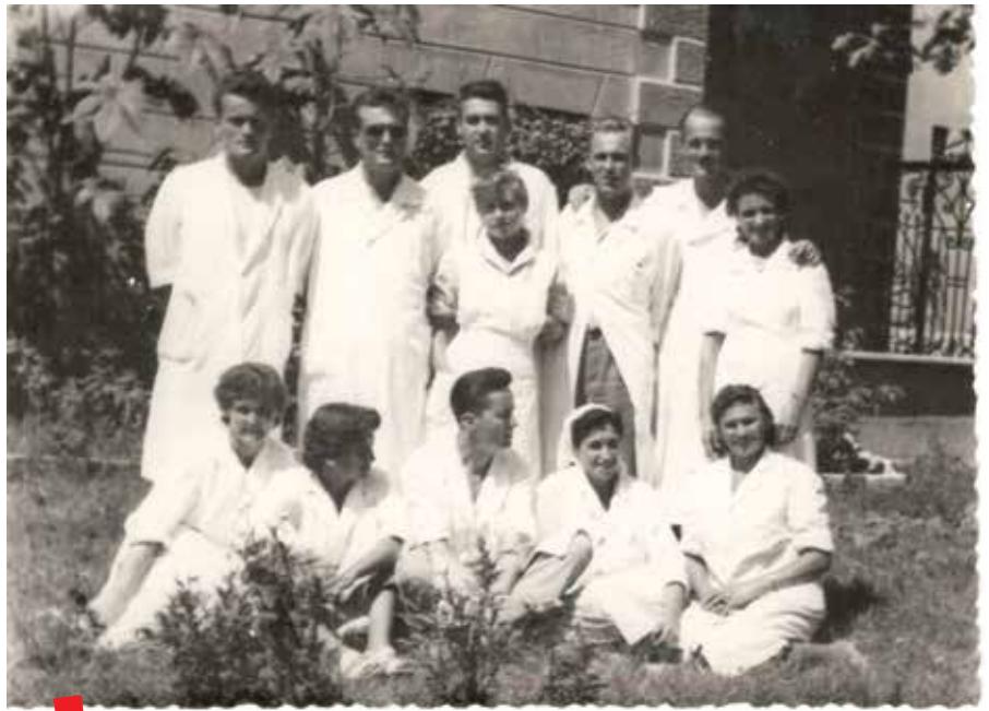
Djelatnici Doma zdravlja Metković, sredina 1950-ih

Državnom arhivu u Dubrovniku je, nakon iskazanog interesa, logističku podršku uvođenju platforme pružio Hrvatski državni arhiv, kao član ICARUS-a i sudionik co:op projekta, organiziravši u Metkoviću javnu prezentaciju digitalne platforme Topoteka zainteresiranim ustanovama, udrugama i građanima. Tom je prigodom Ladislav Dobrica, viši arhivist u Hrvatskom državnom arhivu, zajedno s kolegama Tihomirom Plešom i Renatom Horvat, upoznao sudionike s radom same platforme, ali i različitim mogućnostima, koje ona pruža za poboljšanje suradnje baštinskih i drugih ustanova i građana na prikupljanju i očuvanju građe važne za lokalnu povijest.