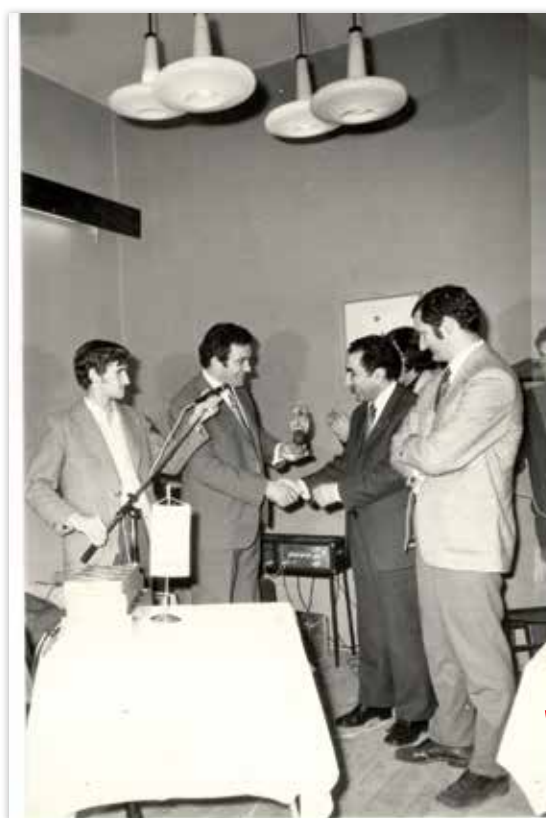
Šahovski turnir 1972. u Metkoviću