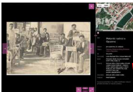
Topoteka Dolina Neretve