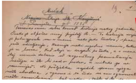
Silvije Strahimir Kranjčević, Mućak, autograf, 1895.

Prikupljanje gradiva u Odsjeku u novije se vrijeme većinom temelji na malim donacijama privatnih osoba, a nedostatak velikih akvizicija zamjenjuje kontinuirana briga o očuvanju postojećega gradiva. Osim nedavno pokrenute revitalizacije tehničkih uvjeta u samom spremištu arhiva, uspostavljanjem mikroklimi i zamjenom neadekvatnih arhivskih kutija, očuvanje se ostvaruje i kontinuiranom digitalizacijom. Uz pomoć vanjskih suradnika ili samostalno, do