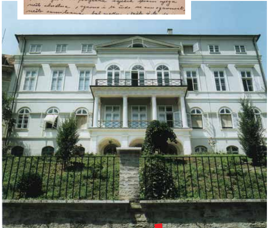
Zgrada Zavoda, pogled iz Radićeve ulice

sada su u cijelosti digitalizirane književne ostavštine Silvija Strahimira Kranjčevića i Antuna Gustava Matoša, dok je za onu Tina Ujevića napravljen izbor, a u proceduri je i digitalizacija rukopisa Ivana Gorana Kovačića. Takvi projekti osnova su za dugoročno očuvanje i poboljšanje dostupnosti gradiva, koje je realizirana putem Akademijina portala DiZbi (Digitalna zbirka Hrvatske akademije znanosti i umjetnosti). Skenirano gradivo uključeno u portal dodatno je opisano metapodacima, koji olakšavaju pretraživanje i dostupno je javnosti za pregled i preuzimanje.