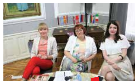
Radno predsjedništvo prvog dana konferencije

podataka) na društvenim mrežama su svakako zanimljiv i značajan izazov, pri čemu treba posvetiti pozornost zaštiti „mnogo i lako dostupnoga“ arhivskoga gradiva od zloupotreba, neovlaštenog korištenja ili stavljanja u promet na slobodnom tržištu. S tim u vezi je istaknut značaj specijalizirane knjižnice u arhivu, čiji fond treba obnavljati u funkciji obavljanja osnovnih zadaća arhiva.