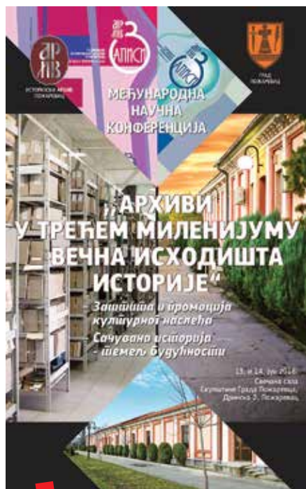
Poster međunarodne konferencije u Požarevcu

U organizaciji Istorijskog arhiva Požarevac, pod pokroviteljstvom Grada Požarevca, 13. i 14. lipnja 2018. u svečanoj sali Skupštine Grada Požarevca održana je međunarodna znanstvena konferencija „Arhivi u trećem mileniju – vječna ishodišta povijesti“, koja je okupila veliki broj stručnjaka i predstavnika arhiva iz Srbije i inozemstva. Osim razmijene iskustava, za 35 sudionika konferencije iz Srbije, Slovenije, Makedonije, Bosne i Hercegovine, Hrvatske, Ruske Federacije i Crne Gore je ovo ujedno bila i prilika za upoznavanje s novostima u arhivistici i historiografiji.