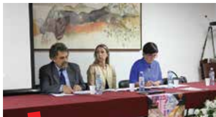
Radno predsjedništvo drugog dana konferencije

Ovim i ovakvim zaključcima su na najbolji način objedinjena oba konferencijska dana i poslana konkretna i jasna poruka o značaju i ulozi arhivskoga gradiva za znanost, povijest, kulturu i državu.