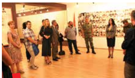
Sudionici konferencije u obilasku spomen-izložbe „Dva veka Vojske u Braničevu“

Prateći program konferencije uključivao je obilazak i razgledanje Načelstva i spomenika Knjazu Milošu Obrenoviću iz 1898. godine, posjet izložbi „Požarevački mir 1718 – replike medalja, gravira, slika i karti“ u Galeriji savremene umetnosti i spomen-izložbi „Dva veka Vojske u Braničevu“ u vojarni „General Pavle Jurišić Šturm“ u Požarevcu, zajednička druženja i upoznavanje grada.