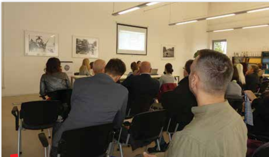
Simpozij R3 projekta u Švedskoj - http://www.arhiv.hr/Portals/0/Symposium_Refugees%2C%20documentation%20and%20archives.pdf

Dokumentacija, kako ju istražuje R3 projekt, u dijakronijskoj perspektivi služi kao poveznica prošlih događanja, sadašnje situacije i budućih potreba pojedinca i zajednice, pri čemu je u tome i uloga arhiva i pismohrana nezamjenjiva. Pomoću zapisa ustanovit će se nečiji identitet, dob, obiteljske veze, a neophodni su pri povratu vlasništva ili traženja reparacija, pri ostvarivanju prava na obrazovanje. Nerijetko imaju transgeneracijsku ulogu i nositelji su kolektivnog sjećanja. Također, dokumentacija ima veliku ulogu u svim aspektima sigurnosti i sigurnosnih prijetnji te je i u tome pogledu važno uključiti znanje arhivista i upravitelja zapisima. Istraživanjem se nastoji identificirati i razumjeti uloga suvremenih komunikacijskih i informacijskih tehnologija (uloga društvenih mreža ili zapisa u mobilnim telefonima) u procesima stvaranja, korištenja, čuvanja i pristupanja potrebnim zapisima i to iz perspektive izbjeglica, humanitarnih i državnih agencija.