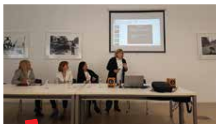
Izlaganja na Simpozija u Zagrebu

U središtu pozornosti ovog projekta su dokumenti, oni stvoreni u različitim oblicima i potrebni u svim fazama procesa izbjeglištva, a u svrhu realizacije ljudskih prava u neposredno sadašnjoj, ali i transgeneracijskoj perspektivi. Izbjegličke krize donose niz složenih i međusobno povezanih pitanja o nacionalnim državama, zakonima, granicama, ljudskim pravima, državljanstvu i identitetu, sigurnosti, raspodjeli sredstava i informacijskim i komunikacijskim tehnologijama. Dokumentacija, a posebno službeni dokumenti, predstavljaju osnovni, prožimajući i integralni dio ovih složenih pitanja, a rijetko su istaknuti kao takvi.