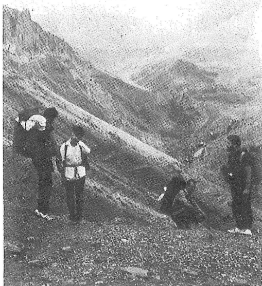
Istraživanje područja oko vrha Aladaga

Financijska sredstva za troškove ekspedicije osigurali smo jednim dijelom prije, od raznih speleoloških istraživanja, a većim dijelom vlastitim udjelom članova ekspedicije. Ukupno smo potrošili oko 200 000 dinara, što iznosi otprilike 33 000 dinara po osobi. Od toga za prehranu je potrošeno 72 000 dinara, troškove prijevoza 108 000 dinara a ostalo je utrošeno za razne druge potrebe (noćenje, vodiči, i sl.).