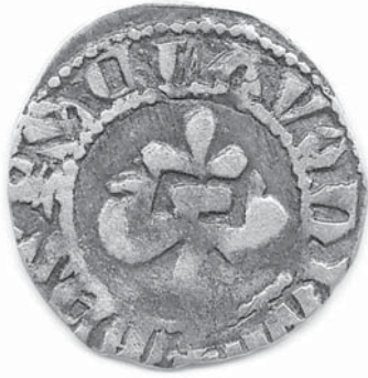
Sl. 1a Slavonski banovac, avers, nakon čišćenja