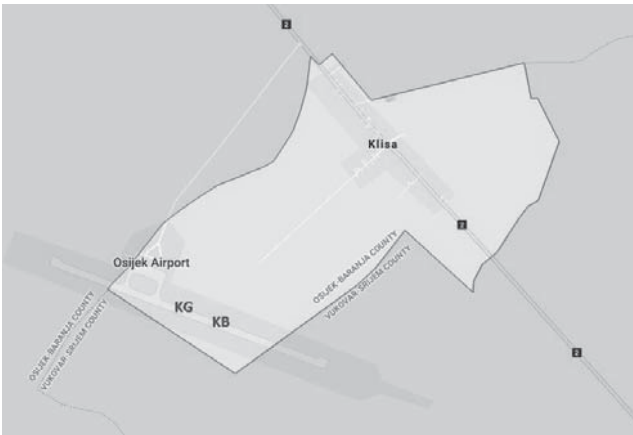
Sl. 5 Zračna luka Klisa, aviopista i položaji nalazišta Klisko brdo (KB) i Klisko groblje (KG)