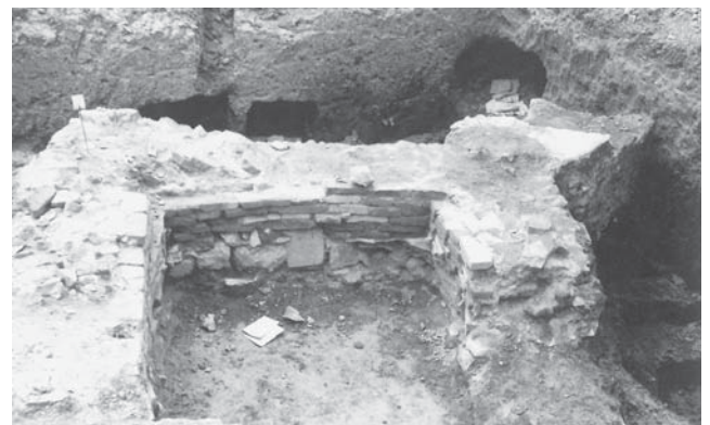
Sl. 8 Klisko groblje, srednjovjekovna nekropola s ostacima srednjovjekovne sakralne arhitekture