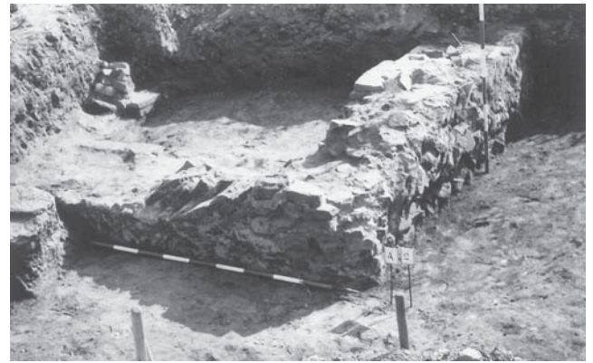
Sl. 7 Klisko groblje, arheološka iskopavanja 1978. godine