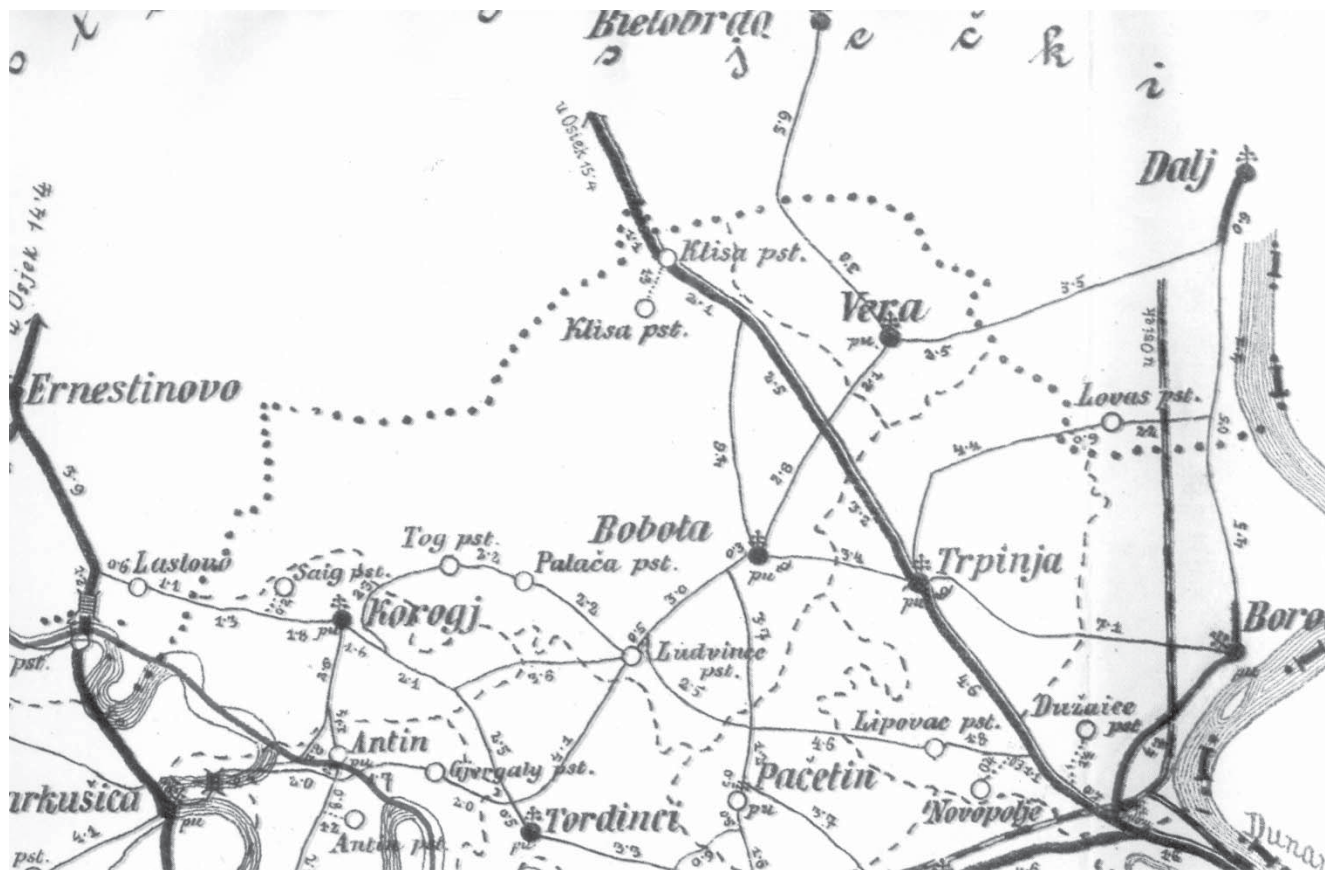
Sl. 3 Položaj Klise (kilometarska karta i skrižaljka, Kraljevina Hrvatske i Slavonije, Zagreb, 1909.)