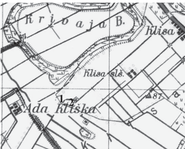
Sl. 6 Položaj zračne luke u odnosu na selo Klisa (1, 2)