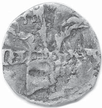
Sl. 1b Slavonski banovac, revers, nakon čišćenja