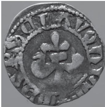
Sl. 1c Slavonski banovac, avers, prije čišćenja