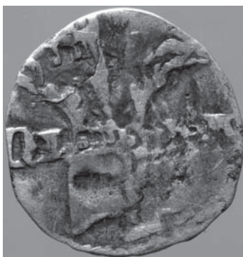
Sl. 1d Slavonski banovac, revers, prije čišćenja

Općenito heraldičke motive na banovcima možemo razvrstati: