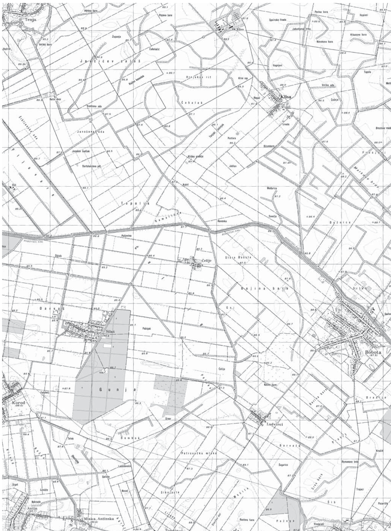
Sl. 2 Klisa, naselje u sastavu Grada Osijeka. U njezinoj blizini nalazi se Zračna luka Osijek – Klisa. Do 1991. godine Klisa je pripadala općini Vukovar.