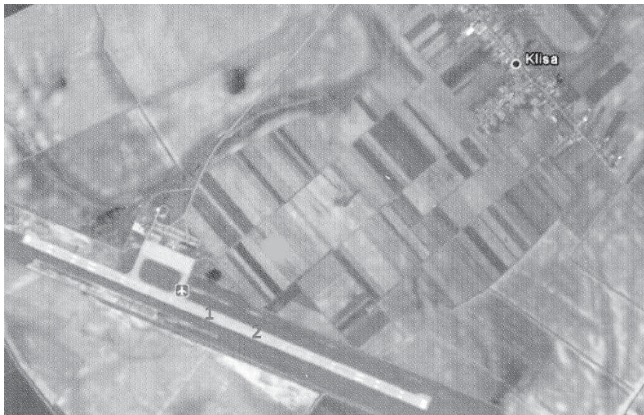
Sl. 4 Položaj zračne luke