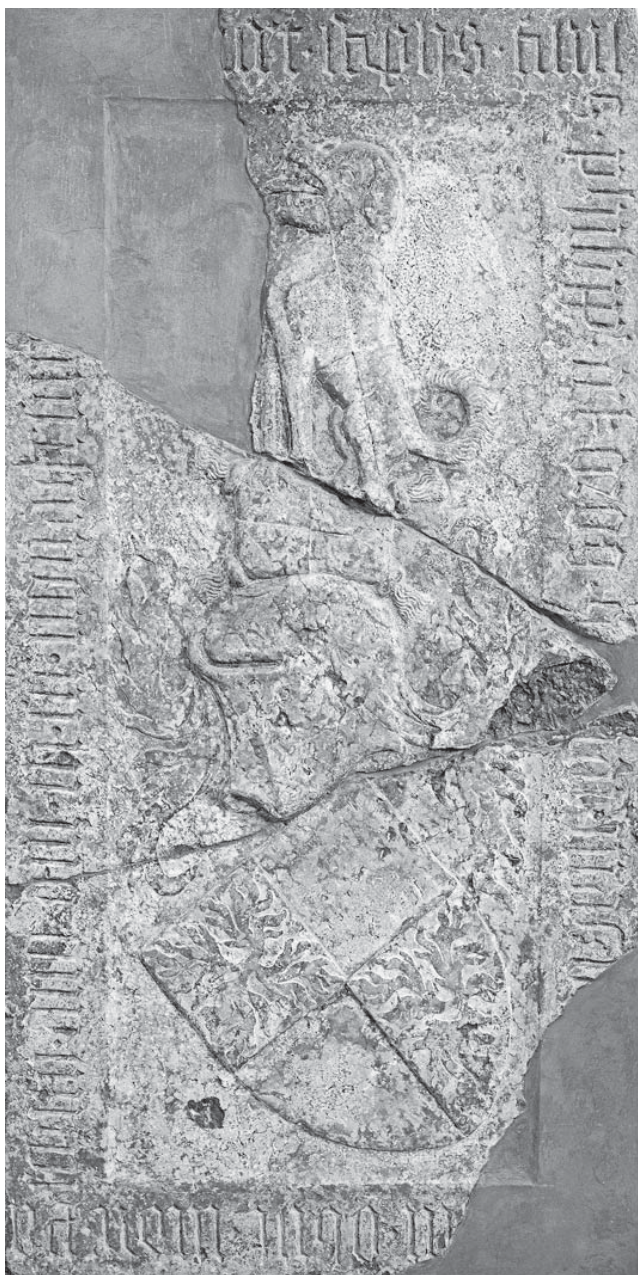
Sl. 3 Nadgrobna ploča Filipa Koroda iz 1394. u franjevačkoj crkvi Sv. Križa u osječkoj Tvrđi.

i spojena s ranije pronađenim ulomkom, prezentirana je na zidu današnje crkve Sv. Križa. Svakako predstavlja jedan od najznačajnijih spomenika kasnog srednjeg vijeka ovog tipa u Hrvatskoj 4 .