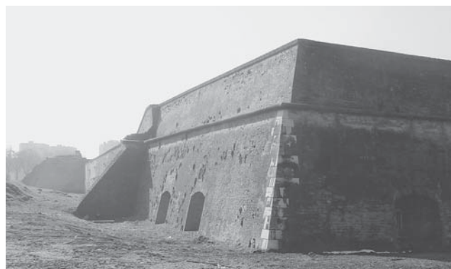
Sl. 4 Ugao Karlovog bastiona nakon vađenja spolija i ugradnje novog kamena.

nalaze profilacije i oznake. Odmah je bilo jasno da je riječ o kasnosrednjovjekovnim profilacijama arhitektonskih građevnih elemenata, pa su svi prevezeni u depo Muzeja Slavonije u Osijeku. Pregledom ostalih uglova preostalih bedema vidljivo je da je tesano kamenje nejednako i da se i u preostala dva sačuvana ugla osječke utvrde vrlo vjerojatno nalaze uzidani profilirani arhitektonski elementi neke značajne srednjovjekovne građevine. Iako izlagani, snimljeni, iscrtani i stručno obrađeni u neobjavljenom radu, dosad ipak nisu poznati stručnoj javnosti.