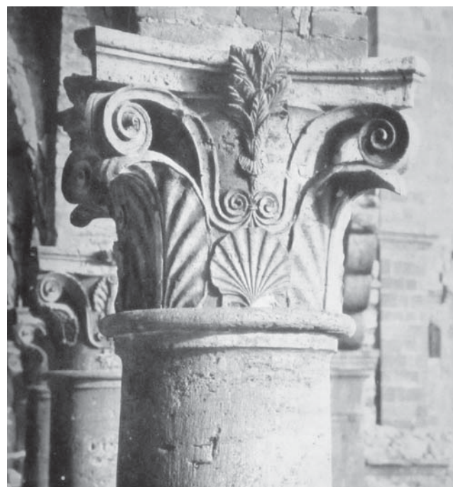
Sl. 11 Kapitel na stupu unutrašnjeg dvorišta („teatro“) palače Piccolomini u Pienzi.

I s područja današnje Hrvatske donosimo nekoliko kapitela i polu-kapitela koji imaju neke od elemenata s našeg primjerka, a datiraju također u kraj 15. i početak 16. st. To su portal crkve u Mutovranu, odnosno kapiteli dovratnika 9 i neki primjeri kapitela s dubrovačkog područja 10 . Primjer kapitela iz palače Piccolomini u Pienzi još je bliži našem primjerku i nekim svojim elementima podupire pretpostavku o naopako uzidanom polukapitelu, kao i okvirnu dataciju 11 .