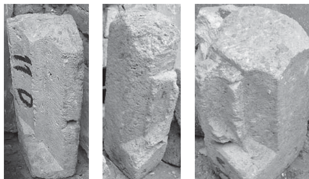
Sl. 5 Dio kamenih profiliranih kasnogotičkih doprozornika upotrijebljenih kao spolije u ojačavanju sjevero-istočnog ugla bedema osječke Tvrđe (Karlov bastion), Arheološki muzej (djelomično depozirani u Muzeju Slavonije).

Analizom kamenih blokova utvrđeno je da je riječ o kasnosrednjovjekovnim profilacijama kamenih doprozornika 5 . Vrlo slični doprozornici nedavno su pronađeni in situ prilikom konzervatorskih istraživanja baroknog dvorca Odescalchi u Iloku (tzv. češki prozori), čime je potvrđeno da je kasnosrednjovjekovni palas knezova Iločkih sačuvan i djelomično iskorišten za izgradnju kasnijeg objekta. Veličina i način obrade naših komada govore u prilog zaključku da je i u kasnosrednjovjekovnom Osijeku vrlo vjerojatno postojala reprezentativna palača, koju su najvjerojatnije izgradili već Korodi. Daljnja istraživanja u sjevernom dijelu dvorišta franjevačkog samostana i malog platoa sjeverno od samostana možda bi mogla dati odgovore