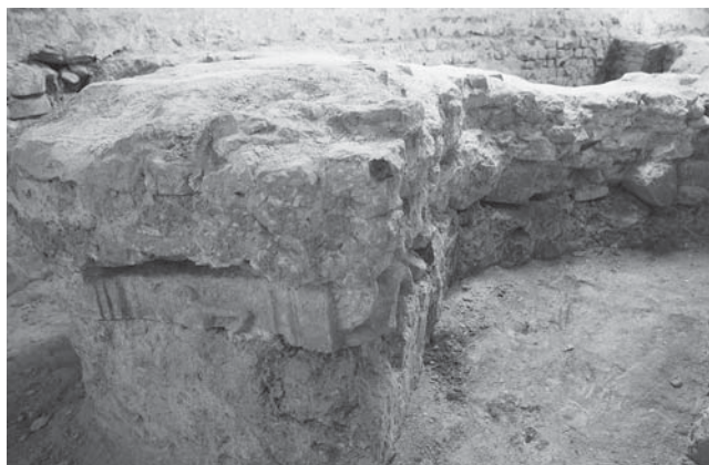
Sl. 1 Rimska ara ugrađena u srednjovjekovne/turske temelje na mjestu nekadašnje kuhinje prvog Franjevačkog samostana, pronađena tijekom arheoloških istraživanja 2003/2004. (danas u sklopu Galerije Waldinger).

No ostatci rimske arhitekture i spomenika ugrađenih u zgrade osječke Tvrđe tek su nedavno pronađeni tijekom arheoloških istraživanja starog Franjevačkog samostana (dio are, klesani kamen). Pri skidanju žbuke s fasada franjevačke crkve Sv. Križa i isusovačke (župne) crkve Sv. Mihaela pojavile su se brojne manje spolije od tesanog kamena, često i mramora, ali bez ukrasnih elemenata ili arhitektonskih detalja koji bi govorili o prethodnoj namjeni ili vremenu nastanka.