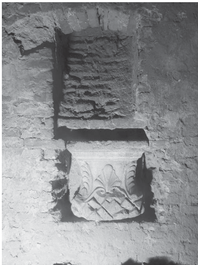
Sl. 10 Polukapitel uzidan u temelje nekadašnjeg Isusovačkog samostana u osječkoj Tvrđi.

Kameni arhitektonski element dostupan je sa svih strana izuzev stražnje, pa je bilo moguće izvršiti mjerenja i snimanje (v. 60 cm; š. 60 cm; dub. 30 cm). Vrlo dobro očuvan, s preciznim, plošno klesanim detaljima u tvrdom pješčenjaku odaje izgled neke vrste polu-kapitela sa sačuvanom stražnjom pločom. Ovaj polu-kapitel vjerojatno se nalazio na vrhu pilastra, koji je možda bio na ulazu u neki objekt ili na fasadi (zidu) kao element arkada. Iako relativno solidno klesan, ipak odaje ruku provincijalnog majstora, odnosno radionice. Središnji motiv stilizirana je školjka (jakobova kapica). Dvije vitice „spajaju“ školjku s volutama polukapitela (jedna uništena). Uglovi polu-kapitela „prekriveni“ su s pet preklopljenih polukružnih elemenata, koji prelaze u završnu volutu i čini se da predstavljaju derivirani prikaz listova akantusa. Baza (?) polu-kapitela od nepravilnih poligonalnih formi, koje asociraju na prikaz stijena, neravna je i nejasno je je li donji dio oštećen i kako je završavao jer je nedostupan pogledu 7 . Zbog položaja pojedinih elemenata može se postaviti pitanje je li ovaj arhitektonski ukrasni element ipak uzidan naopako.