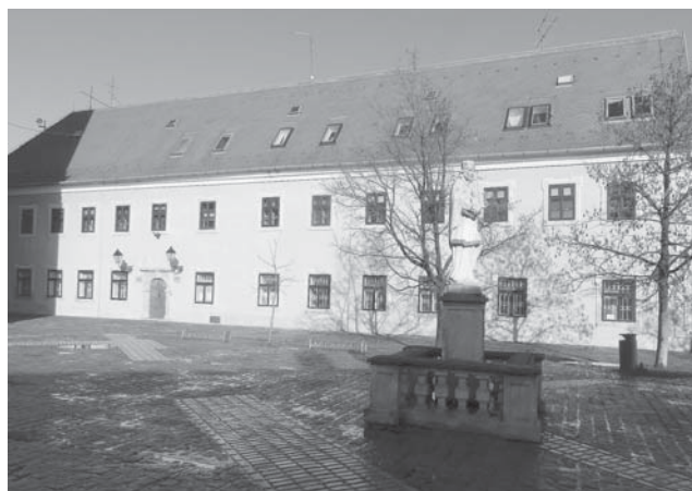
Sl. 9 Zgrada nekadašnjeg Isusovačkog samostana u Tvrđi, izgrađena 1719. godine.

Tijekom rada na izložbenom projektu „Osijek i šira okolica u osmanskome periodu“ ponovno smo, nakon dvadesetak godina u podrumu bivšeg isusovačkog samostana (danas zgrada „Narodne tehnike“ na Trgu Juraja Križanića), u njegovu istočnom temelju pregledali uzidanu ukrašenu kamenu spoliju. Nakon uvida učinilo nam se da je ipak riječ o nekom baroknom arhitektonskom elementu, odnosno polu-kapitelu. Imajući u vidu da je samostan dovršen 1719. godine, počeli smo sumnjati u ovakvu mogućnost i razmišljati da se ipak radi o arhitektonskom elementu iz ranijeg razdoblja, pa smo nedavno ponovno ušli u relativno teško dostupan prostor (zazidani dio podruma s podnim ulazom u obliku šahta u zapadnom dijelu prizemlja!). Snimanje, mjerenja i kasnije konzultacije kolega i stručne literature potvrdili su naše sumnje 6 .