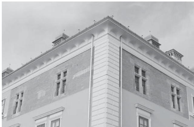
Sl. 6 Gotički prozori na iločkom dvorcu (palas Iločkih).

je li barem nešto sačuvano od temelja kaštela i je li se palas nalazio unutar kaštela ili na mjestu tzv. begovog dvora na zapadnom dijelu grada. Zamjena preostala dva kamena ugla na bedemima, koji su inače u relativno lošem stanju, vjerojatno bi dala neke dodatne odgovore o izgledu prozora i eventualno nekih drugih arhitektonskih elemenata. Naše doprozornike možemo okvirno datirati u 15. stoljeće.