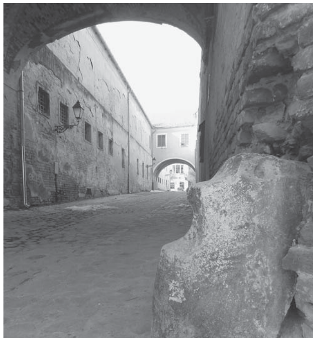
Sl. 8 Arhitektonski element nejasne namjene ugrađen kao odbojnik.

Ovdje treba upozoriti i na jedan masivni kameni arhitektonski element „ugrađen“ kao odbojnik na uglu ulice Svodova, odnosno uz zid franjevačkog samostana, čiji izgled i nekadašnja funkcija nisu jasni.