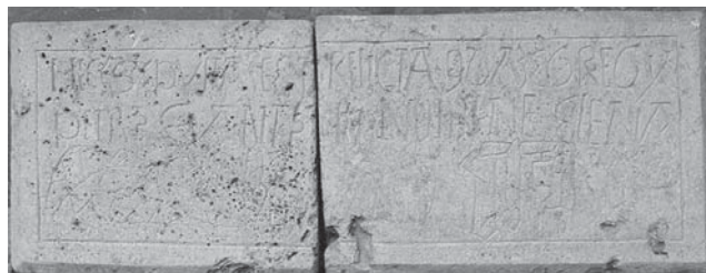
Sl. 2 Nadgrobni natpis posvećen Eleni, 15. stoljeće (stalni postav Arheološkog muzeja Osijek).

Izgradnjom osječke Tvrđe početkom 18. stoljeća kao vojnog centra uglavnom su uništeni ostatci srednjovjekovnih i turskih objekata. Povijesni izvori i rijetki istraženi ostatci pokazuju da su to uglavnom bile građevine od opeke (srednjovjekovna crkva Sv. Trojstva, ostatak turske kule-Filibejeva utvrda, turska česma). Arheološka istraživanja na Križanićevom trgu ispred crkve Sv. Mihaela pored brojnih ostataka temelja utvrdila su i poziciju Kasim-pašina turbeta, čiji su temelji, odnosno donji dijelovi izrađeni od fino tesanog kamena 2 . Na žalost, oni su zatrpani i samo označeni žutom klinker-opekom. Bilo bi svakako zanimljivo analizirati i istražiti kamene tesance kao i ostale nalaze arhitekture, koja je ostala dosta nejasno rastumačena. Arheološka istraživanja slobodnih prostora sjeverno i zapadno od samostana i župne crkve Sv. Mihaela vjerojatno bi dala nove elemente za tumačenje povijesti srednjovjekovnog Osijeka, jer se ovdje nalazio begov dvor, a vjerojatno i srednjovjekovni palas.