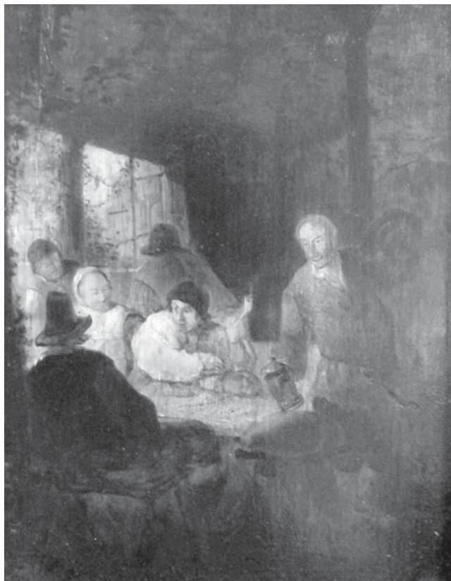
Sl. 3 Adriaen Brouwer (?). Veselo društvo , 1620-ih/30-ih; ulje na drvu: 28 x 21 cm; sign.: nema; MSO-206058

Aleksej Hanzen održao je u Osijeku izložbu u studenome 1923. godine, kada je slika najvjerojatnije i kupljena. Iako je katalog izložbe, barem deplijan, s popisom izloženih djela i cijenom, zasigurno bio tiskan, tijekom dosadašnjih istraživanja nije pronađen niti je u lokalnim glasilima objavljen popis kupaca slika. Dosadašnja istraživanja provenijencije slika iz zbirke utvrdila su da je Gradsko poglavarstvo kupovalo slike za muzejski fondus, time je moguće da je također i ovu sliku za muzej pribavio Grad. No u Muzeju likovnih umjetnosti nalazi se ulje na platnu navedenog autora pod nazivom Remorker vuče jedrenjak na uzburkanom moru te će daljnje istraživanje otkriti koja slika potječe iz Zbirke Weissmann.