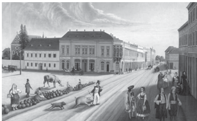
Sl. 7 Anton Erben. Trg u Gornjem gradu, 1868.; ulje na platnu; 62 x 80 cm; sign.: nema; MSO-154179

Na popisu slika preuzetih za muzej u prosincu 1941. pod rednim brojem 1 nalazi se slika koja prikazuje osječki trg u Gornjem gradu. Ona nije navedena na ranije izrađenom popisu umjetnina po sobama, no nalazi se na popisima iz 1946. i 1947. godine. Navedena slika jedina je slika dosad publicirana kao vlasništvo Hermanna Weissmanna i jedina slika za koju je provenijencija u Weissmannovoj zbirci potvrđena iz nekoliko izvora. Riječ je o ulju na platnu s prikazom glavnog osječkog trga i pripisana je osječkom slikaru Antonu Erbenu (1839. –1909.). Nalazi se u jednostavnom drvenom posrebnom okviru.