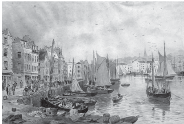
Sl. 4 neutvrđeni slikar. Veduta s marinom , druga polovica 19. stoljeća, akvarel na papiru: 24,5 x 35 cm; sign.: nema; MSO-209618

Analiza teme, prikaza likova, kolorita autorstvo slike usmjerava prema flamanskom slikaru žanr-scena Adriaenu Brouweru, često nazivanom slikarom emocija. 27 Slika je zanimljiva u okviru cjelokupne zbirke dr. Weissmanna, koju uglavnom čine djela prva tri desetljeća 20. stoljeća te nekoliko djela 19. stoljeća, i bit će zanimljivo istražiti provenijenciju te način ulaska slike u zbirku.