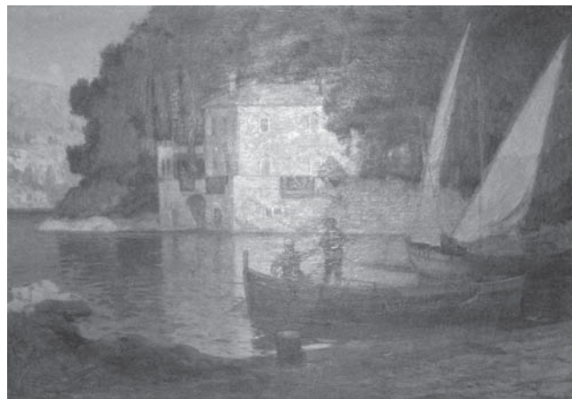
Sl. 2 Aleksej Vasiljevič Hanzen. Vila Solitudo , vj. 1922./23.; ulje na platnu: 54,5 x 78 cm; u okviru: 64 x 87 cm, MSO-206046/1-2

U prvoj sobi u prizemlju u listopadu 1941. zatečeno je sedam slika: za dvije slike ne navodi se tehnika, dva su akvarela te tri ulja; autorstvo se bilježi kod dvije slike: Henzen i Kremzir. 26 Henzen je autor slike More , akvareli prikazuju dvije luke i rad su neutvrđenog slikara. Tehnikom ulja slikana su dva djela neutvrđenih autora: jedna slika prikazuje seljake u gostionici, druga majku s dvoje djece, autor trećeg ulja, Majka i kćerka u kuhinji , neidentificirani je slikar Kremzir. U prvoj sobi prizemlja nalazila se još slika Seljak nepoznatog majstora. Iz ove sobe tri ili četiri slike identificirane su u Zbirci slika i okvira.