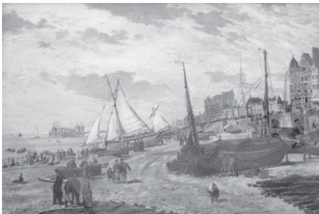
Sl. 5 neutvrđeni slikar: Veduta marine , druga polovica 19. stoljeća; akvarel na papiru: 21,5 x 32 cm; sign.: nema, MSO-209619

Osam umjetnina zabilježeno je u drugoj sobi u prizemlju stana – sedam ulja i jedan bakrorez. Bakrorez Akt rad je cijenjenog hrvatskog grafičara Tomislava Krizmana (1882.–1955.), a Akt izveden u ulju djelo je neutvrđenog autora, kao i slika Igra vila . Zatim se navodi Put za Lovranu neutvrđenog mađarskog slikara te dvije slike jednog autora – Namještena soba i Djevojka . Autori nisu navedeni ni za preostale dvije slike izložene u drugoj sobi, Priroda i Konji na pustari . U Zbirci slika i okvira nije identificirana nijedna navedena umjetnina.