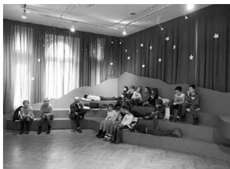
Slušaoince ZIBA - plava zvjezdica