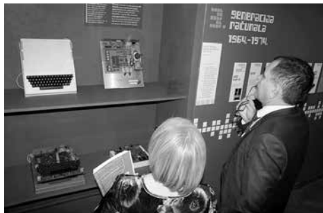
Izložba Galeb zove Orla

fotografskom i izradi razrednoga herbarija. U natječaju je sudjelovalo 69 škola iz 19 županija te više od 650 učenika koji su poslali svoje radove. Ovim se projektom istaknula važnost očuvanja tradicije svih krajeva Republike Hrvatske. Prilikom svečanoga otvorenja izložbe nagrađenim učenicima i mentorima dodijeljene su nagrade i priznanja.