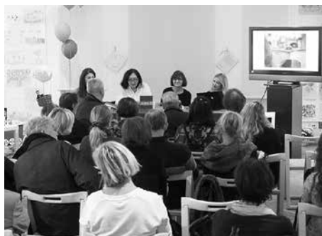
Promocija Moja zagrebačka knjiga pustolovina