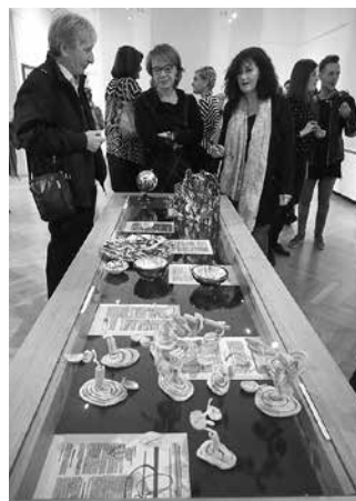
Izložba ULK 3

Hrvatski školski muzej u suradnji s Udrugom HAB–Hrvatska autohtona baština i Školskom knjigom organizirao je izložbu učenika radova Bakin vrt u mojem tanjuru , koja je nastala na temelju natječaja u četiri stvaralačka izričaja: literarnom, likovnom,