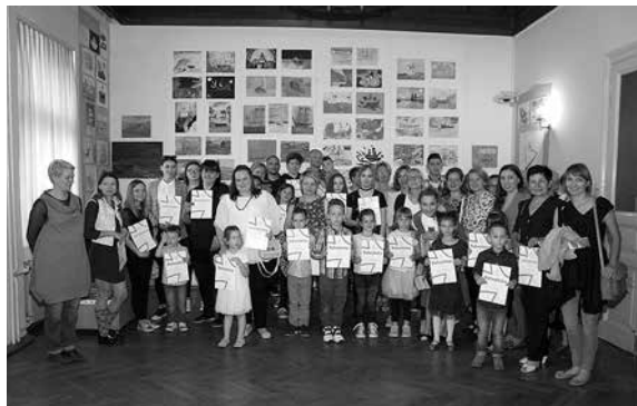
Izložba Kamo plovi ovaj brod i dodjela priznanja

i Večernjem listu iz preko 7000 analiziranih objava. Uz lijepe primjere školske prakse publici je prikazano što se u školstvu obećavalo i najavljivalo te koji su problemi školstva riješeni, a koji nas prate već godinama. Uz izložbu su održane besplatne radionice za građanstvo Postani pravi novinar! , koje je vodio Marijan Šimeg iz Školskih novina . Izložbu je financirao Grad Zagreb, Gradski ured za kulturu , osnivač i glavni financijer Hrvatskoga školskog muzeja.