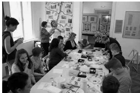
Noć muzeja radionica Kako se nekad jačalo u školama