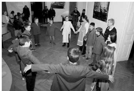
Noć muzeja radionica Kako se nekada jačalo u školama