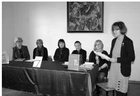
Promocija muzejskih publikacija