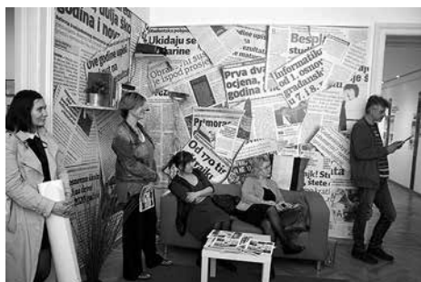
Izložba O čemu govorimo kada govorimo o obrazovanju