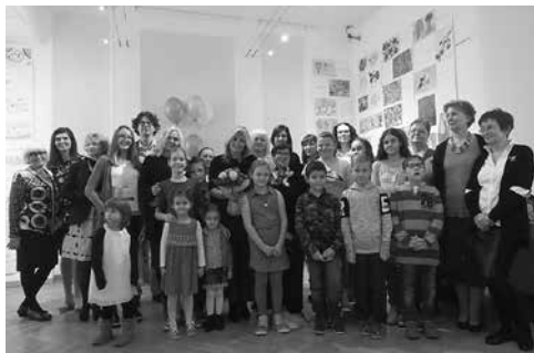
Izložba Bakin vrt u mojem tanjuru

fotografskom i izradi razrednoga herbarija. U natječaju je sudjelovalo 69 škola iz 19 županija te više od 650 učenika koji su poslali svoje radove. Ovim se projektom istaknula važnost očuvanja tradicije svih krajeva Republike Hrvatske. Prilikom svečanoga otvorenja izložbe nagrađenim učenicima i mentorima dodijeljene su nagrade i priznanja.