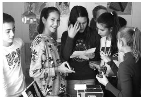
Radionice Lenta vremena velikih hrvatskih izumitelja