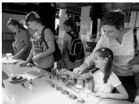
Festival znanosti radionice Hokus pokus