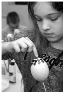
Proletnje radionice - Uskršnje pisanice