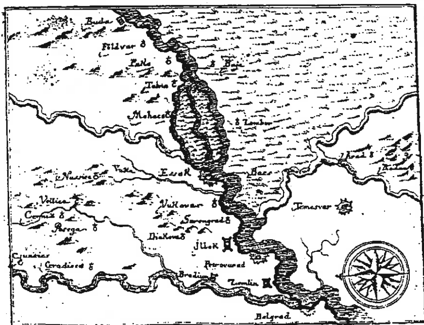
Franjevački samostani u Podunavlju, Slavoniji i Srijemu početkom 18. st.

Delineatio Locorum, in quibus sæpefata Provincia aëtu habet Cœnobia.