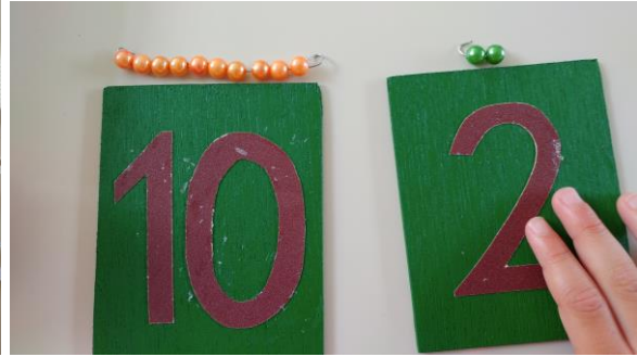
Slika 3: Montessori materijal