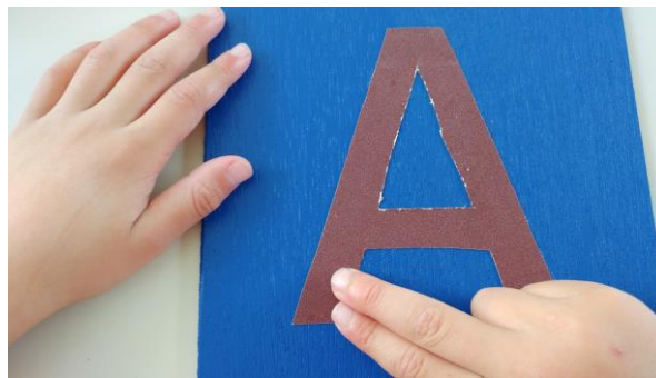
Slika 4: Montessori materijal