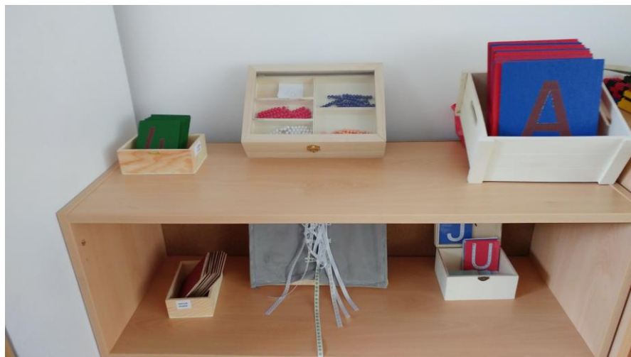
Slika 1: Uređenost okruženja podučavanja

U Montessori učionicama materijal je podijeljen po područjima. U svoj rad uključujem samo neka Montessori pomagala koja se koriste prema načelima Montessori pedagogike. Zato koristim jedan otvoren ormar s policama na kojima se nalazi pripremljen materijal koji ću koristiti u pojedinom nastavnom satu (materijal se odnosi na različita područja). Aktivnosti su unaprijed određene i provode se u određenom vrsnom redu čime se omogućava da je djeci s MAS-om unaprijed poznat tijek nastavnog sata.