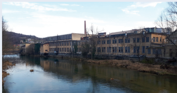
Slika 3 – Današnja panorama tvornice uz Mrežnicu (foto 7. 3. 2020.)

Gospodarski razvoj i preobrazba u suvremeni grad započinje nakon izgradnje pruge Karlovac – Rijeka 1873. godine te osnivanjem Pamučne industrije 1884. godine. Zanimljivo je da je vjerni opis tadašnje Duge Rese dao upravo znameniti hrvatski književnik August Senoa koji je putovao prvim vlakom na toj relaciji. Općinsko središte postaje 1896., a 1993. godine, nakon uspostave suvremene hrvatske države, dobiva i status grada.