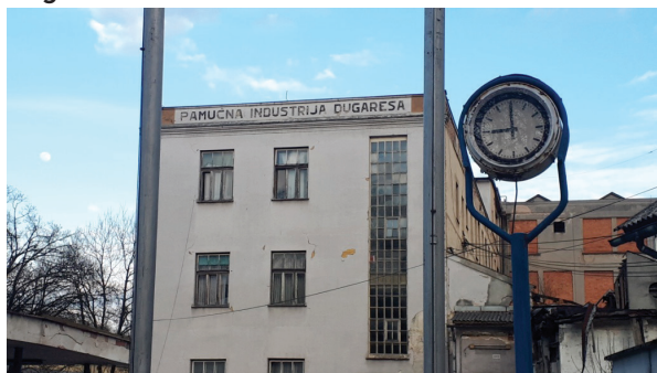
Slika 2 – Zgrada Pamučne industrije danas (foto 7. 3. 2020.)

Pamučna industrija koja je nekad bila okosnica gospodarskog, ali i kulturnog i sportskog života u Dugoj Resi, zbog problema u poslovanju i velikih gubitaka, sada već davne 2002. godine završila je u stečaju. Nakon više od 13 godina, nekako nezapaženo u javnosti, stečaj je završio krajem 2015.