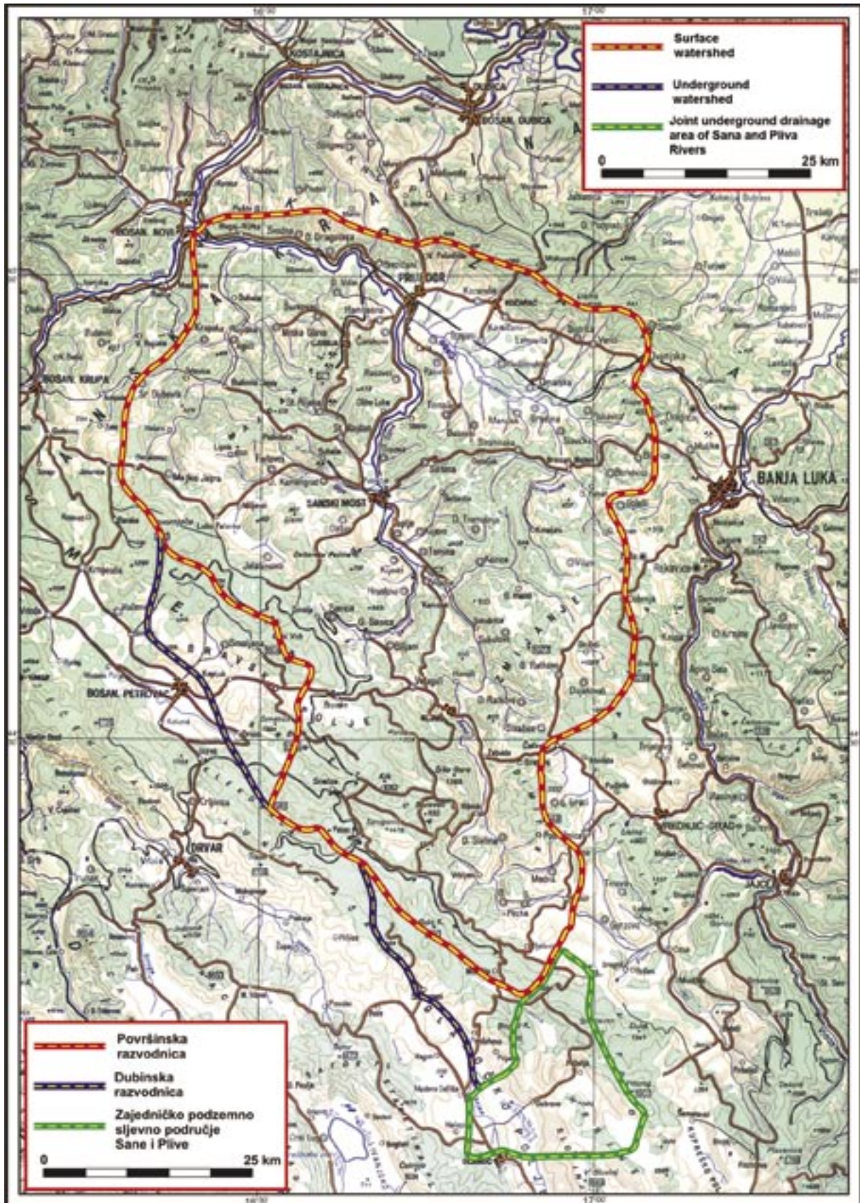
Slika 1. Porijeklo Sane Figure 1 Sana River drainage area