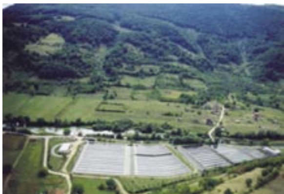
Slika 3. Ribnjak Ribnik Figure 3 Ribnik fish pound

fish stock includes 30% of brown trout and 70% of autochthonous Sana grayling. Numerous capital specimens were caught in the district: a grayling of 68 cm, and a brown trout of 71 cm. There is a plan to build a hatchery for grayling and brown trout, and every year there is a traditional fly fishing cup that attracts numerous contestants from Bosnia and Herzegovina and neighbouring countries.