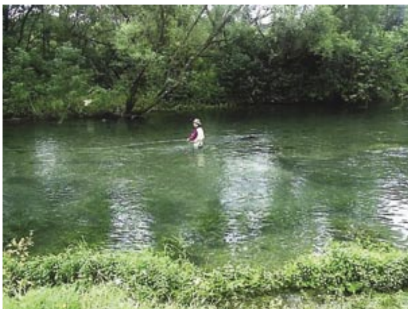
Slika 2. Revir Sanica Figure. 2 Sanica district

1. Sanica fishing district on Sanica River is 2.5 km downstream of the spring. Sanica District is one of the most famous in Bosnia and Herzegovina and beyond, and its basic feature is the presence of autochthonous species of salmonids (Sana grayling is unique for its wide back fin). In this fishing district only fly fishing is permitted, angling is prohibited, and one can keep only one caught (grayling with minimal length of 35 cm or brown trout with minimal length of 40 cm). The price of one-day permit is €20. Sanica fishing district is the destination of numerous anglers from Bosnia and Herzegovina, Croatia, Slovenia, Austria, Germany and other countries. In this district the river is up to 10 m wide and 0.2 to 1 m deep. The water temperature ranges from 8 °C to 14 °C, and the district is open from March 1 st to December 31 st . The