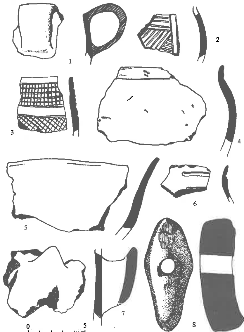
1-5: ĐAKOVAČKA SATNICA-KATINSKA; 6-7: VIŠKOVAČKI VIINOGRADI; 8: ĐURĐANCI