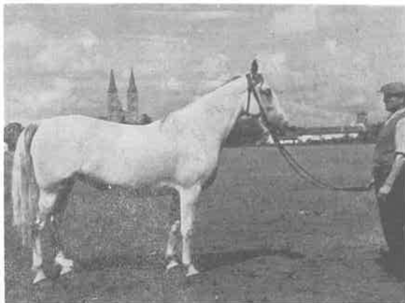
Lipicanska kobila 68 Karolina

Potražnja za dobrim jahaćim konjima bila je tada u Evropi vrlo velika, pa je Bakić nastojao što bolje unaprijediti i seljačko konjogojstvo. U tu svrhu osnovao je pripusne postaje po cijeloj tadanjoj bosanskoj biskupiji, u koje je smjestio svoje valjane arapske ždrijepce. Kako seljaci nisu htjeli niti uz batine voditi svoje kobile na opasivanje pod njegove ždrijepce, to je Bakić te ždrijepce jednostavno pustio na pašnjake među seljačke kobile, da od ranog proljeća do zime, odnosno za vrijeme paše, na slobodi, na pašnjacima žive i oplođuju seljačke kobile. Bakić je prema Kečkemetiju u selima na čijim pašnjacima su se nalazili njegovi ždrijepci uveo i prisilno štrojenje privatnih ždrijebaca. Kazna za neuštrojenog ždrijepca