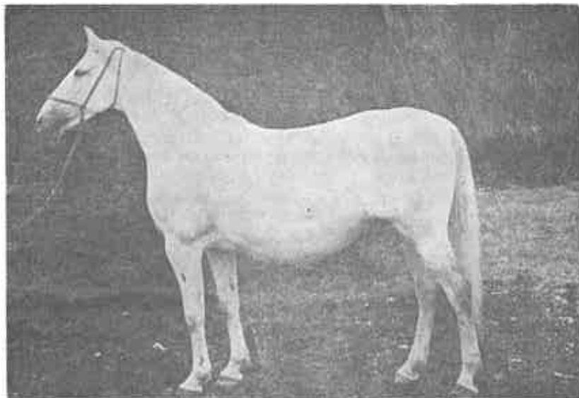
Lipicanska kobila 94 Olga II

Godine 1914. nabavljene su u Lipici kobile Area, Forienta, Sagana i Virtuosa. Od tih kobila zadržalo se u Đakovu samo potomstvo kobile Sagana koja pripada lipičkom rodu Stornella i kobile Virtuosa koja potječe od lipičkog roda Sardinia.