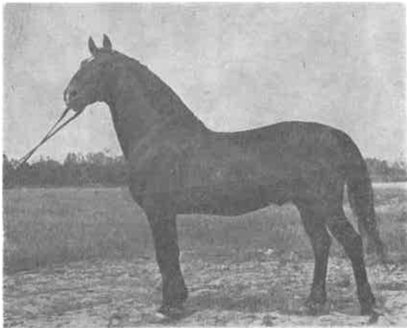
Lipicanski ždrijebac 131 Pluto Medina glavni pepinijer ergele Đakovo

sa sobom iz ergele najbolje konje pa ju je bilo neophodno potrebno brojčano i kvalitetno obnoviti. Biskup Petar Bakić, Patačićev nasljednik, nabavio je 1719. godine u Egiptu još 30 arapskih kobila i 30 ždrijebaca, a dopremio ih je u Đakovo jedan grčki trgovac koji je po Slavoniji kupovao hrastove za gradnju brodova. Za tih 60 arapskih konja Bakić je dao 30 jutara 200-godišnje hrastove šume, a hrastovi, kojih su dimenzije bile takove da su se iz đakovačkih šuma do Save morali dovoziti na 12 do 16 volova, otpremani su Savom i Dunavom u brodogradilišta na Crnom moru.