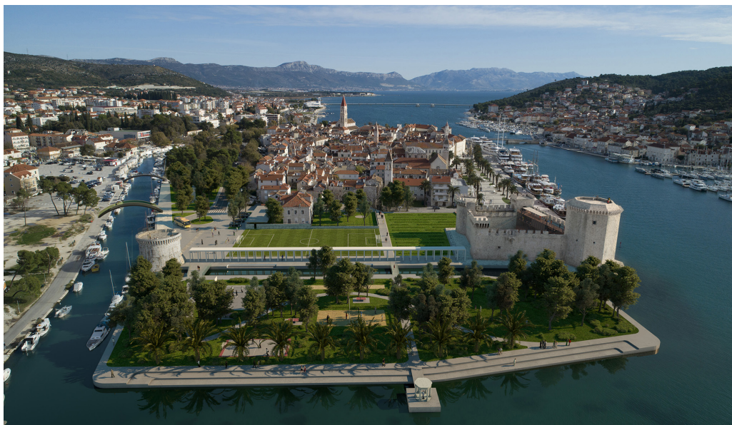
↑ Pogled na prostor Batarije (MVA)

Povodom provedbe projekta nositelja Grada Trogira i partnera Muzeja grada Trogira i Turističke zajednice grada Trogira „Trogirska kamena enciklopedija – zidine grada, čuvari baštine i zalag budućnosti“ financiranog od Europskog fonda za regionalni razvoj u okviru Operativnog programa „Konkurentnost i kohezija 2014.–2020.“