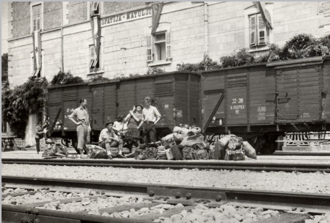
Ekipa sa svom opremom na kolodvoru u Matuljima

potomci stare keltske sekte, i da bi izbjegli istrebljenje koje im je prijetilo, tajnim su podzemnim prolazom prešli na otok Cres, a prema drugoj, dio Napoleonove vojske, vraćajući se 1813. nakon poraza iz Rusije, zaglavio je u nekoj špilji u Učki, htijući iz Kastavštine doći u Limski kanal u Istri, gdje ih je trebala dočekati njihova mornarica. Novinari su