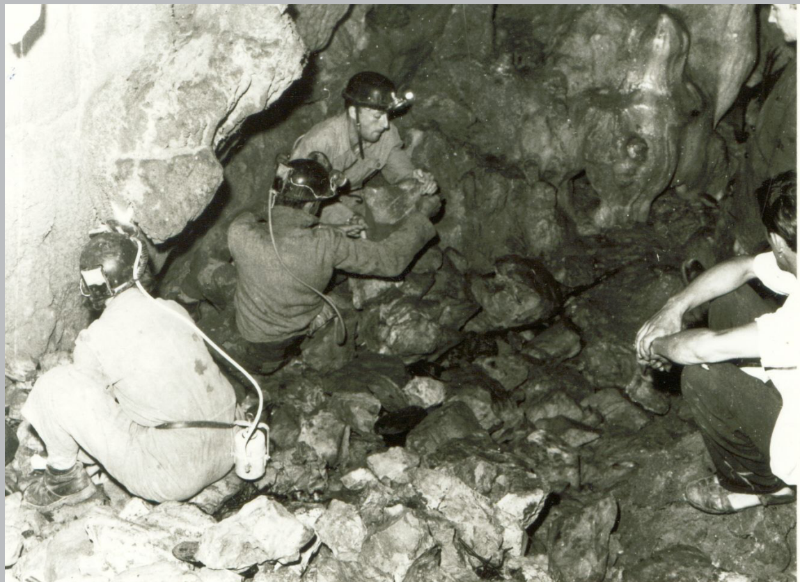
Otkopavanje prolaza, licem okrenut Duško Muzikant