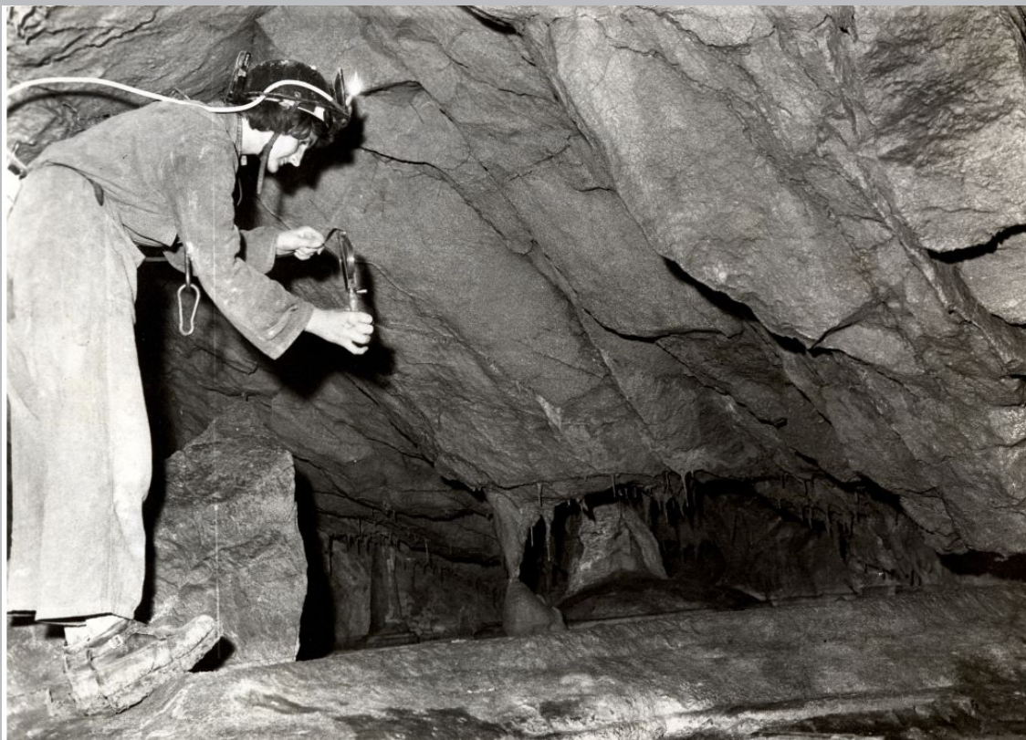
Vesna Šegrc (Božić) mjeri špiljski kanal