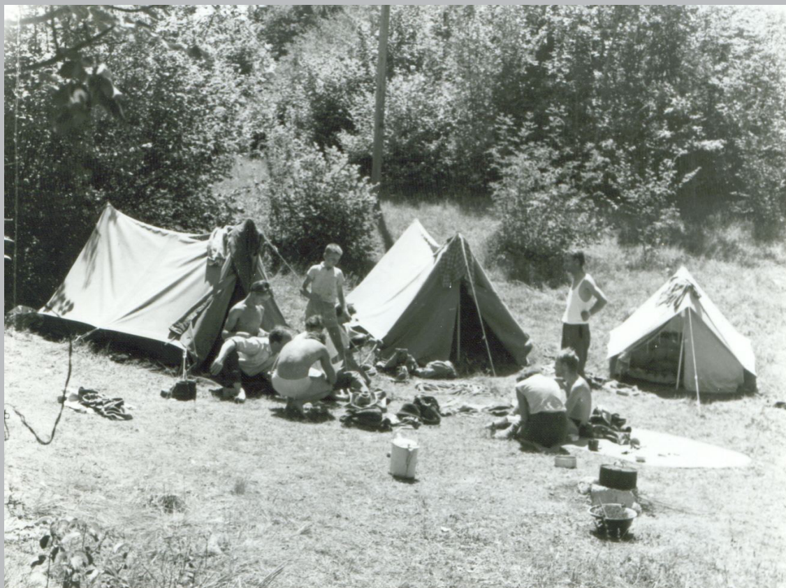
Logor kraj Zadružnog doma u Permanima