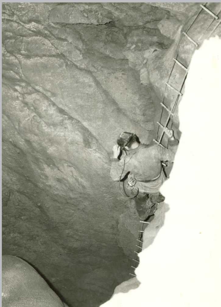
Vlado Božić se spušta u Prvi ponor

"nemoguće" izbrisana iz speleološkog rječnika. Zato smo na povratku skrenuli i u hodnik-odvojak, koji nas je doveo do novog svijeta siga i novih podzemnih galerija. Oko deset sati u noći našli smo se kraj bijelog jezera, što podsjeća na reljef nekog nepoznatog planeta. U njemu nije bilo vode. Ostao je samo talog bijelog vapnenca, finog bijelog praha, što se vjekovima taložio i naposljetku skorio, ali koji ipak nismo dotakli prstima. Čovjeka u takvim trenucima obuzima osjećanje strahopoštovanja prema djelima prirode, koje ne treba skrnaviti nepotrebnim i obijesnim