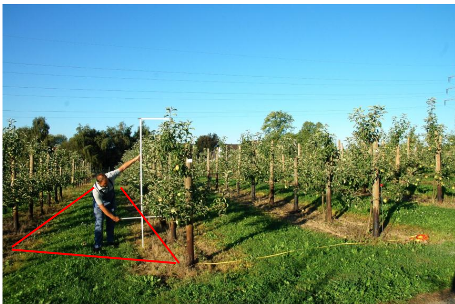
Slika 2. LWA (lisna površina, plave linije) i površina zemlje (kg/ha, crveno polje)

Zbog različito tretirane površine koja se u vertikalnom uzgoju mijenja od početka pa do kraja vegetacije i postaje sve veća, predložena je LWA površina za kulture u vertikalnom uzgoju (tablica 1.). Treba je prilagoditi i provjeriti s različitim uzgojnim metodama u zemljama sjeverne i južne Europe.