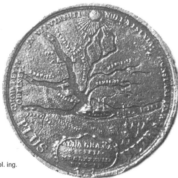
Sl. 11., Kat. br. 18.