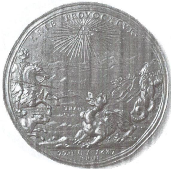
Sl. 5., Kat. br. 9.