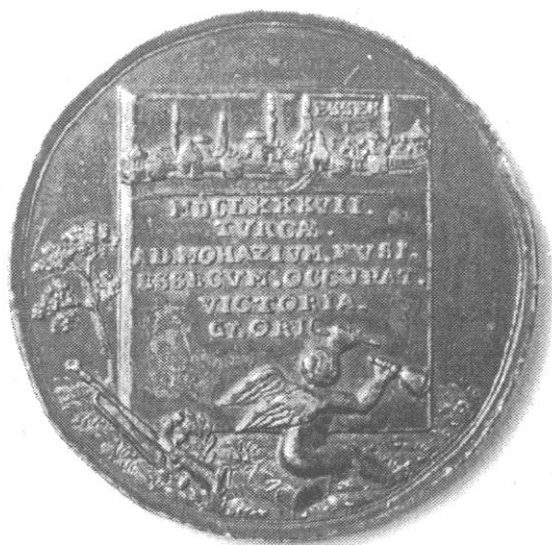
Sl. 6., Kat. br. 10.