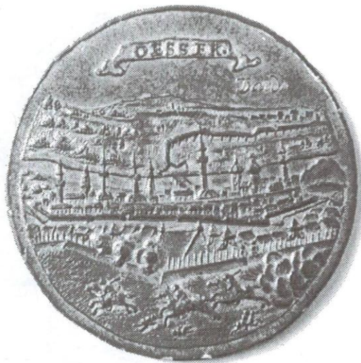
Sl. 3., Kat. br. 7.