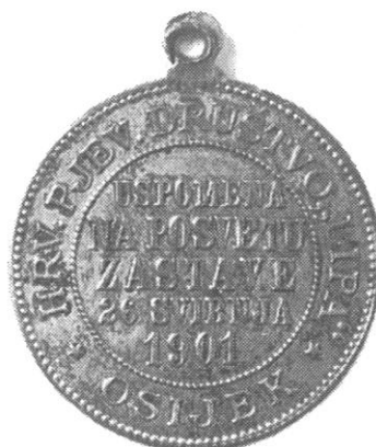
Sl. 16., Kat. br. 34. Kat. br. 35. Kat. br. 36. Kat. br. 38.