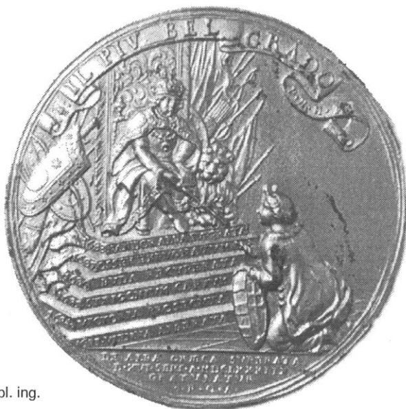
Sl. 10., Kat. br. 17.