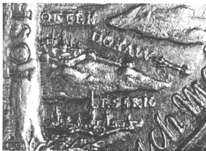
Sl. 7., Kat. br. 11.