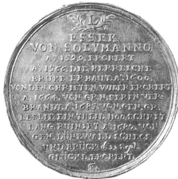
Sl. 8., Kat. br. 12.