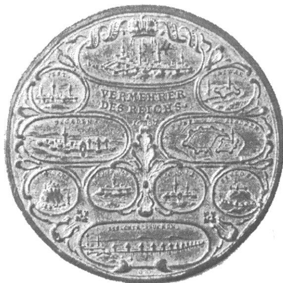
Sl. 1., Kat. br. 1.