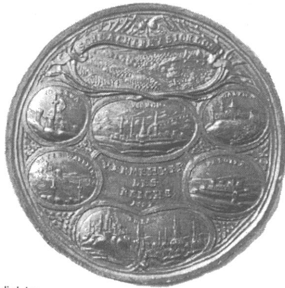
Sl. 2., Kat. br. 4.