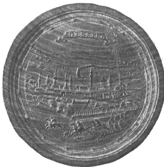
Sl. 4., Kat. br. 8.