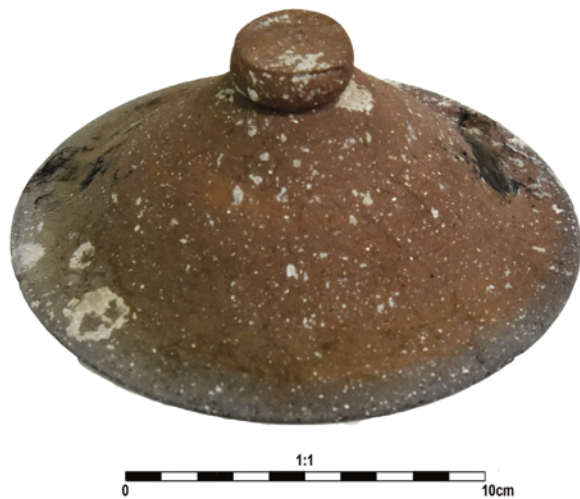
Slika 17. Poklopac lonca ili zdjele