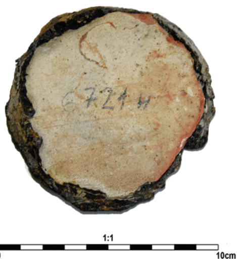
Slika 15. Priklesan poklopac amfore