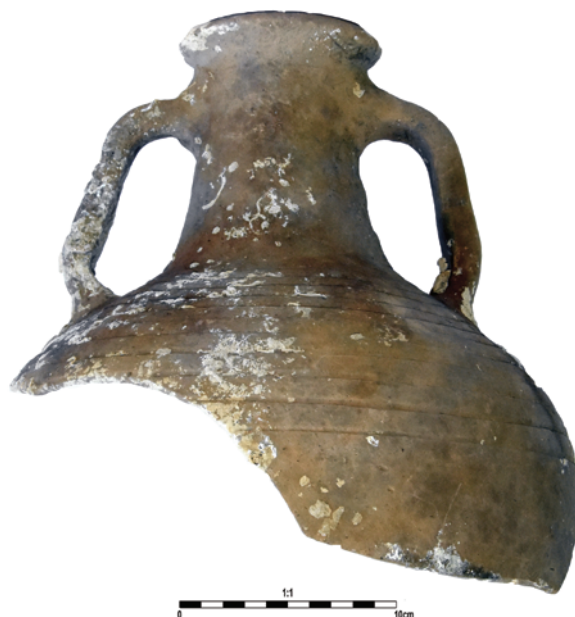
Slika 6. Veća varijanta amfore tipa M 235/327, tip 1 Figure 6. Larger sub-type of amphora M 235/327, type 1

Besides the African types, this is the most numerous type in the shipwreck when it comes to the number of fragments. Throughout the Mediterranean and Balkans, this type of amphorae was dated to the 4 th and 5 th centuries. A. Opař calls it M 235/M 327 (based on the number assigned to it when the excavations at the Athenian Agora were published 15 ). It is a step in the development of the shape of this amphora. Opař analyzed them as they appeared among the finds at the Athenian Agora, dating them to the period between the early 1 st century AD and