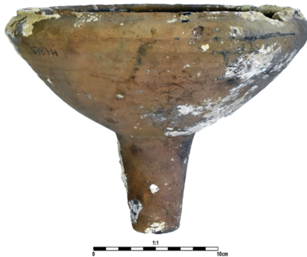
Slika 18. Keramički lijevjak

Nađeno je iznimno malo ostataka brodske opreme i/ili konstrukcije. Radi se uglavnom o savinutim ili ravnim komadima olovnog lima amorfnih oblika i jednom čavlu s pravokutnom glavom (sl. 19–20).