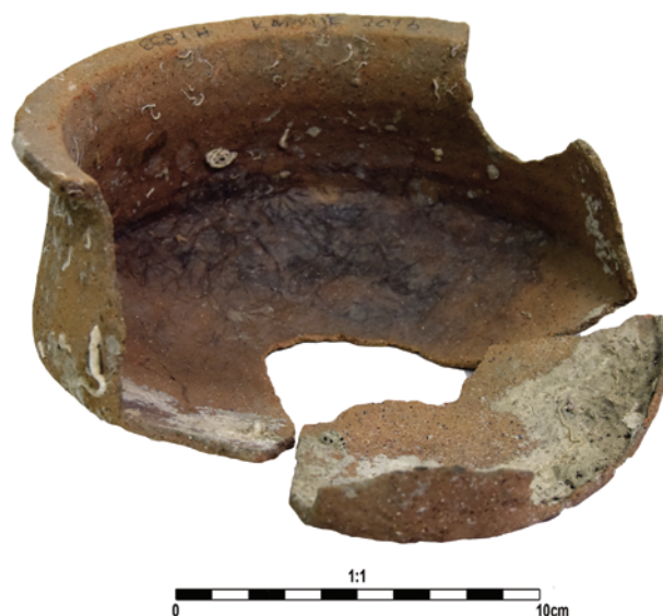
Slika 16. Ulomak bikonične zdjele

The ceramic funnel has a flattened narrow rim, slightly slanted outwards. Body widening under rim, curving into lower cone. Upper portion of body ribbed on the outside. Two shallow horizontal grooves on lower portion of body;