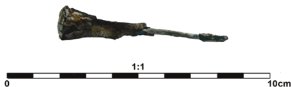
Slika 20. Čavao