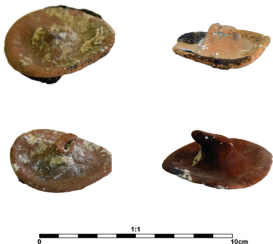
Slika 14. Poklopci amfora