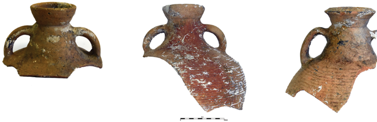
Slika 12. Vratovi amfora nepoznate analogije, inv. br. 6726H, 6744H, 6786H

Figure 12. Amphorae necks of unknown analogy, Inv. No. 6726H, 6744H, 6786H