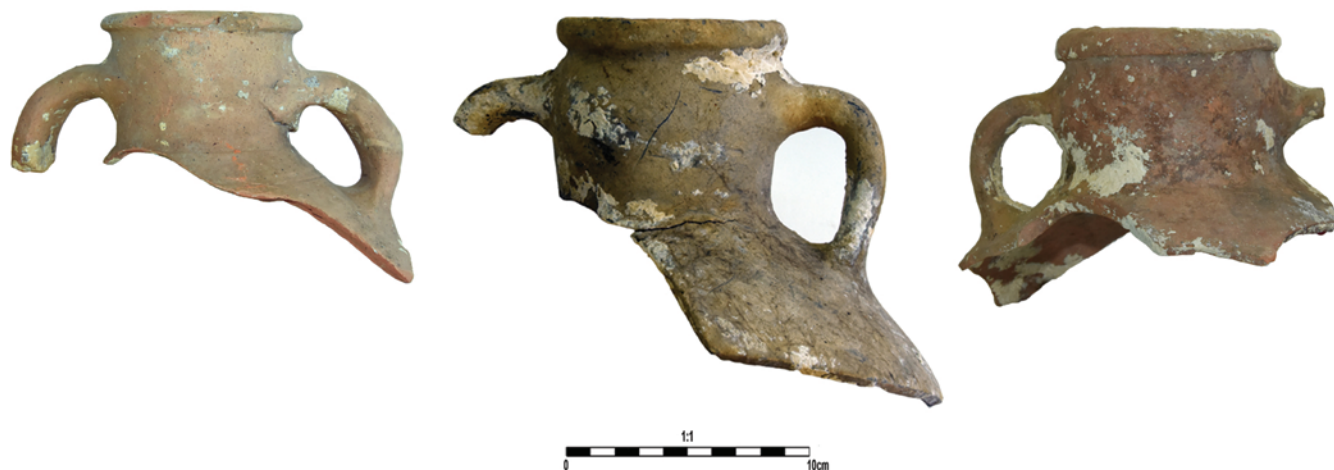
Slika 8. Vratovi amfora tipa Agora M 273

This type of amphora was found at Qasrawet site in Northern Sinai, during a survey. It was identified as a type originating from the Aegean that became popular only in the 5 th and 6 th centuries, when it developed into a separate type. 33