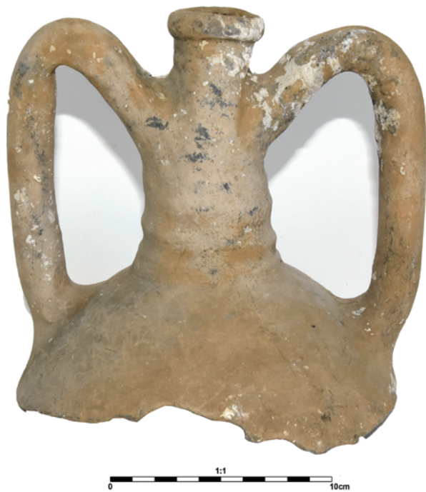
Slika 9. Vrat amfore tipa Agora M 274 similis Figure 9. Amphora neck, Agora M 274 similis type

Datirane su također i zatvorenom cjelinom kasnoantičkog brodoloma Yassi Ada koji je smješten u vrijeme 4. st. 34 Na atenskoj agori ovaj tip amfore pronađen je u kontekstu datiranom u kasno 4. st. Prema tome primjerku amfora je i nazvana (M 273). 35 A. Opaït ovaj tip amfore stavlja u veću grupu amfora koju naziva „vrećastim amforama“ ( baggy amphora shape ). Oblik s Kaprija spada u razvojnom slijedu u tip koji se pojavljuje krajem 4. st., zajedno s amforom Agora M 273 s atenske agore i ulomcima i amforama iz Marseillesa, Benghazija i Gortine. 36