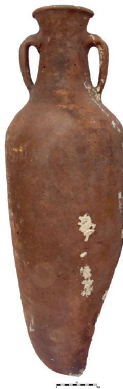
Slika 4. Amfora tipa Africana III B Figure 4. Amphora, Africana III B type

The African types most likely contained wine, although fish products or sauces cannot be ruled out. 12 According to I. Koncani Uhač, they could have contained olive oil, too. 13 S. J. Keay mentions a resin coating on some specimens from Drammont F site, as well as remains of fish and crustaceans in the amphorae found at La Pointe de la Luque site, which indicates that fish products or sauces were transported in them. Underlining the importance of olive oil for the economy of North African provinces, he suggests that these amphorae mostly contained oil. 14