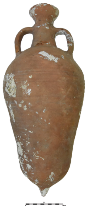
Slika 5. Amfora tipa M 235/327, tip 1 Figure 5. Amphora, M 235/327, type 1