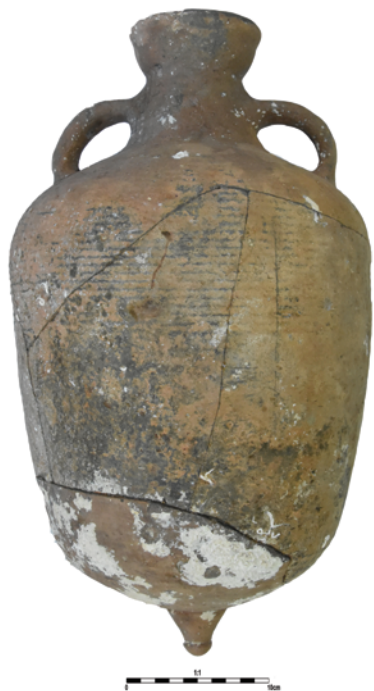
Slika 7. Amfora tipa Agora M 235/327, tip 2 Figure 7. Amphora Agora M 235/327, type 2

Obod je u obliku ljevka, zadebljan pri vrhu. Vrat je kratak i koničan. Ručke započinju odmah ispod oboda i završavaju