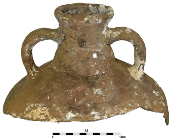
Slika 10. Vrat nepoznate analogije, inv. br. 6725H

Kat. br. 84 – Sačuvana je gornja polovica amfore, zaobljenog i zakošenog oboda prema gore. Vrat je kratak i konusan, a ručke trakaste i okrugle. Započinju ispod oboda i završavaju na ramenu. Tijelo je cilindrično, gušće narebreno oko ramena, a rjeđe na trbuhu (sl. 10).