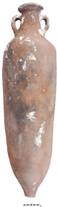
Slika 3. Amfora tipa Africana III A Figure 3. Amphora, Africana III A type