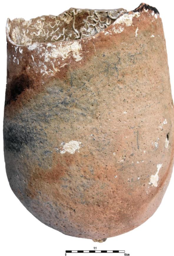
Slika 11. Donji dio amfore nepoznate analogije, inv. br. 6791H

In the Greek colonies of Novae and Cheronesus on the northern coast of Black Sea, the amphorae of this