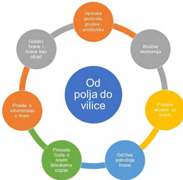
Slika 2. Ključni elementi strategije „Od polja do vilice”

elemente buduće prehrambene politike, uključujući smanjenje korištenja pesticida i gnojiva u poljoprivredi, promicanje zdrave prehrane i unaprjeđenje položaja poljoprivrednika u lancu vrijednosti hrane. Okvirni je rok u kojemu Europska komisija mora objaviti ovu strategiju proljeće 2020. godine te će predstavljanje i rasprava o ovoj strategiji biti na dnevnom redu Vijeća EU-a za vrijeme hrvatskog predsjedanja (slika 2).