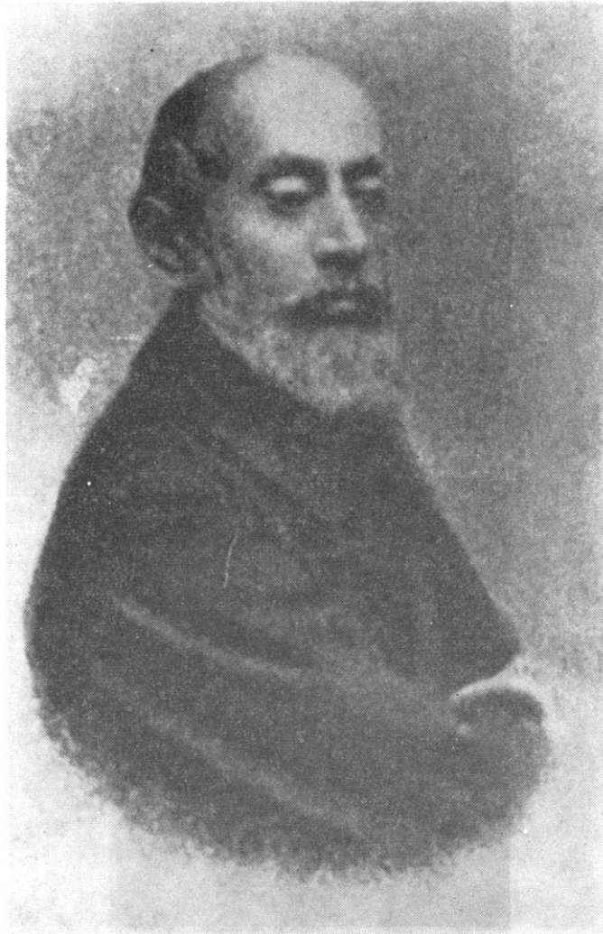
Sl. 1 Vatroslav Bunjik (1823—1893)