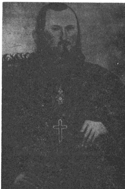
Sl. 3. Stefan Kragujević (1803—1864)