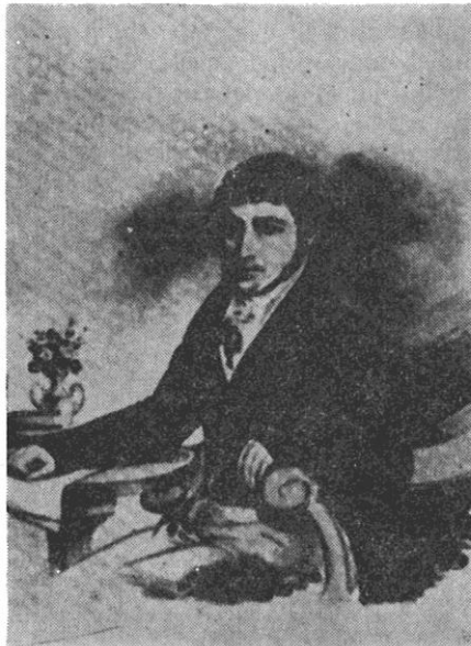
Sl. 5. Aleksandar Antun Pavić (1802—1853)