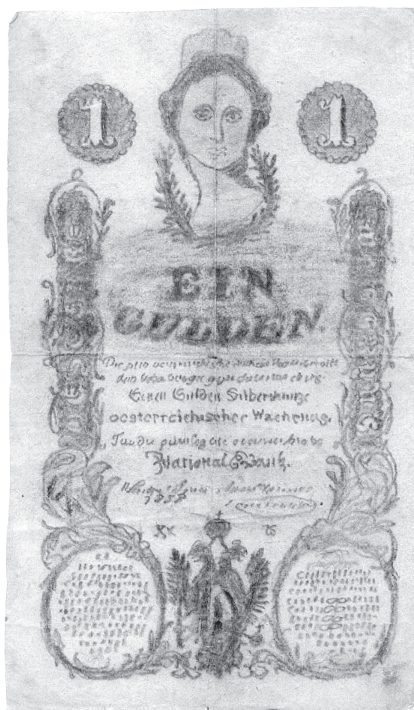
Krivotvorina novčanice Austrijske nacionalne banke od 1 guldena (izdanja 1858.), kat. br. 3.

krivotvoreno crtanjem, 72 x 126 mm, vodenog znaka nema, krivotvoritelj nepoznat, Arheološki muzej Zagreb, Numizmatička zbirka, glavna inventarska knjiga, inventarni broj 1418-3, dar Thurmajera 1901.