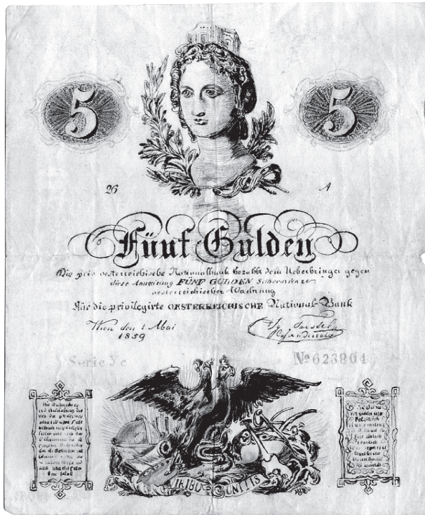
Krivotvorina novčanice Austrijske nacionalne banke od 5 guldena (izdanja 1859.), kat. br. 5.