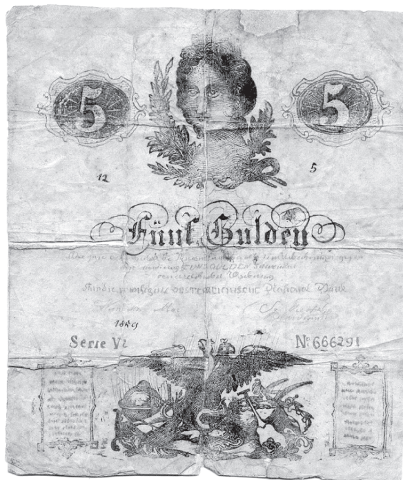
Krivotvorina novčanice Austrijske nacionalne banke od 5 guldena (izdanja 1859.), kat. br. 4.

krivotvoreno crtanjem, 106 x 125 mm, vodenog znaka nema, krivotvoritelj nepoznat,