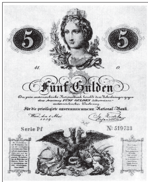
Novčanica Austrijske nacionalne banke od 5 guldena (izdanja 1859.)