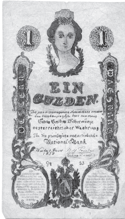
Krivotvorina novčanice Austrijske nacionalne banke od 1 guldena (izdanja 1858.), kat. br. 2.

krivotvoritelj nepoznat, Arheološki muzej Zagreb, Numizmatička zbirka, glavna inventarska knjiga, inventarni broj 1418-2, dar Thurmajer, 1901.