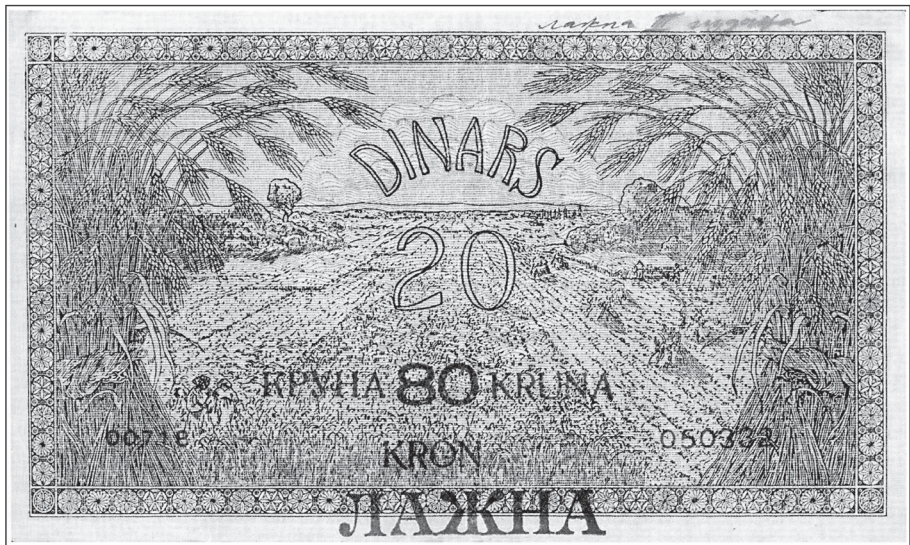
Krivotvorina novčanice od 20 dinara/80 kruna (izdanja 1919.) Kraljevstva Srba, Hrvata i Slovenaca (Z. JELINČIČ, Dinarsko kronska serija/Dinar crown series, Ljubljana, 1997.)