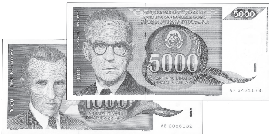
Slika 8. Niz nobelovaca: Nikola Tesla, Ivo Andrić

4. Lik Ive Andrića kao nobelovca logički je slijed na novčanicu s likom Nikole Tesle, također nobelovca, koji je na „Markovićevu“ dinaru otisnut na apoenu od 1000 dinara 26. 11. 1990., pa je izgledno da je tendencija bila predstaviti likove naših nobelovaca (slika 8.) u slijedu.