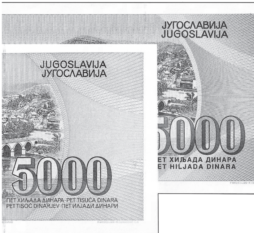
Slika 5.b Ilustrativna usporedba naziva države na apoenu 5000 dinara 1991. s jasno „uklonjenim“ „SFR“ te centriran naziv naknadno na apoenu SR Jugoslavije iz 1992.

2. Na aversu u vertikali lijevo i desno (slika 6.) ostavljen je prostor za otisnuta imena republika kao na svim novčanicama „Markovićeve“ dinara. Taj ostavljeni prostor jasno je vidljiv osobito na lijevoj strani, gdje crtež Višegrada nije otisnut u širini 3 do 4 mm uz rubnik, tj. ne dodiruje rubnik, jer su na tome mjestu na izvornoj, prvoj neemitiranoj