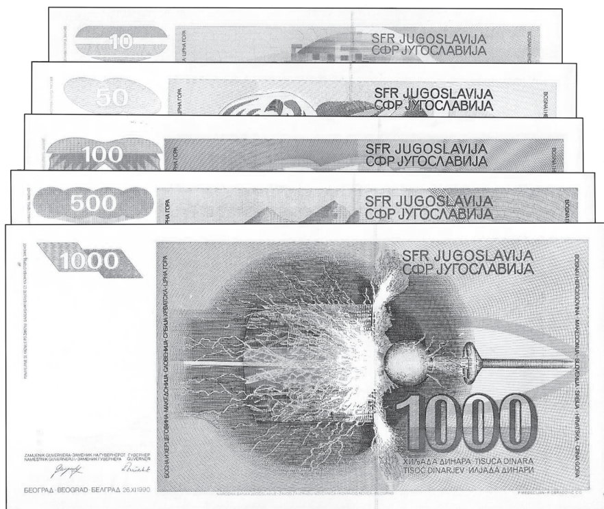
Slika 2. „Redovna“ emisija „Markovičeva“ dinara: 10, 50, 100, 500, 1000 dinara

Narodna banka Jugoslavije emitirala je najprije dvije novčanice (slika 1.) iz serije „za izvanredne potrebe“: 50 i 200 dinara s datumom 1. 1. 1990. (poznatije kao „spomenici“), a koje su iz optjecaja povučene dosta brzo, između 3. 1. i 31. 3. 1991., jer su zbog hitnosti potreba optjecaja bile izrađene u tehnici ravnoga tiska, pa su se mogle lako krivotvoriti. Već 11. 3. 1990. pojavila se prva novčanica „za potrebe redovnog optjecaja“ (slika 2.) od 100 dinara, datirana 1. 3. 1990. i izrađena u kvalitetnoj tehnici dubokoga tiska, a uskoro su slijedile novčanice od 500 dinara (datirana 1. 3. 1990., emitirana 27. 4. 1990.), 50 dinara (datirana 1. 6. 1990., emitirana 10. 6. 1990.), 10 dinara (datirana 1. 9. 1990., emitirana 26. 11. 1990.) te posljednja u nizu, novčanica od 1000 dinara (datirana 26. 11. 1990., emitirana 30. 1. 1991.). (2)