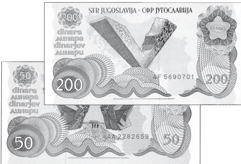
Slika 1. „Izvanredna“ emisija „Markovićeva“ dinara: 50 i 200 dinara

Mnogi čitatelji ovih redaka još pamte osmijeh posljednjega premijera SFRJ Ante Markovića kad je na kraju 1989. godine u Saveznoj Skupštini SFRJ s govornice zamahao dvjema novčanicama „novog“ konvertibilnoga dinara i najavio neočekivane monetarne promjene koje će se dogoditi 1. siječnja 1990. Te 1989. godine inflacija je u prosincu grabila stopom višom od 100 % mjesečno, a tečaj dinara do kraja prosinca dostigao je 69.450 za jednu njemačku marku. (1) Programom Ante Markovića dinar je denominiran: 10000 za 1 novi, konvertibilni dinar, a tečaj je vezan za njemačku marku u omjeru 7 dinara za 1 marku. Te 1990. godine građani su mogli u bankama zamijeniti dinare za devize (što je do tada bilo nezamislivo, a tako će biti nepunih 10 mjeseci). Smjesta je slijedila i nova emisija novčanica, dinari bez toliko zbunjujućih nula.