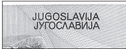
Slika 5.a Iz naziva države na apoenu 5000 dinara 1991. jasno je uklanjanje „SFR“

Tako pozicionirana slova nalaze se na svim novčanicama „Markovićeve“ dinara. Inače, NB Jugoslavije taj je „nedostatak“ korigirala na izdanju iduće emisije, emisije dinara SR Jugoslavije (Srbija i Crna Gora) 1992., koji su zapravo bili modificirani apoeni prethodne emisije. U toj emisiji ćirilični je i latinični naziv „JUGOSLAVIJA“ „ispravljen“, tj. centriran (slika 5.b).