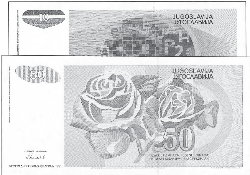
Slika 4. Nezdane novčanice novog „jugoslavenskog“ dinara: 10 i 50 dinara

sije, s međunarodnopravnoga stajališta, SFR Jugoslavija bila je i dalje priznata država u svojoj cjelovitosti. Stoga, unatoč činjenici da je Republika Hrvatska 8. listopada 1991. proglasila prekid svih državno-pravnih veza s dotadašnjom državom SFR Jugoslavijom, emisija 1991. ne može se smatrati nikako drukčije nego kao posljednja emisija i hrvatske nacionalne baštine iz razdoblja postojanja SFR Jugoslavije.