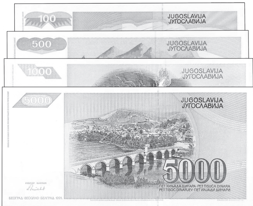
Slika 3. Emisija novog „jugoslavenskoga“ dinara: 100, 500, 1000, 5000 dinara

Novi „jugoslavenski“ dinar emitiran je u novčanicama identičnima prethodnom „Markovićevu“ izdanju uz sljedeće izmjene: