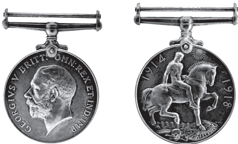
Slika 6. Spomen-medalja za Prvi svjetski rat 1914.-1918., avers i revers