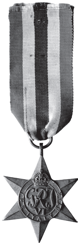
Slika 15. Zvijezda za Italiju