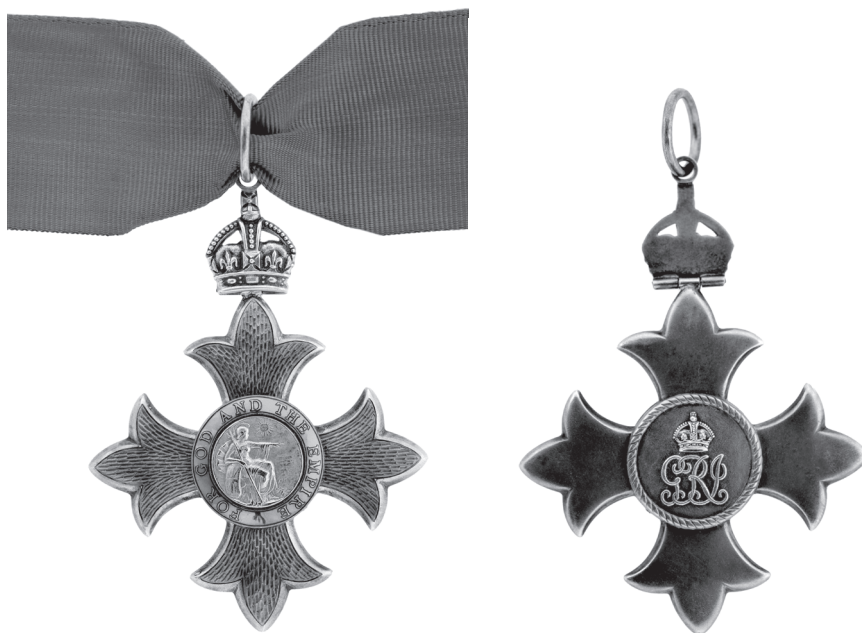
Slika 3. Komanderski križ Najodličnijeg ordena Britanskoga Carstva, 1. model (1917.-1937.), avers i revers

Avers: Krakovi križa ukrašeni su svijetloplavim emajlom. U pozlaćenom medaljonu prikazan je personificirani lik Britanije - djevojka sjedi udesno na stolcu koji ima naslon u obliku školjke. Na glavi nosi kacigu, desnicom pridržava trozub, na desni bok