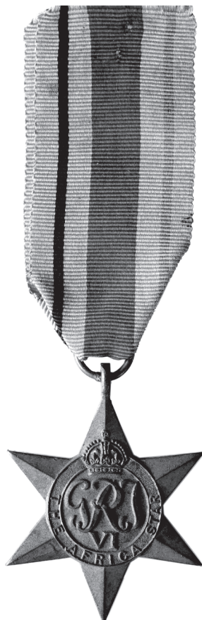
Slika 14. Zvijezda za Afriku