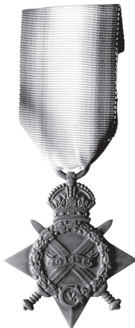
Slika 4. Zvijezda za 1914.-1915. godinu

Avers: U sredini lepršava vrpca s godinama 1914-15 leži na dva ukrižena kratka mača (gladius), s oštricama okrenutim gore. Na mačevima leži lovorov vijenac s monogramom Đure V.: GV.