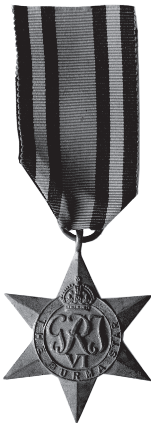
Slika 16. Zvijezda za Burmu