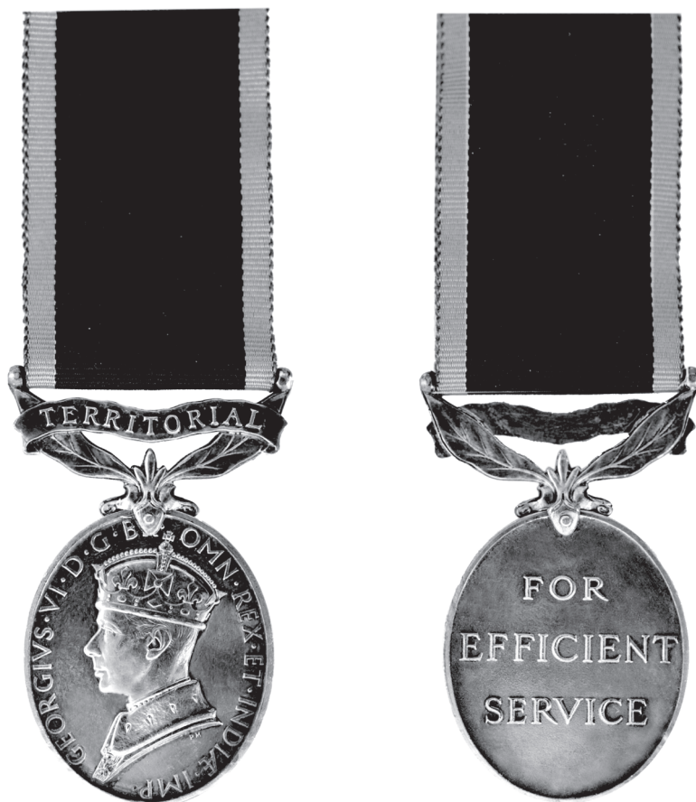
Slika 12. Medalja za uspješnu službu, s likom kralja Đure VI., model 1937.-1948., avers i revers