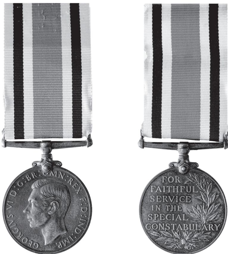
Slika 11. Medalja za vjernu službu u Specijalnoj policiji, s likom kralja Đure VI., 1937.-1948., avers i revers

Povijest Specijalne policije seže u vrijeme kralja Karla II., u godinu 1673., a službeno je utemeljena zakonskim aktom donijetim u Parlamentu 1831. godine. "Specijalni policajci" bili su dragovoljci; plaćeni su im bili samo njihovi troškovi, a imali su iste ovlasti kao "pravi" profesionalni policajci, koji su ih podupirali prema potrebi.