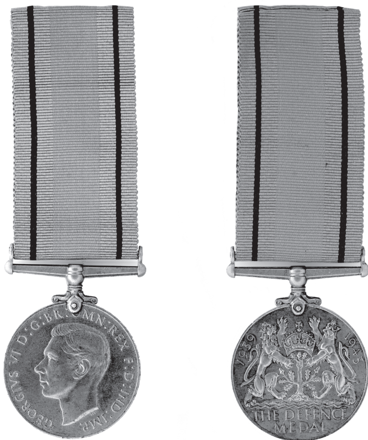
Slika 18. Medalja za obranu zemlje u Drugom svjetskom ratu 1939.-1945., avers i revers

Medalja za Britance izrađivala se od alpake, a za nositelje s područja Commonwealtha izrađivala se od srebra finoće 800/1000.