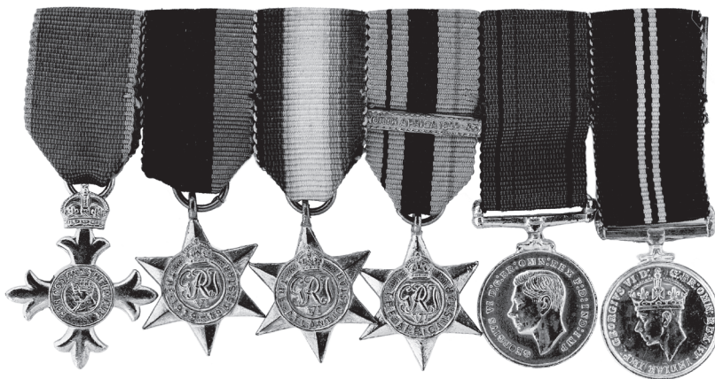
Slika 20. Ordenska kopča sa šest minijatura odlikovanja za Drugi svjetski rat