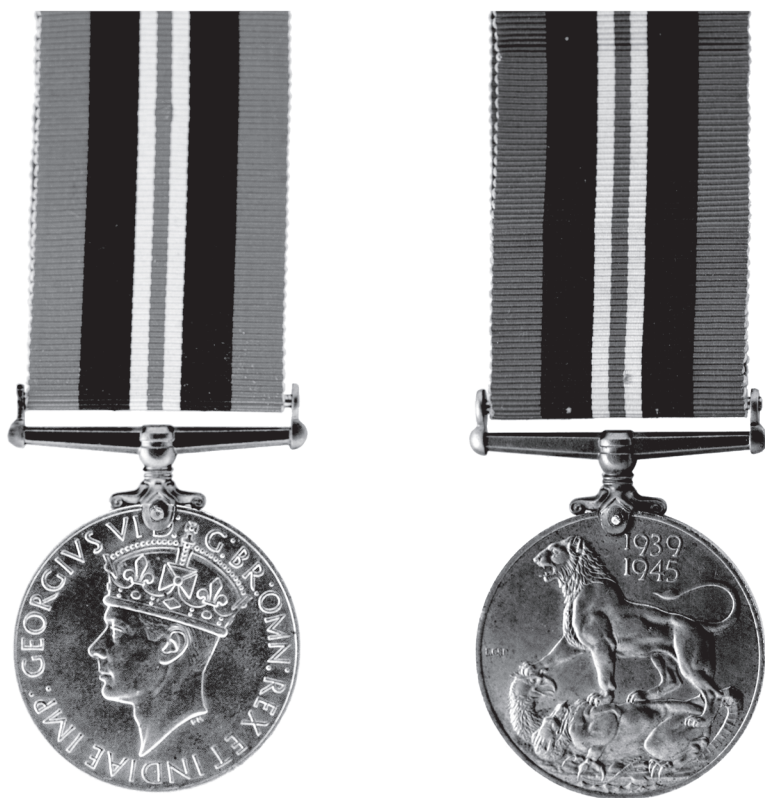
Slika 17. Spomen-medalja za Drugi svjetski rat 1939.-1945., avers i revers