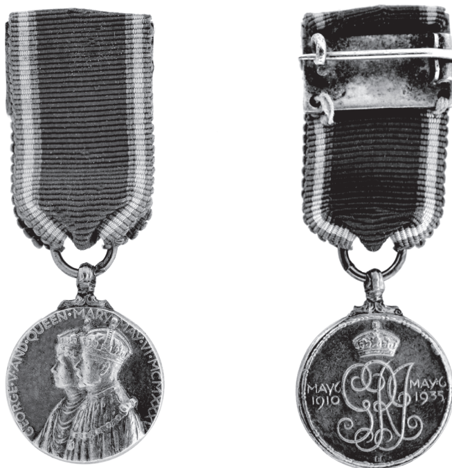
Slika 9. Minijatura Jubilarne medalje 25. obljetnice vladavine kralja Đure V. (1910.-1935.), avers i revers

Vrpca je tamnocrvene boje, s plavo-bijelo-plavim prugama prema rubovima. HPM 34635.