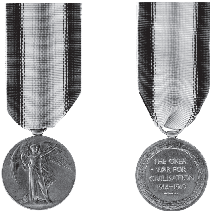
Slika 7. Medalja pobjede u Prvom svjetskom ratu (1914.-1918.), avers i revers