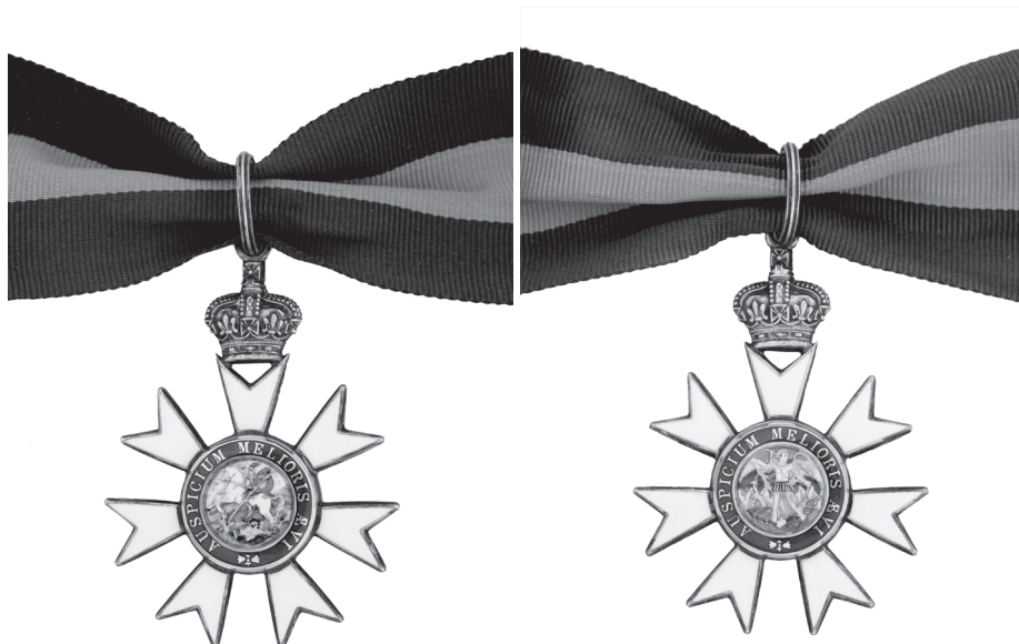
Slika 1. Križ Pratioca Najuglednijeg ordena Sv. Mihovila i Sv. Jurja, avers i revers