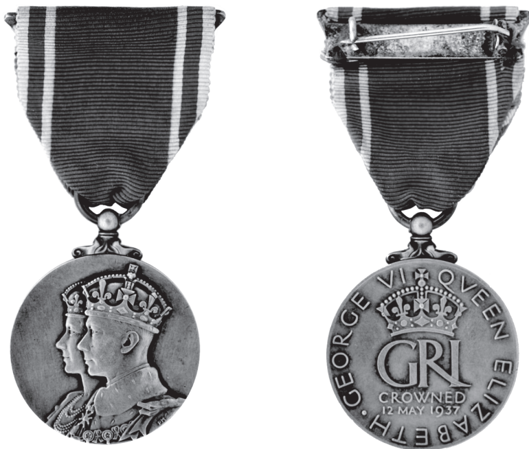
Slika 10. Britanska Spomen-medalja krunjenja kralja Đure VI. i kraljice Elizabete 1937. godine, avers i revers