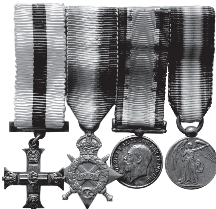
Slika 8. Ordenska kopča s minijaturama odlikovanja za Prvi svjetski rat