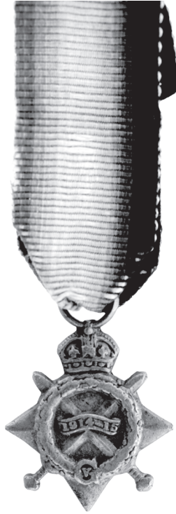
Slika 5. Minijatura Zvijezde za 1914.-1915. godinu

Vrpca je crveno-bijelo-plave boje, s preljevima svjetlijih nijansi između pruga. HPM/ZM 35707.