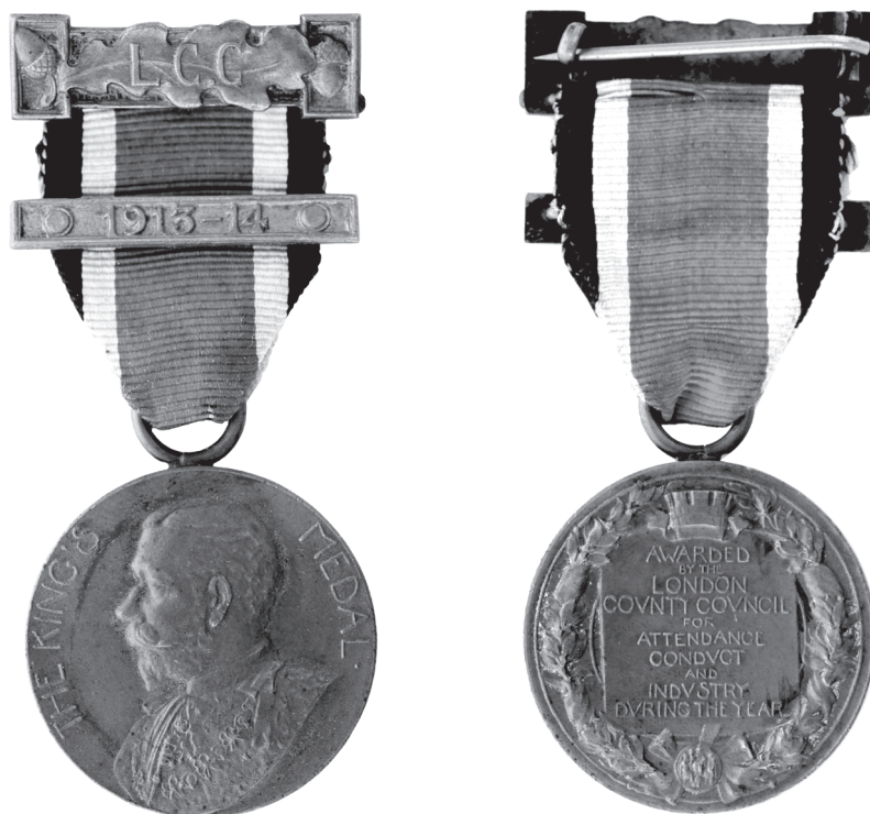
Slika 2. Medalja britanskoga kralja Đure V., za školsku godinu 1913./14., avers i revers