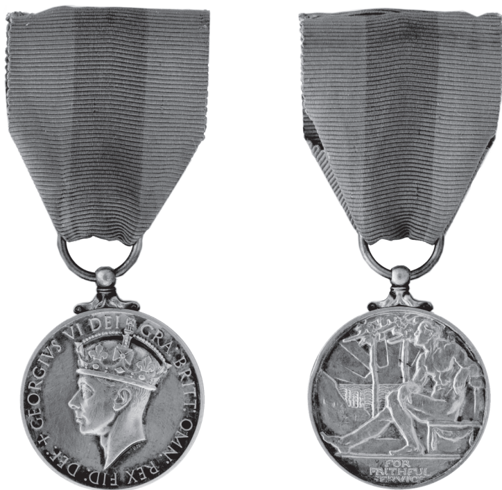
Slika 19. Medalja carske službe, s likom kralja Đure VI., model 1949.-1952., avers i revers

Medalju carske službe osnovao je kralj Eduard VII. u kolovozu 1902., istodobno s Ordenom carske službe ("The Imperial Service Order"). Medalja se dodjeljuje i danas državnim službenicima nižeg ranga nakon odlaska u mirovinu, a koji navršavaju 25 godina službe.