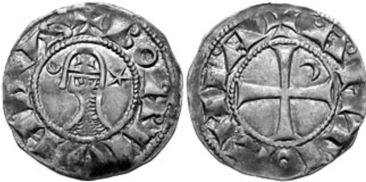
Slika 9. Bohemund III., denar Antiohija.

Interesantno je da se na njegovu denaru pojavljuje i treći oblik rotacije polumjeseca i zvijezde: Mjesec je iznad zvijezde. (Slika 10.)