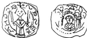
Slika 2. Denar Kostanjevica, Pogačnik tip: 208.

Na frizaticima toga tipa može se vidjeti stojeća figuru biskupa ili nadbiskupa koji u rukama drži dva uzdignuta mača. (Slika 2. i 3.)