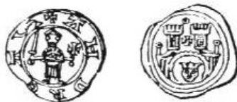
Slika 13. Rengjeo, tip 7.

dva križa, mačem i križem ili dva mača, koje smo već spominjali. Rengjeo tip 7. (slika 13.) na licu nosi prikaz stojeće figure (herceg) koja u svojim rukama drži mač i križ. Okolo unutarnjega kruga stoji tekst legende: + ANDREAS . Kao i prethodno spomenuti tipovi, mislim da je i taj tip „evoluirao“ iz ERACENSIS frizatika te da je kao takav jedan od prvih tipova koje je herceg Andrija dao otkovati.