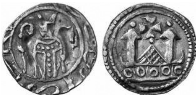
Slika 11. Frizatik tipa ERIACENSIS.

otkovani prije 15. veljače 1198. jer, kao što smo već rekli, Andrija tada već nosi titulu hercega. Budući da je vrijeme do toga datuma ispunjeno ratnim sukobima među braćom, koji se uglavnom vode u okolici Zagreba ili na Dravi kao graničnoj rijeci, Andrija je svoju kovnicu morao smjestiti negdje na sigurno. Je li kovnica bila u unutrašnjosti Hrvatske ili u Dalmaciji, možda nikad nećemo doznati.