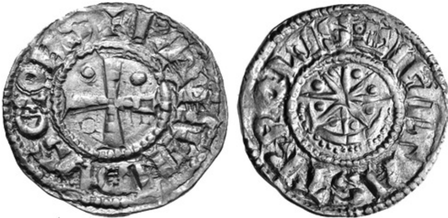
Slika 6. Raimond II.- III., 1137.-1187., denar Tripoli.

Raimond IV. umro je 1105. godine pri opsadi Tripolija, a njegov naum ostvario je sin Bertrand osvojivši Tripoli 1109. godine. Od tada se ta grana obitelji naziva grofovima od Tripolija.