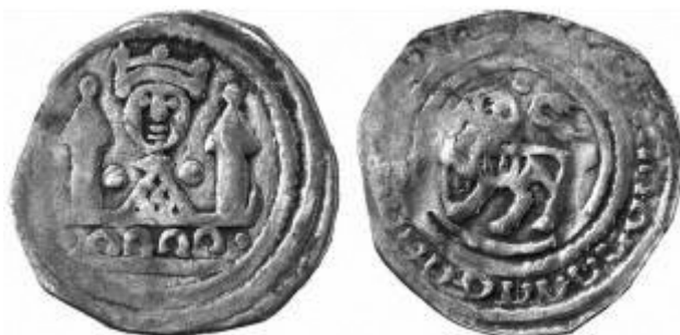
Slika 12. Rengjeo, tip 9.

Postoji još jedna mogućnost koju nitko od autora nije spominjao. Andrija je mogao dati iskovati svoje novce u nekoj od graničnih kovnica. To su mogle biti Kamnik ili Slovenj Gradec, u kojima je njegov tast i pristaša, Bertold IV. u to vrijeme kovao svoj novac. To nije nezamislivo jer je poznato da su se u graničnim kovnicama kovale i „tuđe“ monete. Nakon spomenutoga datuma, 15. veljače 1198., Andrija sa svojom pratnjom putuje Hrvatskom i Dalmacijom, čime je nedvojbeno namjeravao osnažiti svoju vlast. Emerik, koji je vjerojatno htio dobiti na vremenu, time je sebi napravio „medvjedu uslugu“, jer je Andrija u međuvremenu osvojio Hum i stekao nove vanjske i unutarnje saveznike.