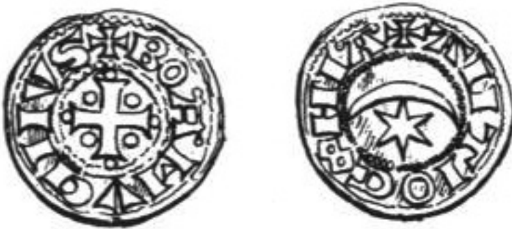
Slika 10. Bohemund III., denar Antiohija.

Interesantno je da se na njegovu denaru pojavljuje i treći oblik rotacije polumjeseca i zvijezde: Mjesec je iznad zvijezde. (Slika 10.)