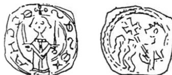
Slika 3. Denar Kostanjevica, Pogačnik tip: 209.