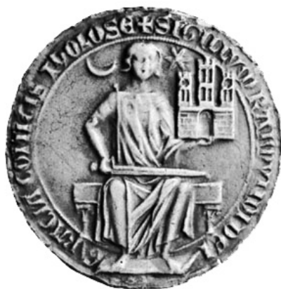
Slika 7. Pečat Raimonda VII., grofa od Toulousea.

Unuk Bertranda od Tripolija, Raimond II. (1137.-1152.) na svoje kovanice oko 1149.-1152. postavlja spomenuti motiv. 18 Paralelno se isti motiv pojavljuje i na kovanicama ogranka obitelji koja je ostala u Toulouseu. Da je simbolika polumjeseca i zvijezde (Sunca) toj obitelji bila od iznimne važnosti, može se vidjeti i na njihovim pečatima, gdje oni stoje, doduše u drugoj formi - jedan nasuprot drugom, ali isto tako uobičajenoj na srednjovjekovnim kovanicama. (Slike 7. i 8.) Ne mogu ne primijetiti da bi se u tom kontekstu na polumjesec i zvijezdu (Sunce) moglo gledati kao na zemljopisne strane svijeta. Zapad (Francuska) i istok (Latinsko Carstvo) dvije su strane svijeta na kojima ova obitelj ima svoje posjede.