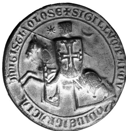
Slika 8. Pečat Raimonda VII., grofa od Toulousea.

Ta forma može se vidjeti na našim slavonskim banskim denarima, ali i na popularnim denarima Bohemunda III. (1163.-1201.) kovanim u Antiohiji. (slika 9.) Bohemund je u Antiohiji kovao i denare koji također nose identičnu formu polumjeseca i zvijezde (Sunca).