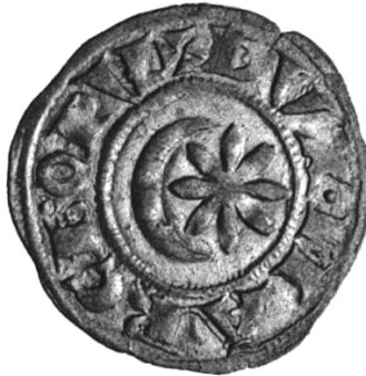
Slika 5. Raimond VI.-VII., 1194.-1249., denar Provanse.

Zanimljivo je da motiv polumjeseca i zvijezde vidimo na kovanicama te obitelji kao grofova Toulousea, ali i kao grofova Tripolija, gdje je obitelj pustila svoje korijene i proširila svoje obiteljsko stablo. Porodica je podrijetlom iz Saint-Gillesa, a njihova imanja i moć bili su mnogo veći no što bi se po njihovoj grofovskoj tituli moglo zaključiti. Bili su i kneževi Narbone, markgrofovi Provanse i gospodari petnaestak drugih područja kojima su upravljali njihovi vazalni grofovi. Kad je papa Urban II. 1095. godine na koncilu u Clermontu uputio poziv na Prvi križarski pohod, Raimond IV., grof od Toulousea, prvi se odzvao. 17