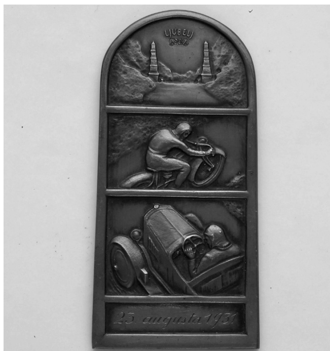
Slika 35. Plaketa

Godine 1931. dobio je od Saveza motoklubova Kraljevine Jugoslavije, za 26 pobjeda u kategoriji 500 ccm, brončanu plaketu, apliciranu na drvenu podlogu dimenzija 24 x 16 cm. Plaketa je dimenzija 15 x 11 cm.