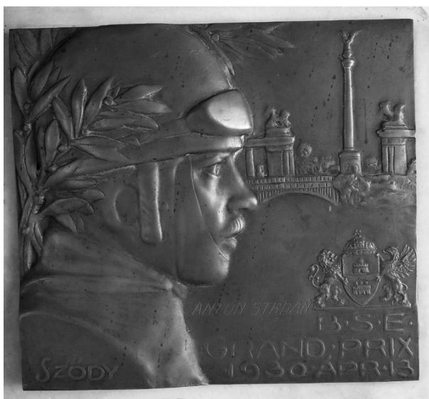
Slika 29. Plaketa s postoljem