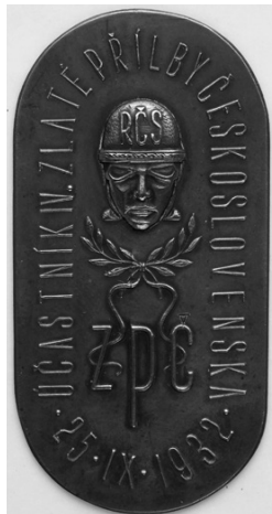
Slika 38. Plaketa

Tekst uz rub: UČASTNIK IV. ZLATE PRILBY ČESKOSLOVENSKA, u sredini gore glava motociklista s kacigom na kojoj su slova RČS, ispod glave dvije vrpcom zavezane lovorove grančice, ispod kojih su slova ZPČ.