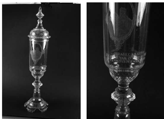
Slika 31. Pehar