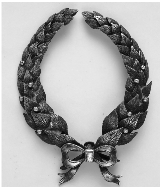
Slika 32. Vijenac

Uz vijenac je dobio i njegovu umanjenicu.