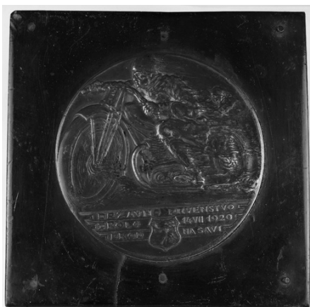
Slika 27. Plaketa s podlogom

U gornjem je dijelu motociklist koji juri u lijevo, a dolje je tekst: DRŽAVNO PRVENSTVO / x kolo / 14 VII 1929 / BROD NA SAVI. U sredini donja dva reda teksta grb je grada Broda na Savi.