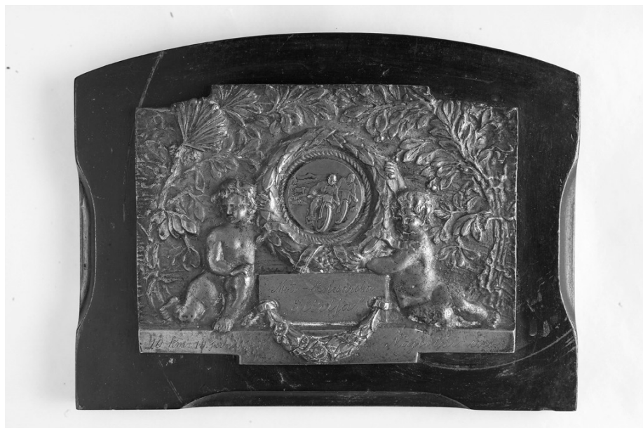
Slika 15. Plaketa s podlogom

Na poledini drvene podloge tekst je: E. E. BERTONI, Corso Garibaldi, Milano.