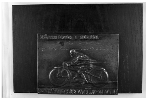
Slika 36. Plaketa

Dolje je reljefni tekst: SAVEZ MOTOKLUBOVA KR. JUGOSLAVIJE.