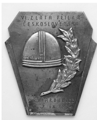
Slika 40. Plaketa