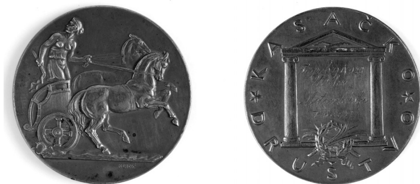
Slika 9. Avers, revers

Revers: uz rub tekst *KASAČKO *DRUŠTVO. Između nadsvođenih dorskih stupova tekst: Zagreb 9. IX 923 / Utrka / Motocyklista / I nagr. Dolje u lovorovu vijencu prekrížene su dvije palmine grančice.