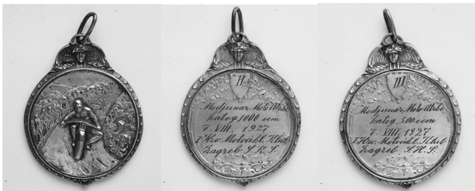
Slika 17. Avers, revers, revers

Revers: uz rub su grane lovora i hrasta, koje se granaju u vrhu, i na njima je štitić s brojkom II, odnosno III. U sredini je tekst: Međunar. Moto Utrka / kateg 1000 ccm, odnosno 500 ccm / 7. VIII. 1927 / I Hrv. Motocikl. Klub / Zagreb S.K.S.