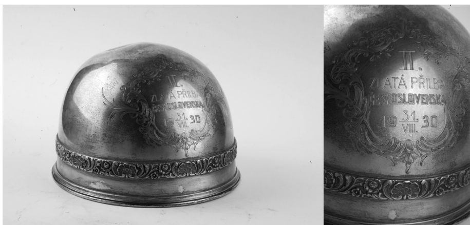
Slika 30. Kaciga