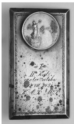
Slika 5. Avers