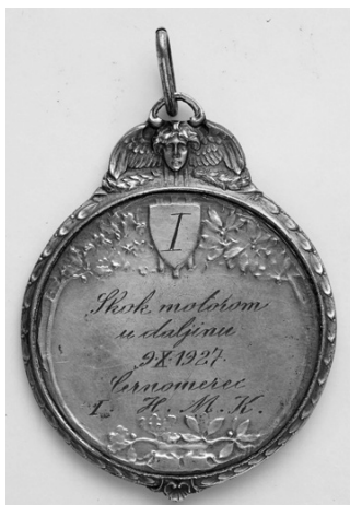
Slika 19. Revers