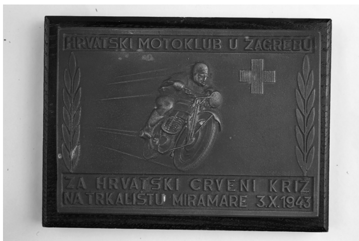
Slika 41. Plaketa

U sredini plakete, s obje strane uz rub uspravljena je lovorova grančica; u sredini motociklist u vožnji u desno, a ispred njega znak Crvenoga križa.