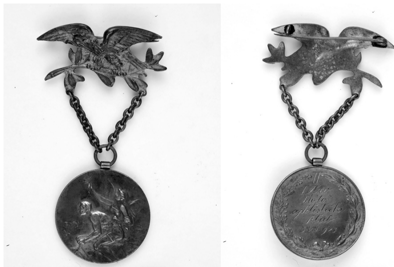
Slika 8. Avers, revers