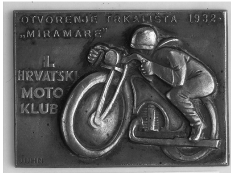
Slika 37. Plaketa

Na poledini je plakete signatura: Griesbach i Knaus Zagreb.