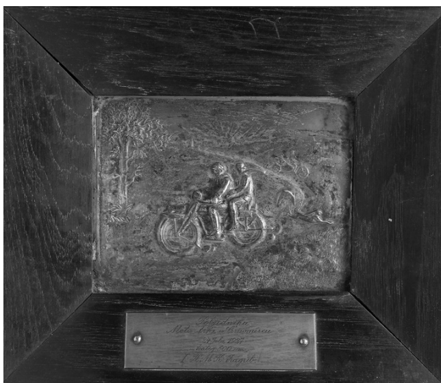
Slika 16. Slika s okvirom i plaketom