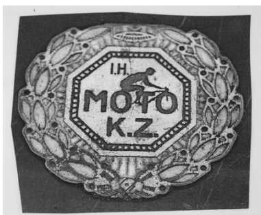
Slika 2. Znak I.H. MOTO K.Z. Zagreb

Od prve cestovne motorističke utrke u Francuskoj, od Pariza do Cabourga 1897. godine, probuđeni interes za športski motociklizam rezultirao je osnivanjem motociklističkih klubova diljem svijeta, pa i u našim krajevima.