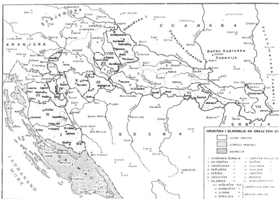
Sl. 1. Hrvatska i Slavonija na kraju XVIII st. (Karta iz knjige J. Sidaka »Kroz pet stoljeća hrvatske povijesti«, Zagreb, 1981.)

vatska i Slavonija zauzimale su 1851 god. mali prostor od svega 334.81 zemlj. četv. milja, a Hrvatska—Slavonska Krajina 379.72 zemlj. četv. milje, što je ukupno 714.53 zemlj. četv. milje.