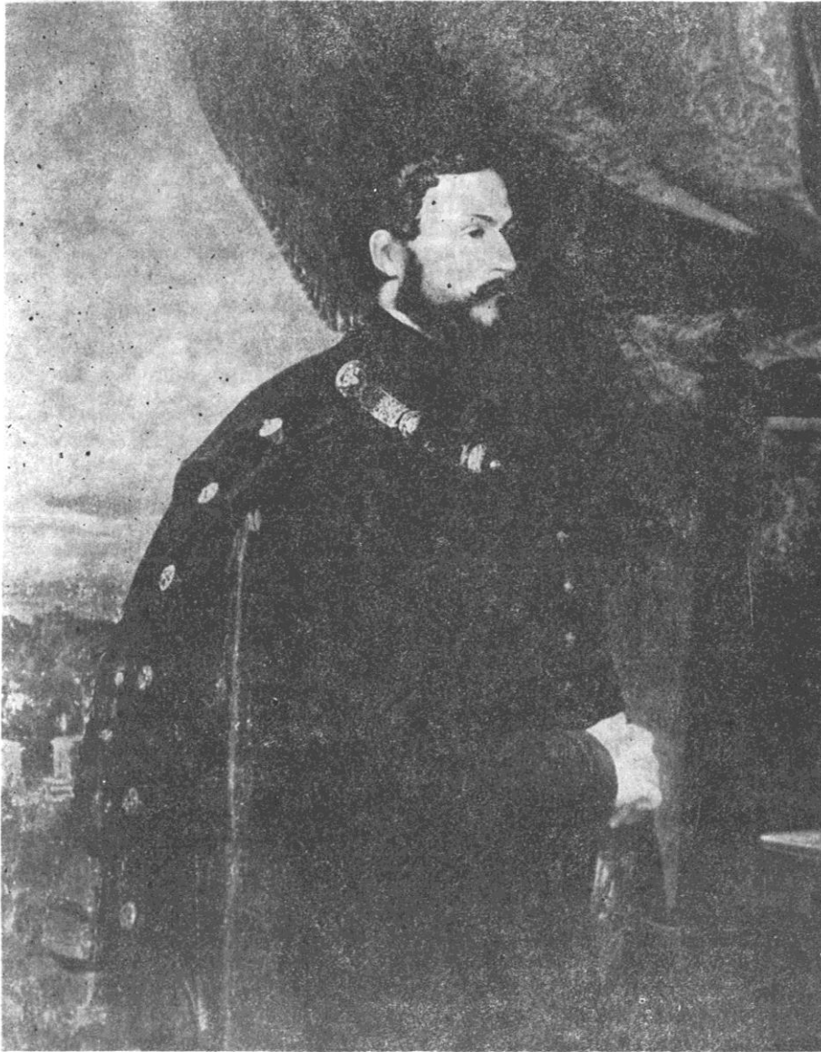
Sl. 3. grof Casimir Batthyany — povjerenik mađarskog »Odbora za obranu domovine« — u Osijeku 1848.

Najzad, 22. listopada 1848. ovo stanje ni rata ni mira prekinuto je dolaskom povjerenika mađarskog »Odbora za obranu domovine«, grofa Casimira Batthyanyja u osječku tvrđu, na čelu »41. honvedskog bataljuna i 5 topova«. 55 Narodnjaci su se razbježali. A dosta ih je pohvatano od Mađara. No