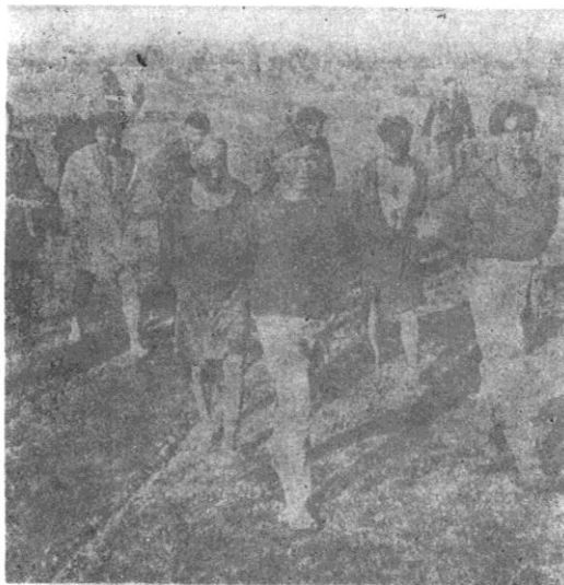
Sl. 7. Zarobljeni pripadnici 11. njemačke zrakoplovne divizije kod Josipovca, za vrijeme operacije forsiranja Drave u travnju 1945. godine