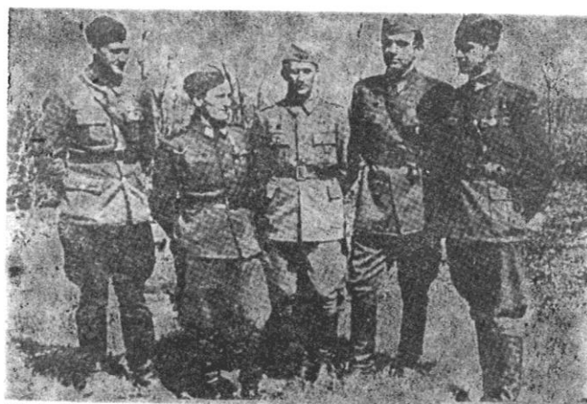
Sl. 4. Stab 51. udarne (vojvođanske) divizije u Baranji 1945.