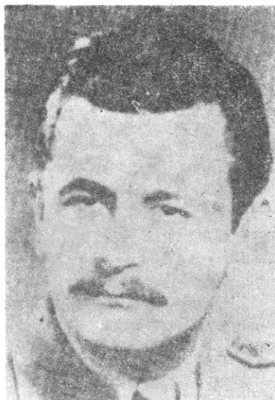
Sl. 10. Lazar Marković Čađa, narodni heroj Jugoslavije, komandant 1. bataljona 8. vojvodanske brigade NOVJ