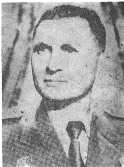
Sl. 9. Milan Ješić Ibra (1914—1986) narodni heroj Jugoslavije, komandant 7. vojvodanske brigade NOVJ