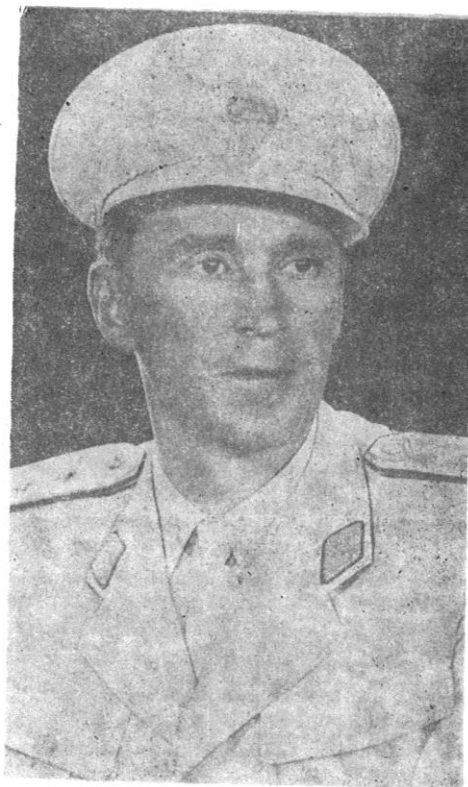
Sl. 3. Kosta Nađ (1911—1986) narodni heroj Jugoslavije, general-lajtnant, komandant 3. JA u toku završnih operacija 1945. godine