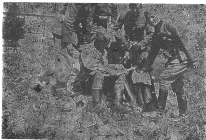
Sl. 8. Borci Osječke udarne brigade čitaju novine, neposredno nakon oslobođenja Osijeka 15. travnja 1945. godine