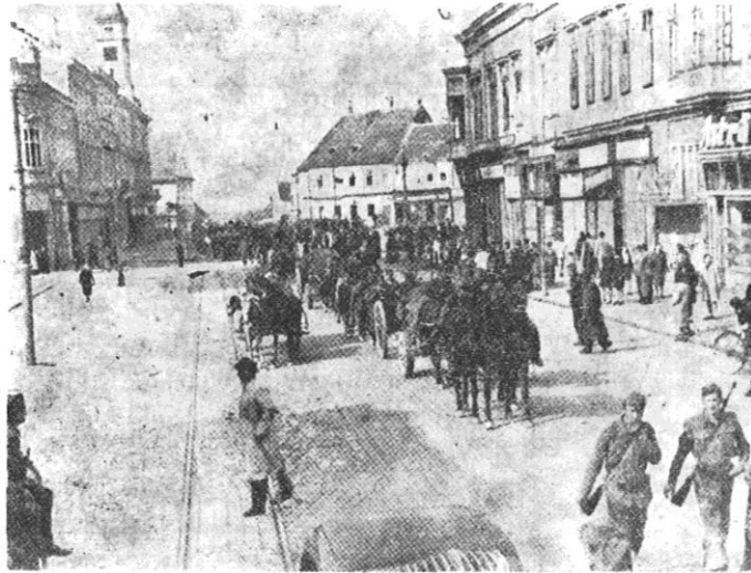
Sl. 5. Jedinice 51. udarne (vojvodanske) divizije i Osječke udarne brigade ulaze u Osijek 14. IV 1945.