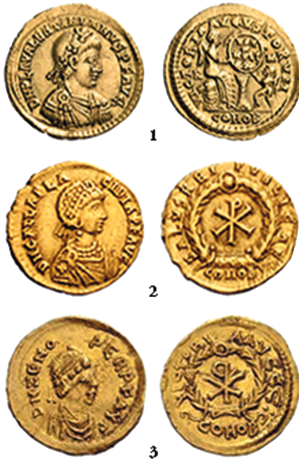
Sl. 2. - Glavni tipovi zapadnorimskih semisa od vremena cara Valentinijana III. (425.-455.) do pred kraj 5. stoljeća (ca. 2:1): 1 - tip Vota cara Valentinijana III. (Nomos, 19/2019, no 390); 2 - Tip Chi-ro Gallae Placidije s legendom SALVS DEI PVBLICAE (NAC 42/2007,

genij, 3 krilati lik, 4 Kupido 5 ili puto 6 i šesterokraka zvijezda u polju desno, a na semisi s aukcije Bertolami/ACR genija nema, a šesterokraku zvijezdu zamijenila je osmerokraka zvijezda postavljena u polje lijevo od Viktorije. Uz to u egzergu semise s aukcije Bertolami/ACR jasno se raspoznaje COMOB s točkom između okomitih hasti slova M, koje pak na semisi iz Ermitaža nema.