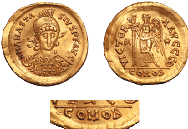
Sl. 4. - Solid kralja Teodorika kovana u ime cara Anastazija u Rimu (ca 2:1), RomNum XI/2016, no. 944.

Iako su reversi obiju Teodorikovih semisa u brojnim detaljima razlikuju, neprekinuta reversna legenda VICTORIA ACVSTORVM s ispuštenim (drugim) V zastupljena je na obje semise. Ispuštanje slova kao propust napravljen na novcu koji se smatra ceremonijalnim kovanjem 16 i pripisuje dolasku Anastazija na carski tron, 17 ne čini se