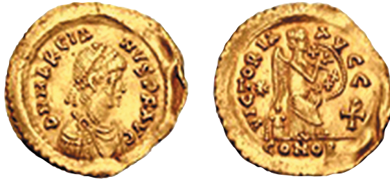
Sl. 3. - Semisa cara Marcijana (450.-457.) kovana u Konstantinopolu, (ca 2:1), CNG 450e/2019, no. 405.).

kovanim u ime cara Arkadija i Honorija već oko 403. godine 15 i od tada je konstantna i pravilno važeća za semise svih kasnijih istočnorimskih (ne i ženskih članova carske obitelji!) i ranobizantskih vladara.