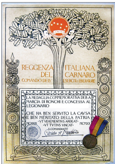
Slika 3. Diploma uz Spomen-medalju ekspedicije u Rijeku.

Spomen-medalju ekspedicije u Rijeku ( Medaglia commemorativa della spedizione di Fiume ) osnovao je Gabriele D'Annunzio kao zapovjednik proglašenog „Talijanskog namjesništva nad Kvarnerom“ ( Reggenza Italiana del Quarnero ). 6 Medalja se u početku nazivala Medaglia commemorativa della Marcia di Ronchi (Spomen medalja na marš iz Ronchija) jer se dodjeljivala sudionicima marša iz Ronchija u Rijeku. Međutim, medalju je dobila i posada talijanske krstarice Cortelazzo , koja je uplovila u riječku luku 22. rujna 1919. Nadalje, medalja se dodjeljivala pristalicama D'Annunzija koji su sudjelovali u borbama tijekom "Krvavog Božića" (24.-29. prosinca 1920.) i poznatim ličnostima koje su na neki način pridonijele opstanku autonomije fašističke Rijeke.