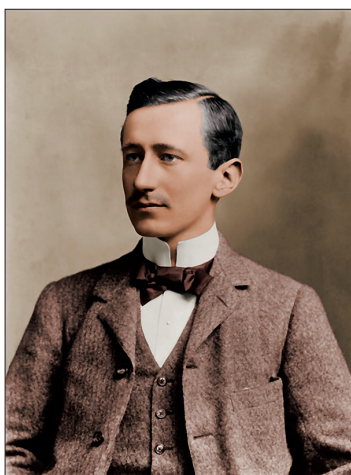
Slika 8. Inženjer Guglielmo Marconi.