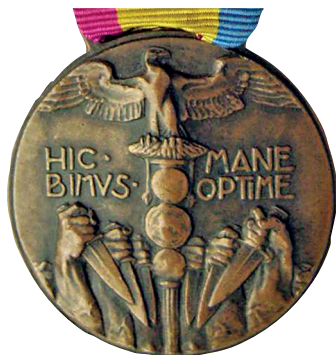
Slika 9. Spomen-medalja ekspedicije u Rijeku, avers.

Avers: u sredini je prikazan rimski legijski orao ( aquila ) s geslom: HIC MANE / BIMVS OPTIME. 11 U donjoj polovici medalje prikazano je šest visoko podignutih ruku spremnih na udarac kratkim rimskim mačevima (slika 9.).