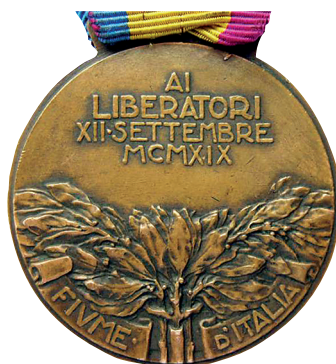
Slika 10. Spomen-medalja ekspedicije u Rijeku, revers.

Postoji i minijatura Spomen-medalje ekspedicije u Rijeku 1919. godine izrađena od bronce, promjera oko 16 mm, s vrpcom širokom 13,5 mm.