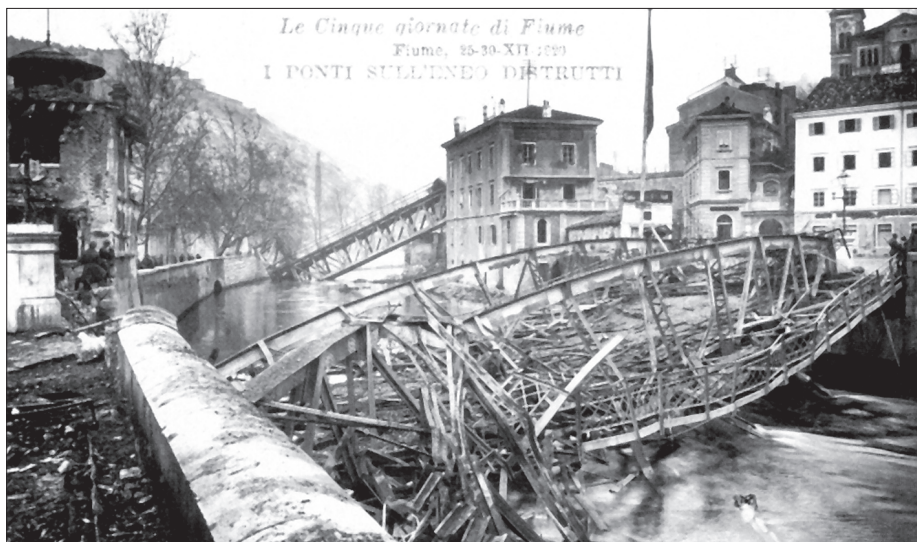
Slika 2. Mostovi na Rječini srušeni u noći 24. prosinca 1919.

Gabriele D'Annunzio, koji je vladao Rijekom, nije htio priznati sporazum nego je proglasio ratno stanje i pozvao talijanske Riječane na otpor. Nakon petodnevne akcije regularne vojske Kraljevine Italije slomljen je njegov otpor. Pritom je Rijeka pretrpjela razaranja. Bojeći se napada sa Sušaka, D'Annunzio je noću na Badnjak 1919. godine dao srušiti pet mostova i dva vijadukta na Riječini (sl. 2.). Međutim, 24. prosinca ujutro talijanske regularne vojne postrojbe napale su D'Annunzijeve legionare na Kantridi.