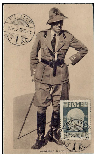
Slika 1. D'Annunzio na razglednici, s markom i poštanskim žigom Rijeke iz 1921. godine.

Ohrabreni i oduševljeni dočekom mase talijanskih Riječana, stigli su i do mosta na Rječini odakle su prijetili Hrvatima s druge strane obale podijeljenoga grada. U predvečerje 12. rujna zapovjednik paravojske Gabriele d'Annunzio, odjeven u uniformu potpukovnika, ušao je u Guvernerovu palaču odakle je, s balkona, okupljenom mnoštvu obznanio kako je Rijeka pripojena Italiji.