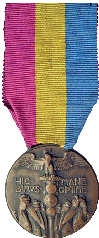
Slika 4. Spomen-medalja ekspedicije u Rijeku 1919. godine.

Medalja se dodjeljivala s diplomom koju je potpisivao D'Annunzio (sl. 3.). Medalja je legalizirana 31. siječnja 1926. 7 , a 13. srpnja 1938. dopuštena je dodjela odlikovanja bez ograničenja (sl. 4.).