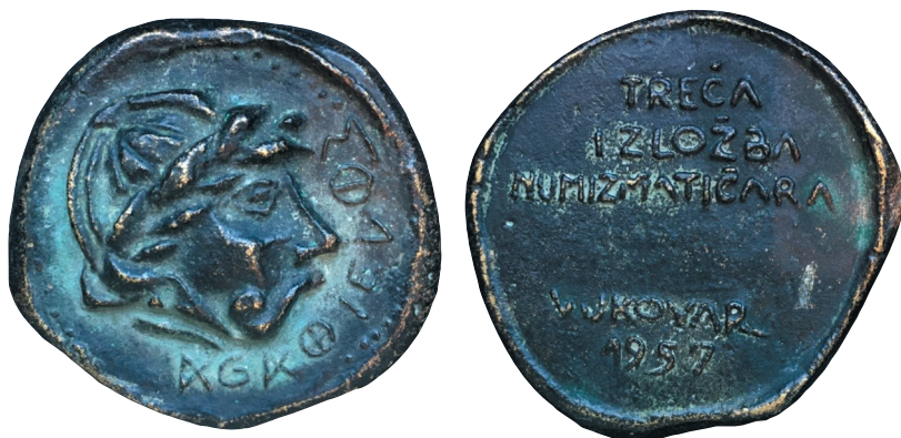
Ljevana dvostrana medalja, bronca, 49-52 mm, autor Brane Crlenjak.

Revers: Natpis u pet redaka: TREĆA / IZLOŽBA / NUMIZMATIČARA / VUKOVAR / 1957.