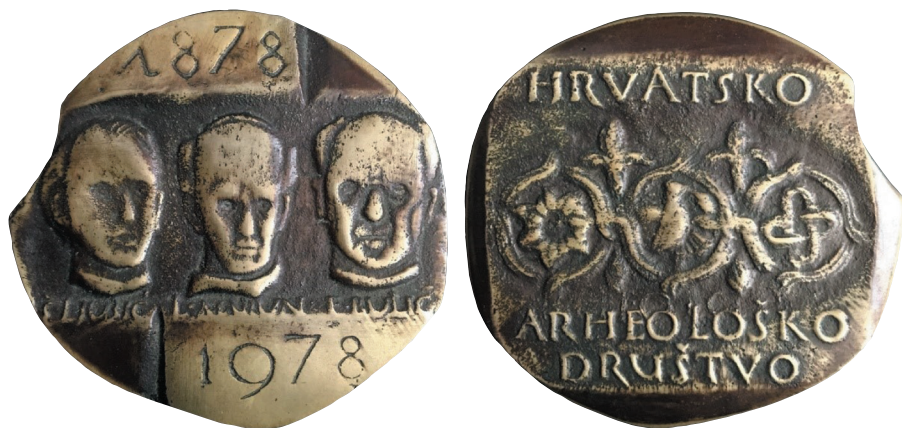
Dvostrana lijevana medalja, bronca, 63 - 65 mm, autor Ante Jakić.

Revers: Reljefni motiv antičkog vegetabilnog ornamenta od tri kružne vitice. Iznad natpis: HRVATSKO, a ispod natpis u dva retka: ARHEOLOŠKO DRUŠTVO.