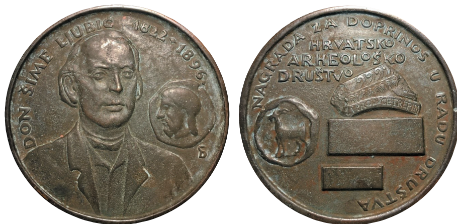
Dvostrana lijevana medalja, 100 mm, autor Stjepan Divković.