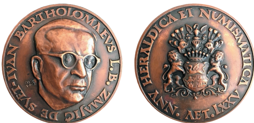
Dvostrana kovana medalja, tombak, 48 mm, autor Damir Mataušić.

Revers: U sredini grb obitelji Zmajić, uz rub tekst NNY HERALDICA ET NUMISMATICA AET. LXXV.