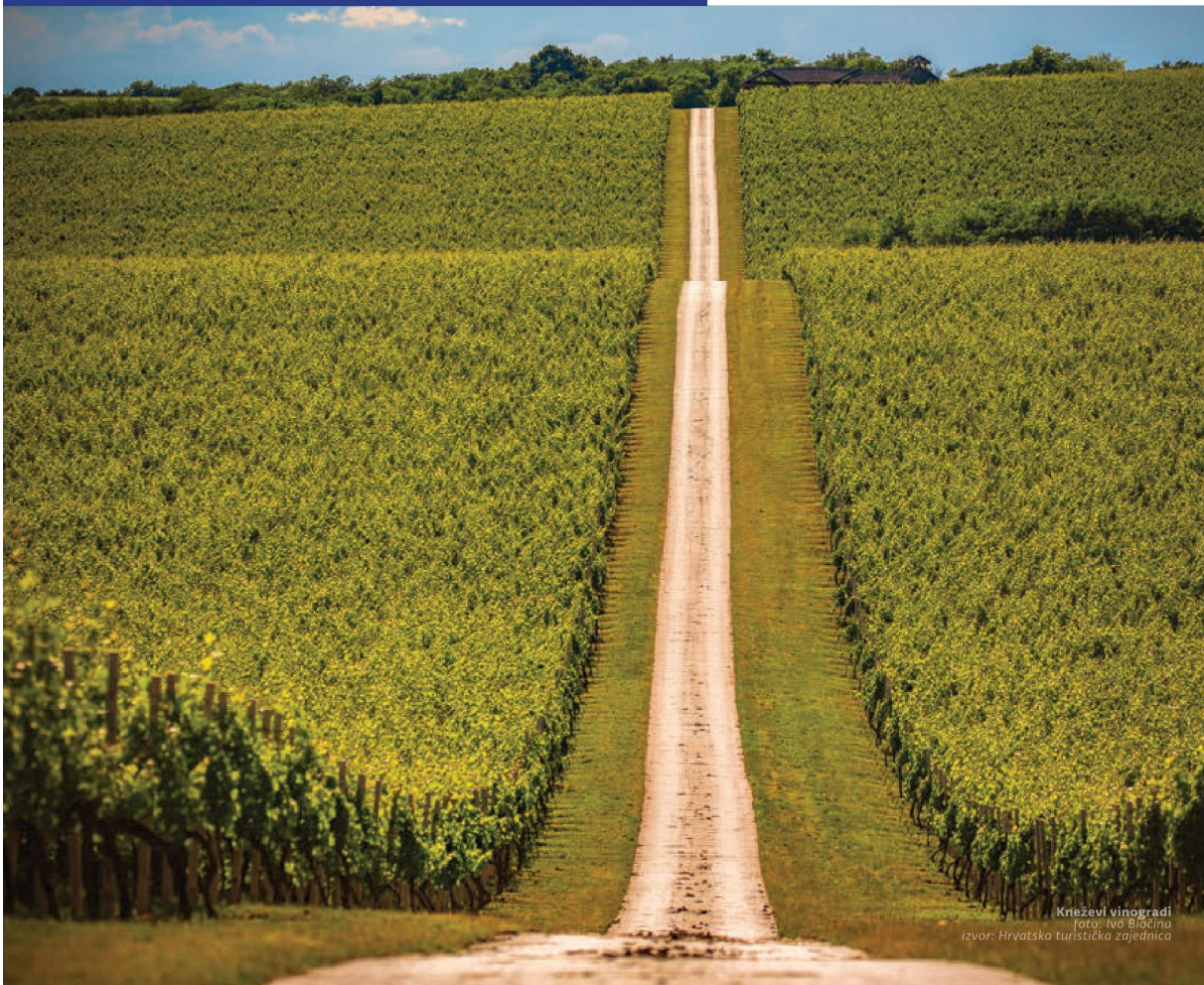
Kneževi vinogradi

Hrvatsko predsjedanje Vijećem Europske unije