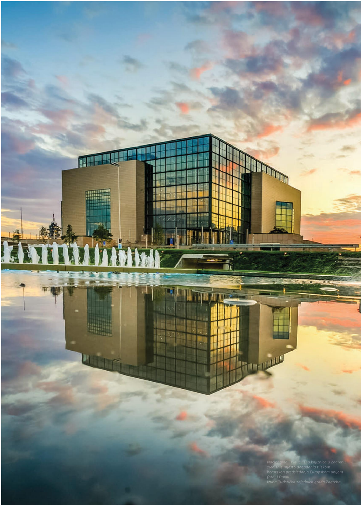
Nacionalna i sveučilišna knjižnica u Zagrebu, središnje mjesto događanja tijekom hrvatskog predsjedanja Europskom unijom