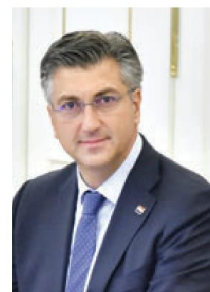
Andrej Plenković predsjednik Vlade

Od 1. siječnja do 30. lipnja 2020. Hrvatska će prvi put predsjedati Vijećem Europske unije. Tijekom šestomjesečnog razdoblja Hrvatska će voditi rad Vijeća kao pošten i neutralan posrednik, gradeći suradnju i dogovor među državama članicama u duhu konsenzusa i međusobnog uvažavanja.