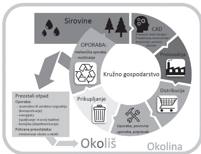
Slika 1. Koncept kružnog gospodarstva (Čatić, 2018.a)

S uporabom povezan je i pojam kružnog gospodarstva (eng. circular economy). To je danas jedno od najvažnijih područja povezanih s uporabom (Slika 1.) (Čatić, 2018.a).